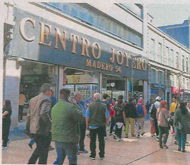
Joyerías en la zona centro, así como plazas en las que se vende oro y relojes de alta gama, cuentan ahora con cámaras y botones de pánico.

Bajo este modus operandi , la institución cuenta con, al menos, ocho carpetas de investigación que empezaron a recopilarse en junio del año pasado y que incrementaron en los meses de diciembre y enero de 2025.