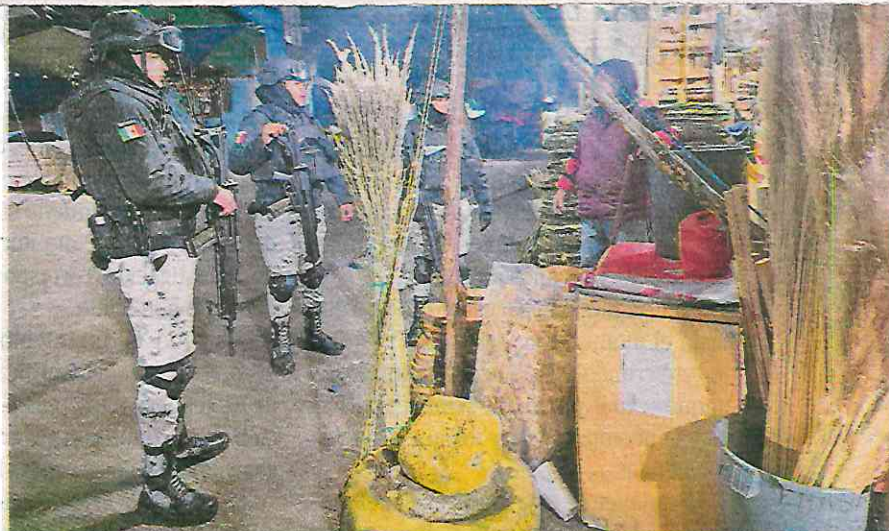
La GN realiza recorridos de seguridad en el interior y la periferia de este centro de comercio ubicado en la alcaldía Iztapalapa

Además, los invitan a hacer uso del número telefónico 088 de atención ciudadana, donde se reciben reportes, se canaliza y da seguimiento a las denuncias por posibles delitos o faltas administrativas.