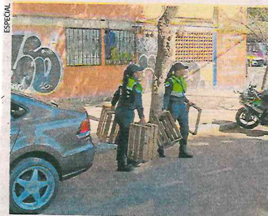
Elementos de la SSC retiraron huacales y otras herramientas utilizadas por los franeleros.

Cinco personas fueron remitidas ante el juez Cívico por apartar lugares y se retiró aproximadamente una tonelada de enseres obsoletos. ●