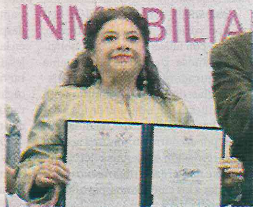
Va contra la corrupción

El futuro, acotó, tiene que llegar respetando los derechos de las comunidades y la voluntad de la gente, al mismo tiempo que ayuda a potenciar el desarrollo de las colonias y genere un impacto positivo en CDMX.