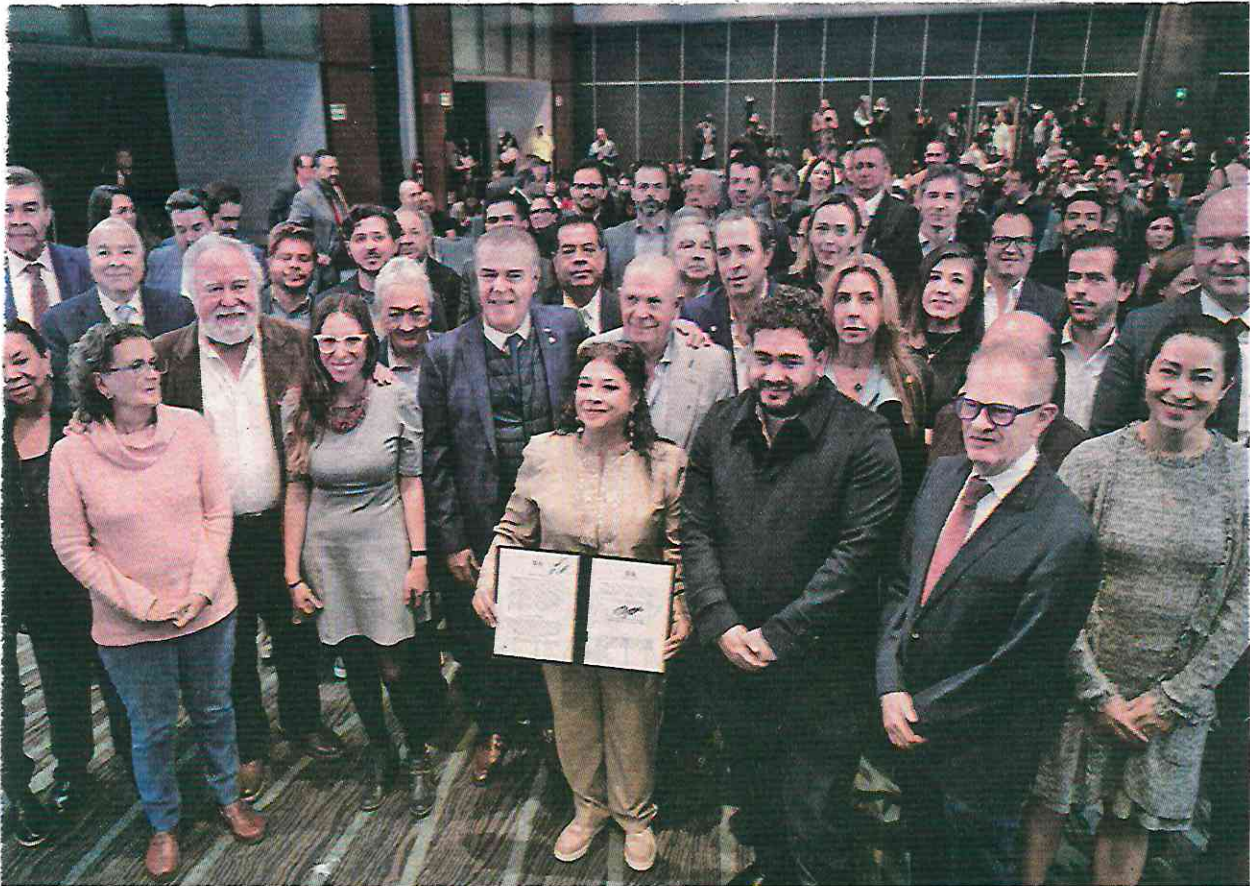
• DESARROLLO. La jefa de Gobierno aseguró que ayudará a detonar el crecimiento económico en la capital de país.