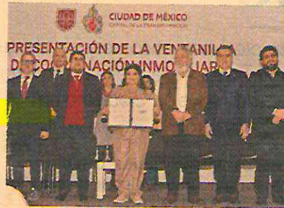
Clara Brugada enfatizó que el objetivo es impulsar, en el corto plazo, el crecimiento y el desarrollo económico de la Ciudad de México.

Uno de los objetivos de la administración de Brugada es lograr la edificación de más de 200,000 viviendas financiadas por el gobierno de la Ciudad de Mé-