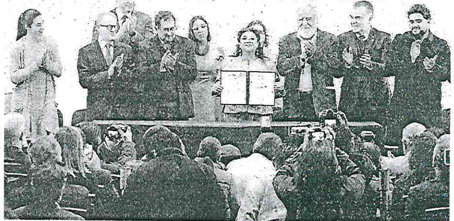
La jefa de Gobierno, Clara Brugada, encabezó la presentación del mecanismo

Subrayó que este proyecto busca respetar los derechos de las comunidades y la voluntad de la gente, para que se logre potenciar el desarrollo de las colonias y que genere un impacto positivo en la ciudad.