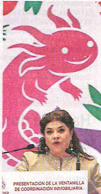
PRESENTACIÓN DE LA VENTANILLA DE COORDINACIÓN INMOBILIARIA

“Es un instrumento de carácter resolutivo, no vamos a