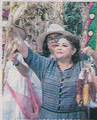
Por la soberanía alimentaria

La oposición entreguista aplaude la intromisión, postura antimexicanista es traidora a la nación