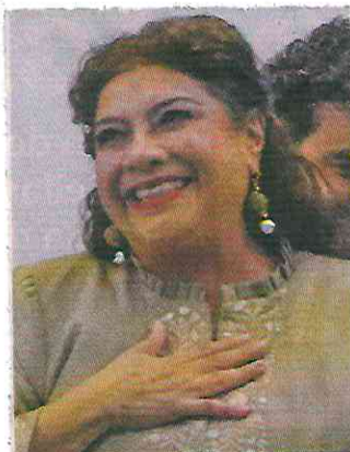
Clara Brugada, Jefa de Gobierno

/// Queremos que los proyectos arraiguen a las personas que viven en las colonias; no queremos proyectos que afecten la vida de la comunidad”.