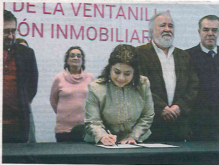
Clara Brugada, jefa de Gobierno de la Ciudad de México, destacó que esta iniciativa fortalecerá la economía local.

“Seguiremos trabajando de la mano del sector inmobiliario con este espacio único, donde los empresarios podrán saber en todo momento cuál es el estatus de su trámite y tendrán acompañamiento en cada paso, porque queremos más y mejor vivienda en la capital, para que las familias crezcan y tengan un