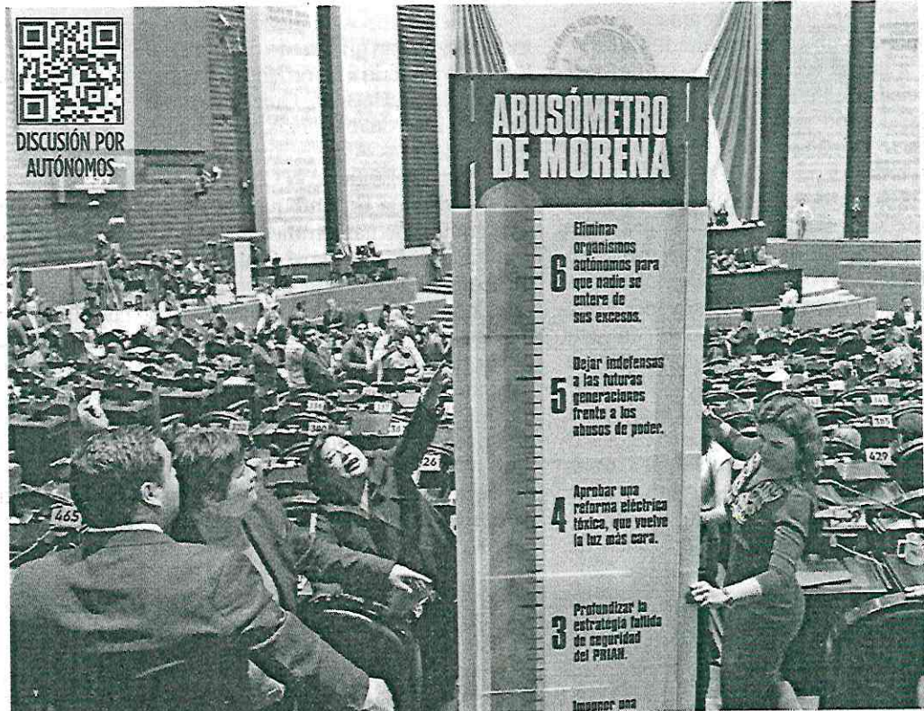
Integrantes de la bancada emecista colocaron lo que llamaron el "abusómetro" de Morena, donde enumeraron reformas y políticas de gobierno cuestionadas por distintos sectores.

Tras la discusión en lo particular de la reforma que elimina siete órganos autónomos, Morena y sus aliados avalaron con 332 votos a favor y 119 en contra modificaciones a los artículos 27 y 28 de