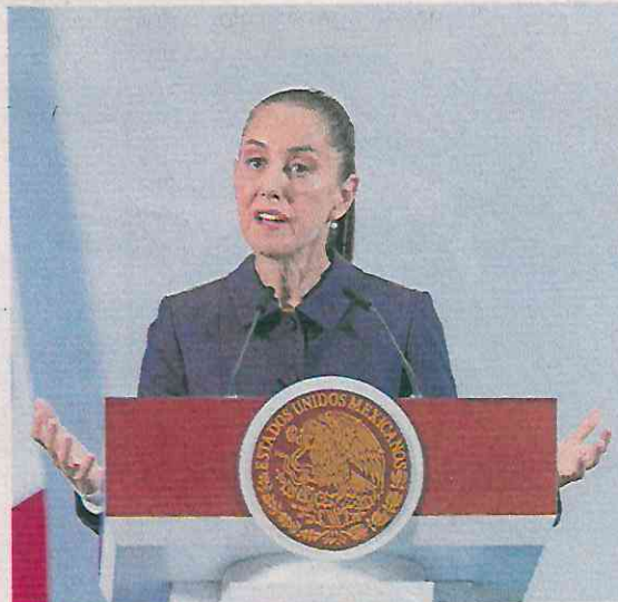
La presidenta Sheinbaum señaló que su gobierno trabaja en una estrategia ante deportaciones masivas.

Ayer, en conferencia de prensa la Mandataria aseguró que cuando se realicen las reuniones con el equipo del próximo presidente de Estados Unidos su gobierno expondrá la importancia del trabajo que realizan los mexicanos en ese país, no sólo por el pago de impuestos, sino por