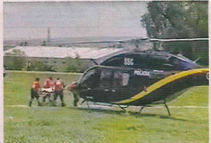
■ Un adulto mayor fue herido y trasladado vía aérea.