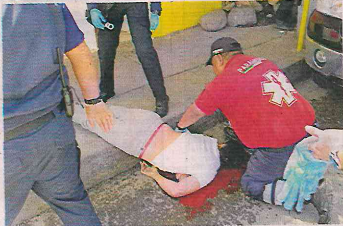
■ Paramédicos confirmaron la muerte del mando capitalino.