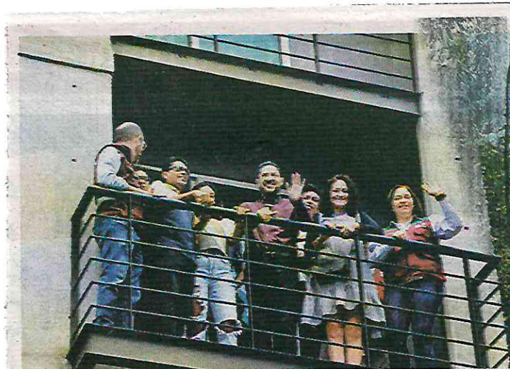
El jefe de Gobierno en el edificio en Paz Montes de Oca.

“Hemos estado entregando obra y obra a lo largo de todo este periodo. Nos falta solamente una que tiene un problema, es la de Aguascalientes, donde hay una discusión, porque unos vecinos dicen que hay que rehabilitar y otros que hay que reconstruir, aunque el dictamen señala que hay que rehabilitar; sin embargo, algunos insisten en la reconstrucción total y demolición”, expuso. —