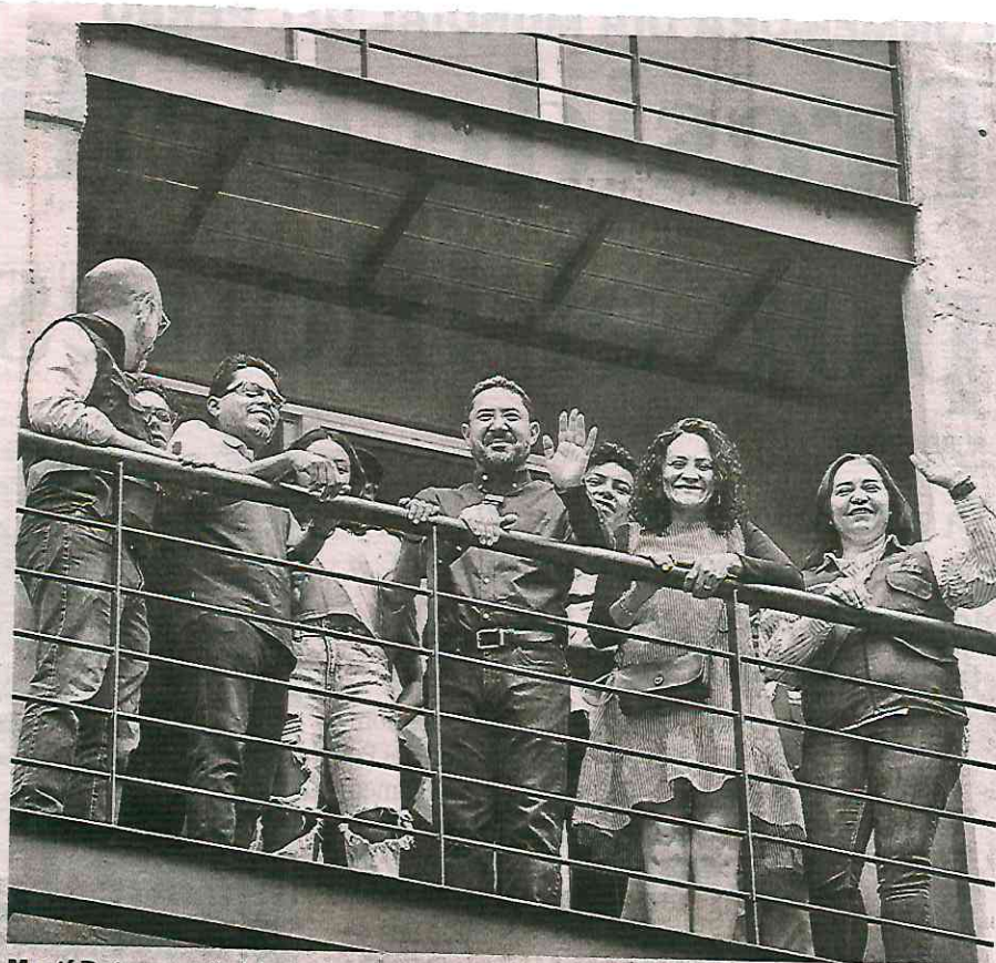
Martí Batres realizó la entrega del edificio reconstruido en la calle Paz Montes de Oca 93 en la alcaldía Benito Juárez

das unifamiliares de familias de escasos recursos y la otra mitad en el casco central en Benito Juárez y Cuauhtémoc en edificios de familias de clase media.