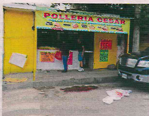
las indagaciones y obtener información que les ayude a dar con los agresores