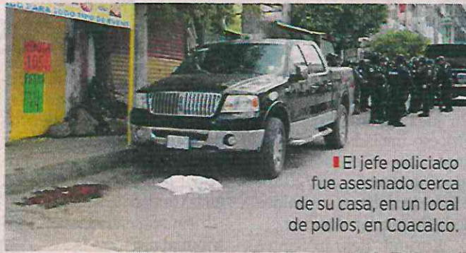
El jefe policiaco fue asesinado cerca de su casa, en un local de pollos, en Coacalco.

El Comisario Jefe se desempeñaba actualmente como coordinador general de la Unidad de Estrategia, Táctica y Operaciones Especiales de la SSC y tenía a su cargo investigaciones especiales.