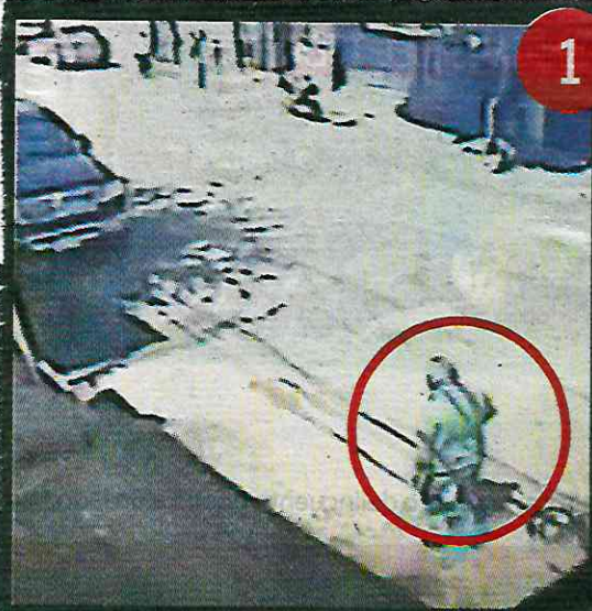
El atacante descendió de un vehículo y se acercó al mando que estaba frente a un local.