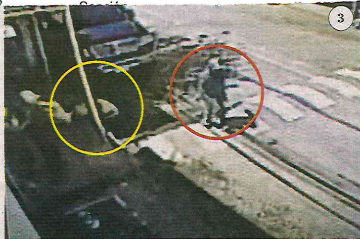
Secuencia de una cámara de seguridad en la que se observan los movimientos del agresor.

CARLOS VEGA, LAURO GALICIA Y GASPAR VELA/ CIUDAD DE MÉXICO