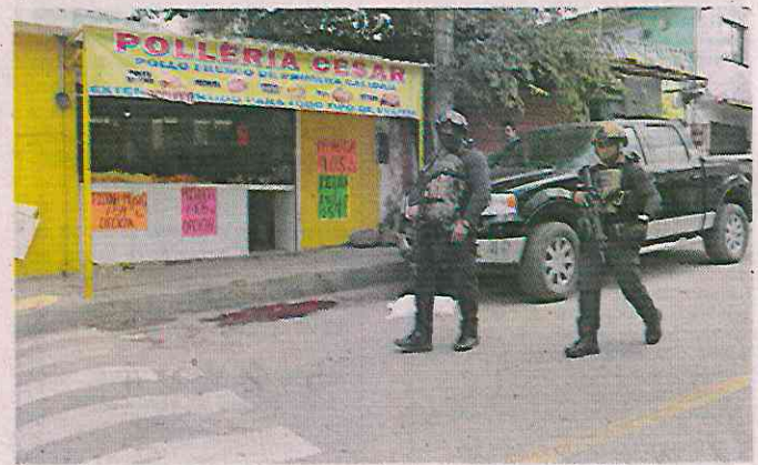
■ El ataque fue frente a una pollería en el Centro de Coacalco.