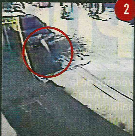
Al estar detrás de su víctima, el sicario disparó en por lo menos tres ocasiones.