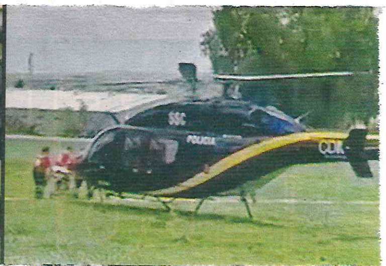
■ Paramédicos sólo confirmaron la muerte del mando capitalino.