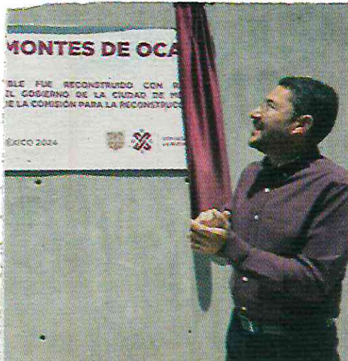
Batres destacó esfuerzos de reconstrucción