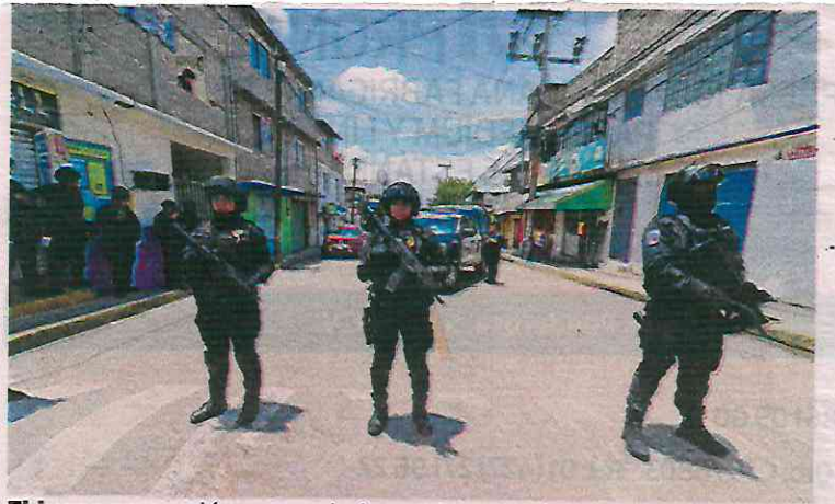
El lugar se quedó resguardado por las autoridades para continuar con