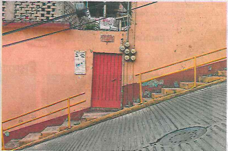
La también llamada bajada del diablo ya es un lugar casi turístico.