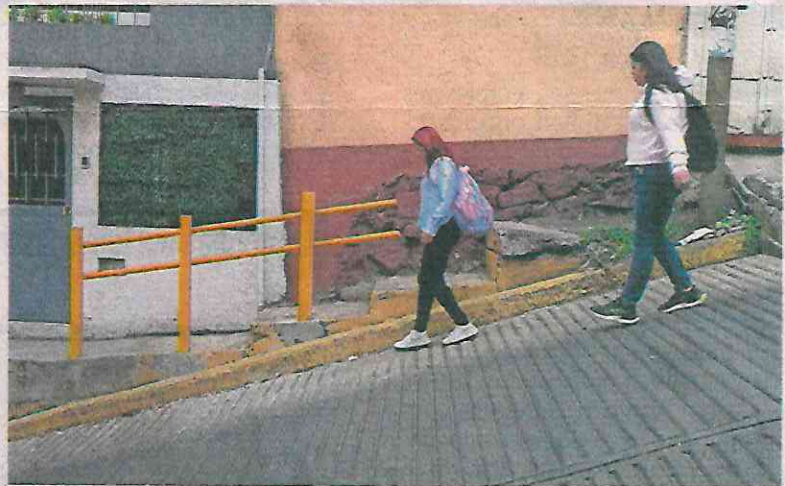
Es de las calles más riesgosas por su inclinación, dicen los vecinos.

Las palabras de la adulta mayor son confirmadas por doña Mary,