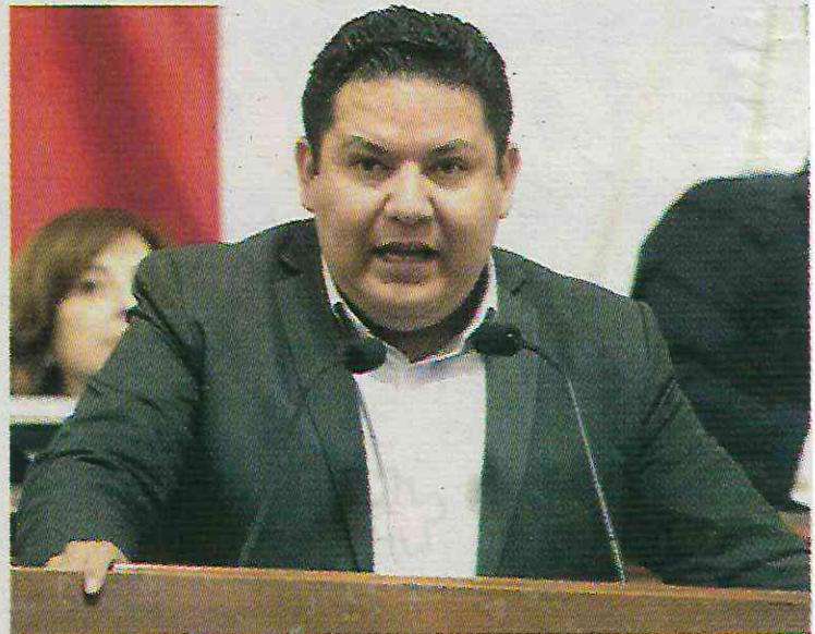
Regresará a la alcaldía