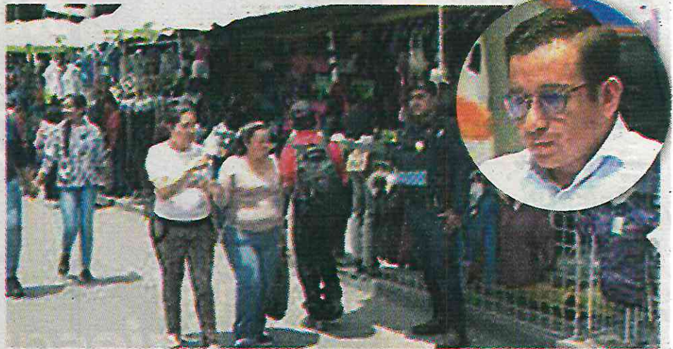
Los cobros ilegales a los vendedores suman unos 250 mil pesos a la semana

Un ejemplo de ello es una vendedora de alimentos que