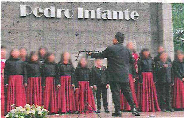
EL CORO de Niños Voces Blancas, en la inauguración del Foro, el pasado sábado.