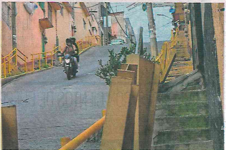
Motocicletas y autos registran accidentes en la calle Paso Florentino.