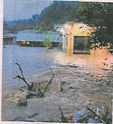
Las lluvias de los últimos días inundaron varias zonas del estado.