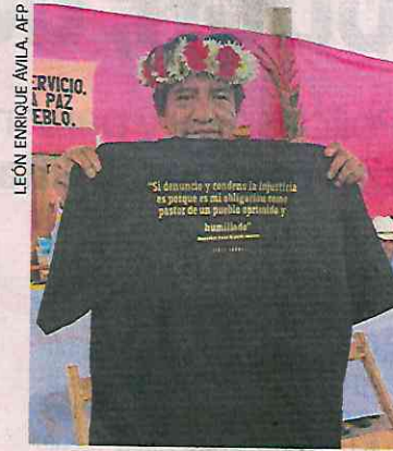
LEÓN ENRIQUE ÁVILA, AFP

En 2001, Pérez Pérez fue designado capellán en el municipio de Chenalhó; tres años después de que un grupo armado