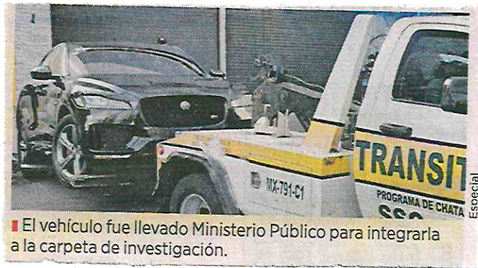
El vehículo fue llevado al Ministerio Público para integrarla a la carpeta de investigación.

La unidad, que aún se desconoce cómo terminó en el museo, fue puesta a disposición del Ministerio Público.