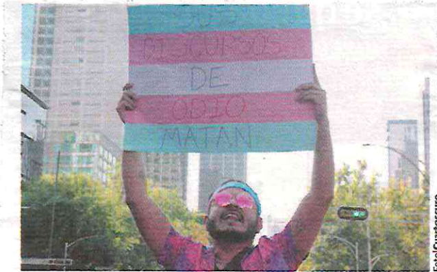
JOVEN protesta en contra de los transfeminicidios en la capital del país, en enero pasado.