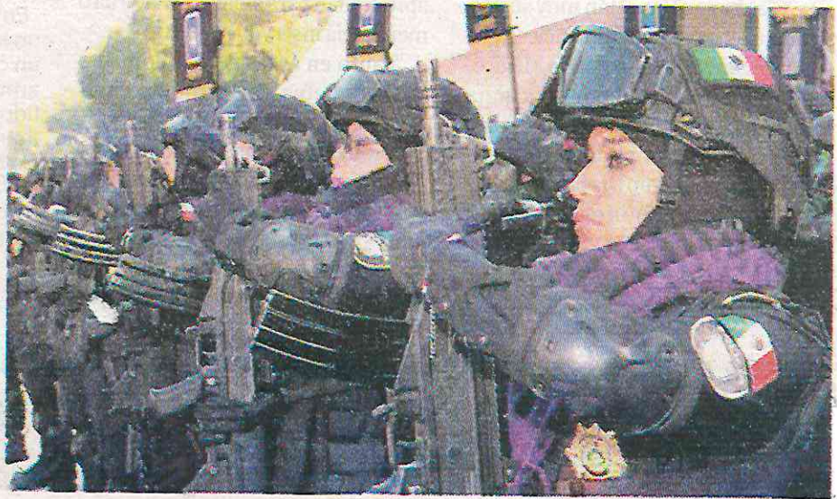
Los capitalinos consideran como ineficaz el desempeño de los elementos

De acuerdo con el INEGI, durante el tercer trimestre de este año, en la capital del país, en promedio, 1 de cada 2 ciudadanos consideró como ineficaz el desempeño de los elementos de la SSC, mientras que hubo regiones de la megalópolis, en especial en la zona norte, donde el 60% de las habitantes refirió que la policía, es una autoridad que les inspira desconfianza. Además, esta baja calificación se debe a que entre 2023 y julio de este año se iniciaron un total de mil 920 carpetas de