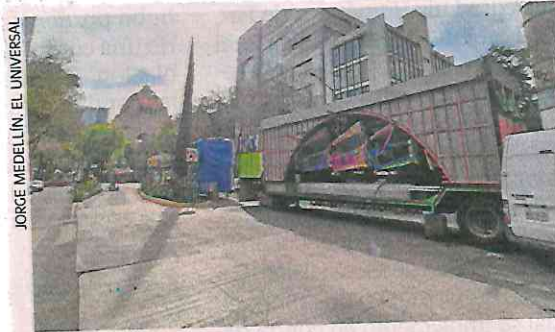
JORGE MEDELLÍN, EL UNIVERSAL