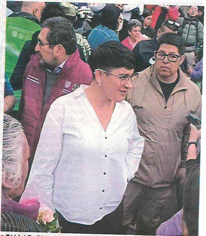
● FALLAS. Observan muy poca cercanía hacia los xochimilcas.

Tiene 28 por ciento de las solicitudes sin ser atendidas.