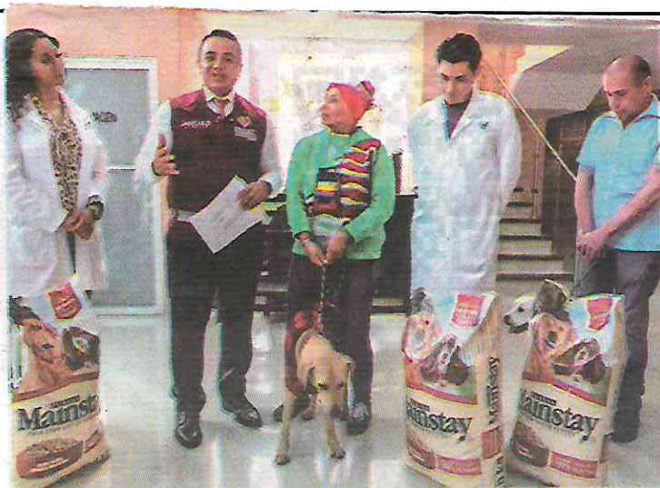
La dueña del primer perrito adoptado recibió, de parte de Janecarlo Lozano, alcalde de la GAM, cuatro costales de croquetas para que pueda ser alimentado los próximos seis meses.