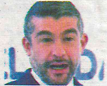
Tabe hizo una acción irregular

La alcaldía enfrenta críticas por su gestión en temas como feminicidios, seguridad, movilidad y medio ambiente