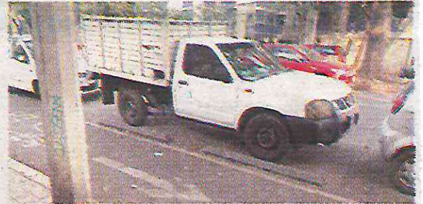
En áreas verdes y banquetas se acumula suciedad

Con esta falta de mantenimiento y vigilancia, el alcalde Mauricio Ta-