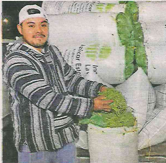
Cerca de 800 productores abastecerán la romería

Datos de la Comisión de Recursos Naturales y Desarrollo Rural (Corenadr) indican que para este año se venderán cuatro toneladas de romeritos