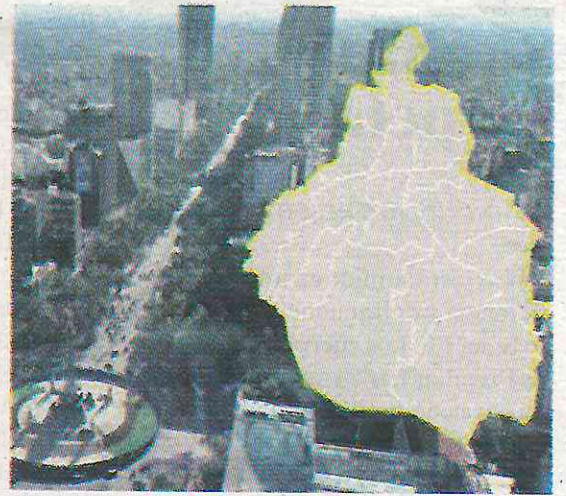
Protegerán los derechos culturales

Torres enfatizó que los funcionarios de estas áreas deberán cumplir con requisitos específicos para garantizar una adecuada