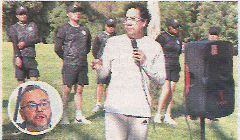
• Pusieron a bailar zumba a los corredores del parque La Cañada

Estas actividades físicas, pudieron estar a cargo de áreas especializadas como la Subdirección de Educación Física y Deporte o la JUD de Promoción y Fomento al Deporte de La Magdalena Contreras