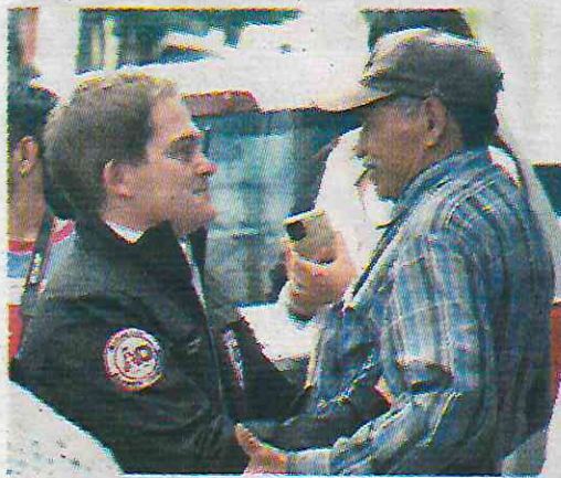
Acusaron la mala organización del edil