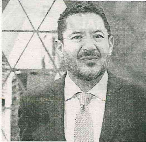
Jefe de Gobierno en la capital