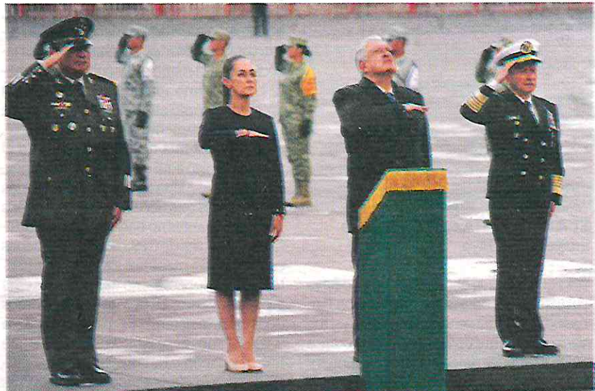
DE IZQ. a der.: El titular de Sedena, Luis Crescencio Sandoval; la Presidenta electa, Claudia Sheinbaum; el Presidente López Obrador y el titular de Semar, Rafael Ojeda, ayer.

EL EJECUTIVO y la Presidenta electa montan guardia de honor en el Zócalo capitalino; invierten 33 mil mdp para reconstruir edificaciones afectadas por el sismo de 2017