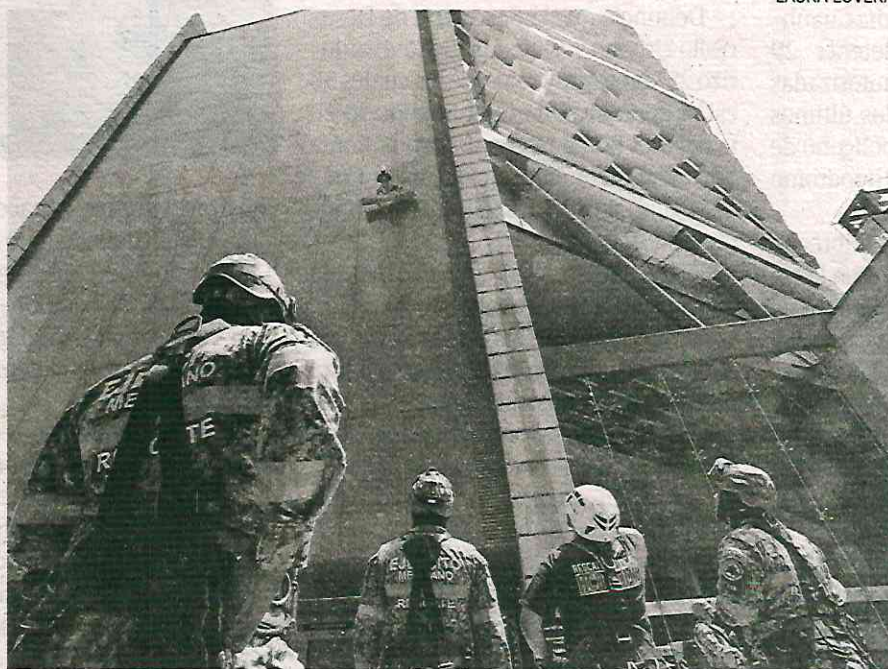
En el simulacro de ayer participaron más de 26 mil inmuebles

Durante una entrevista, afirmó que la capital del país tiene el sistema de