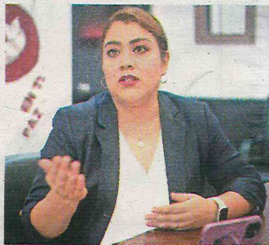
Su sueldo es de 78 mil 636 pesos

Durante 2023, año al que corresponden los ingresos señalados, Hernández Calderón tuvo una administración que se caracterizó por el incremento de inseguridad, a pesar del constante discurso que hizo la alcaldesa sobre la implementación de estrategias de seguridad. También fue un año en el que los reportes de falta de luminarias tuvieron auge en varias colonias, al