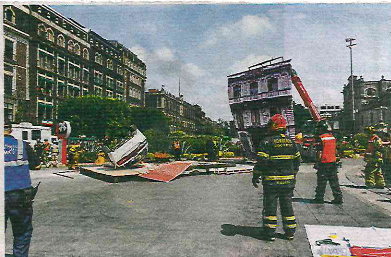
PROTOCOLO. Elementos del Heroico Cuerpo de Bomberos capitalinos simularon la caída de un vehículo de un tercer piso y el rescate del conductor.

Adicional a los altavoces, por primera vez se envió un mensaje de texto con alertamiento sonoro a te-