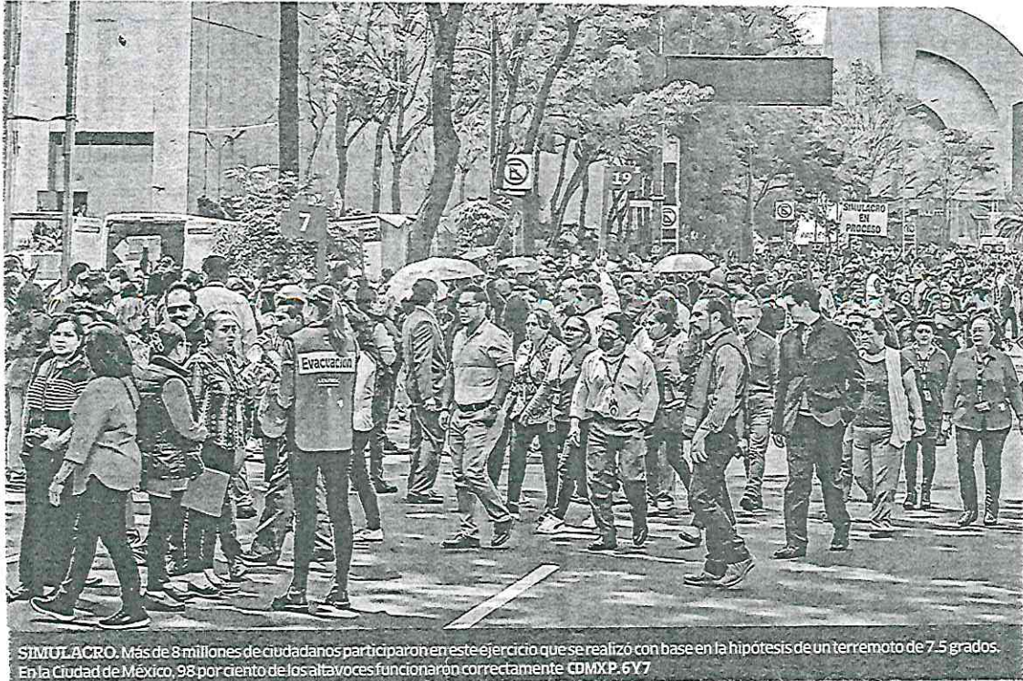
SIMULACRO. Más de 8 millones de ciudadanos participaron en este ejercicio que se realizó con base en la hipótesis de un terremoto de 7.5 grados. En la Ciudad de México, 98 por ciento de los altavoces funcionaron correctamente. CDMXP. 6Y7

8 MILLONES 400 MIL CIUDADANOS PARTICIPARON EN EL EJERCICIO