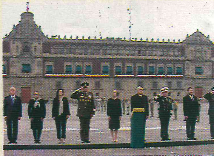
Encabezó la ceremonia conmemorativa

La mañana del 19 de septiembre de 2024, el presidente Andrés Manuel López Obrador, acompañado de la