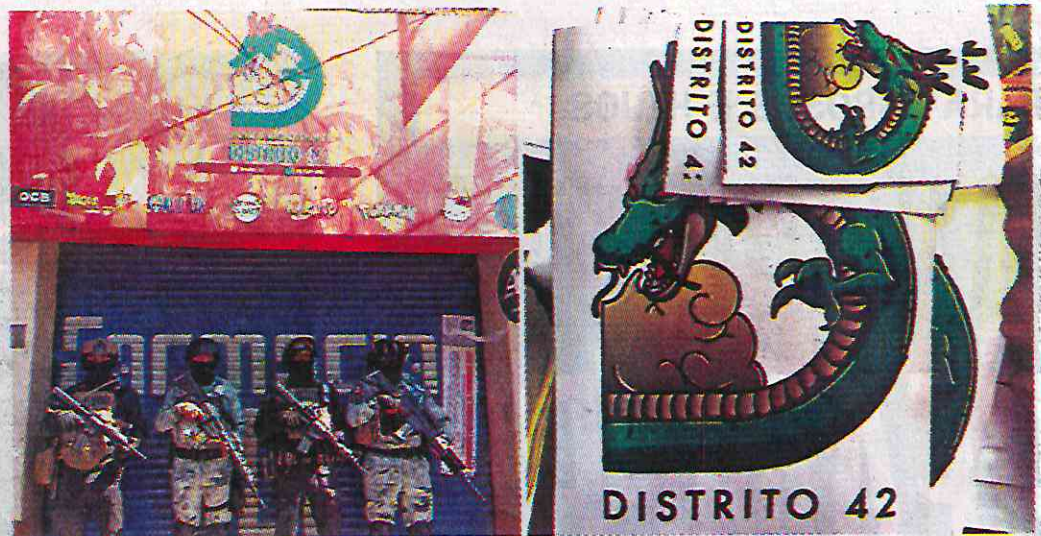
En el inmueble, ubicado en la calle Héroes de Churubusco, se simulaba la venta de artículos Otaku.

La palabra clave para la venta era "Choko" y, poste-