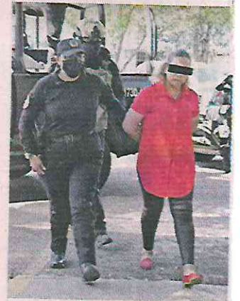
La encargada fue detenida y se decomisaron 134 dosis de droga.

edad, que se presume era encargada del establecimiento y de la venta de la droga.