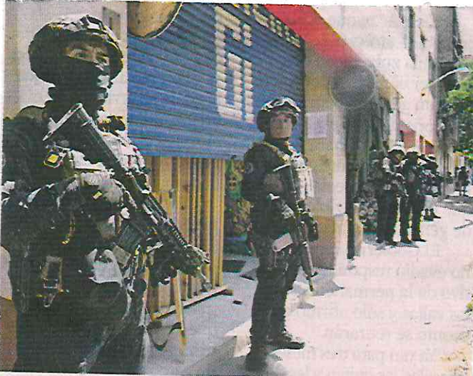
El cateo se realizó en el negocio llamado 'Distrito 42'.