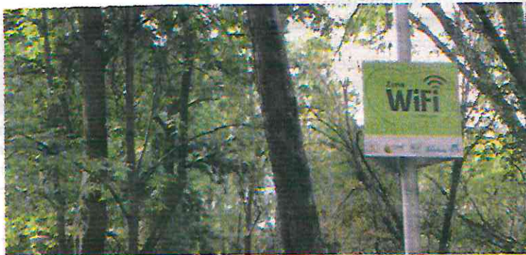
Los atacantes también pueden crear puntos de acceso WiFi falsos con nombres similares a los de redes legítimas.

• Desactivar la opción de compartir archivos y la detección de redes en el dispositivo cuando se esté conectado a una red WiFi pública, con esto se evita que otros usuarios en la misma red accedan a los archivos y dispositivos • (Jorge Aguilar)