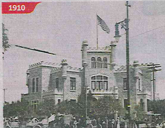
1910 La sede diplomática de EU encabezada por Henry Lane Wilson se ubicó en la esquina de Puebla e Insurgentes, Colonia Roma.

“La parte central de la mudanza deberá lograrse en un periodo de 64 días, incluidos nueve fines de semanas, y para reducir el tiempo lo más posible, las oficinas de la Embajada estarán cerradas al público”, dice la convocatoria.