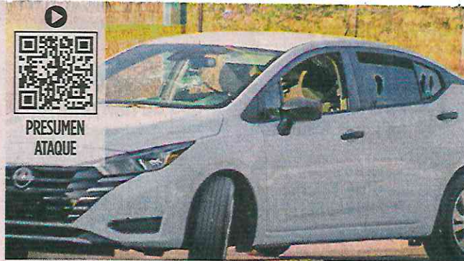
■ En la zona de Villas del Río, un grupo armado atacó al agente mientras gritaba: "¡Gente del puro Chapo!".

Operativos federales recientes han tenido como objetivo detener a "El Mochomito", pero ha escapado en distintos intentos.