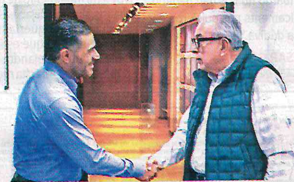
El secretario de Seguridad, Omar García Harfuch, saluda al gobernador de Sinaloa, Rubén Rocha.