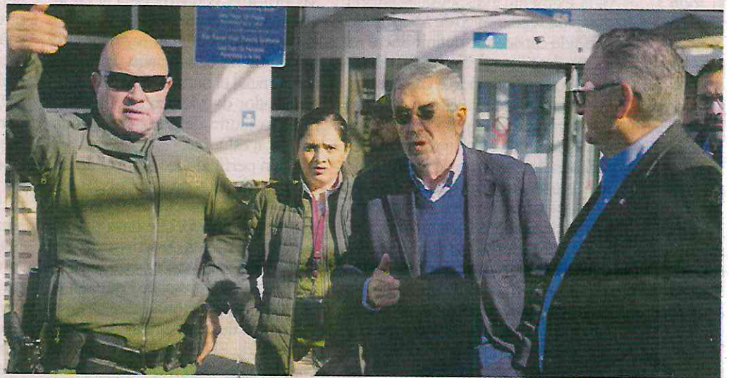
El Canciller Juan Ramón de la Fuente realizó un recorrido por el punto de deportaciones del puente Internacional Paso del Norte.

“Primero, la estrategia de defensa legal para todas y todos nuestros paisanos. No están solos, no van a estar solos, y tenemos las asesorías jurídicas necesarias para que, si se requiere, puedan hacer valer sus derechos”, dijo ayer el Canciller en un