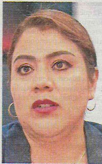
Ha dado contratos a empresa