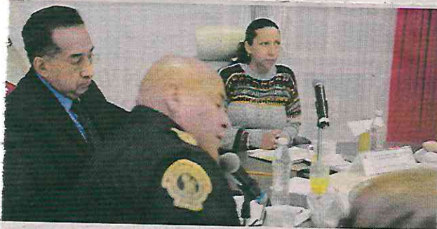
Este éxito de la alcaldía encabezada por