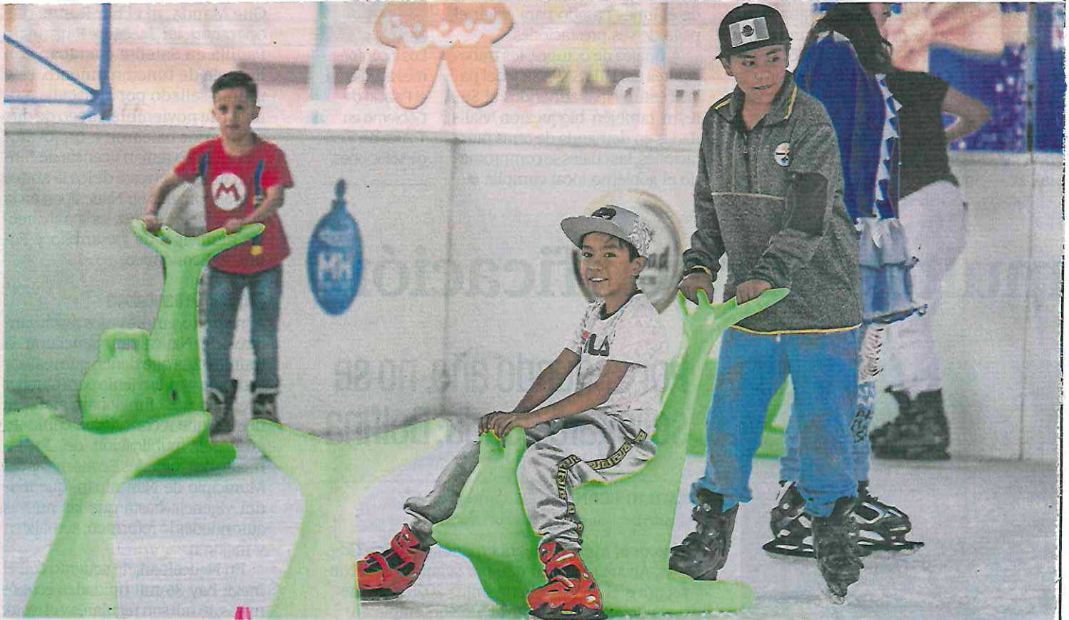
Algunos niños se apoyaron en focas de plástico para patinar. La pista de hielo estará abierta al público, de manera gratuita, hasta el 5 de enero.