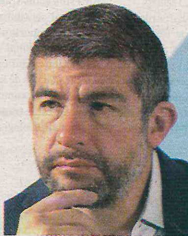
El panista ha despilfarrado dinero

Durante el fin de año de 2022, la administración del alcalde panista efectuó al menos tres contratos para pagar eventos navideños. Este es el caso de la contratación de la empresa Zuno Tech S.A. de C.V. por 1 millón 508 mil pesos en la adquisición de aguinaldos y piñatas para las posadas promovidas por la demarcación.