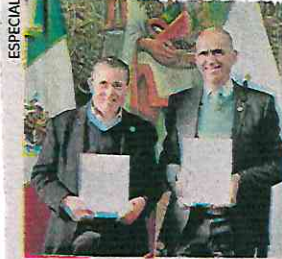
Este convenio permitirá mejorar la vigilancia, dijo el edil de Coyoacán (izq.).