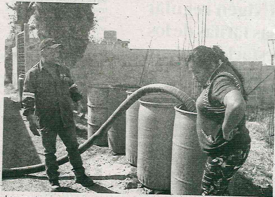
Los reportes aumentaron

El alcalde morenista desde que contendió en las pasadas elecciones anunció que en su gobierno implementaría el programa Un chorro de agua para distribuir agua por camiones cisternas, pero esta estrategia no ha iniciado.