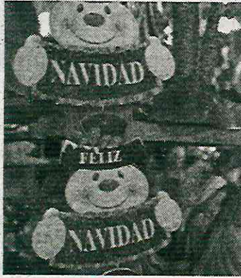
Reforzarán identidad social