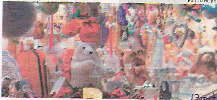
Bazares navideños CDMX.

El Congreso de la Ciudad de México aprobó una proposición para exhortar a la Secretaría de Desarrollo Económico (Sedeco) local y las 16 alcaldías a coordinarse para organizar ferias y bazares con motivo de las festividades decembrinas, con la finalidad de impulsar la reactivación económica en beneficio de pequeños y medianos negocios.