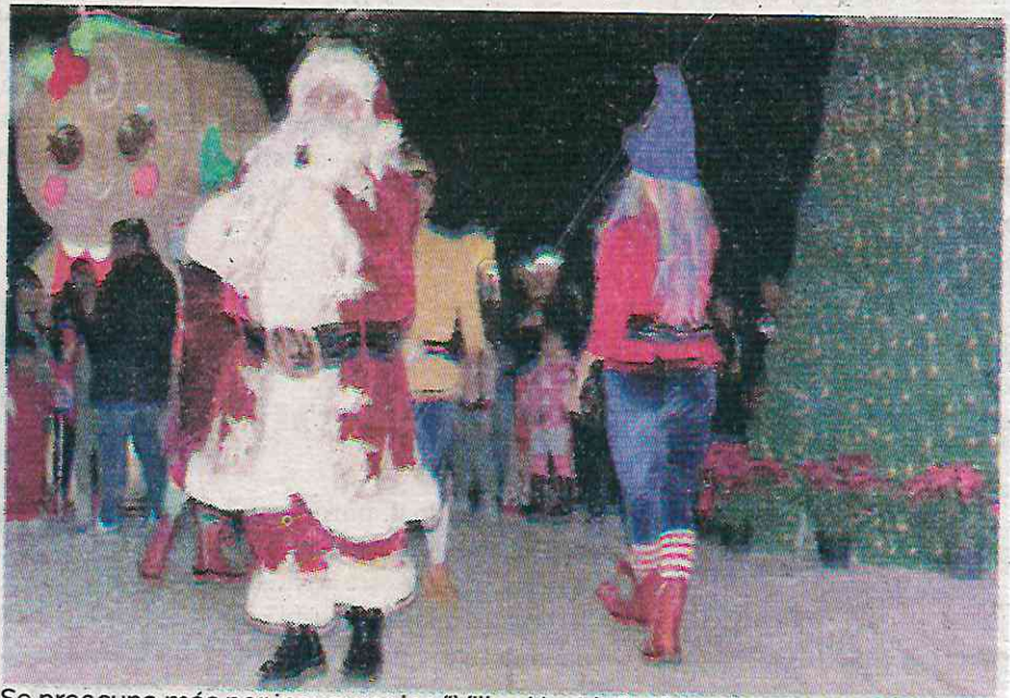
Se preocupa más por inaugurar las "Villas Navideñas" que resolver problemas