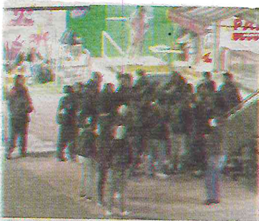
Desmanes se han dado en Bachilleres 3