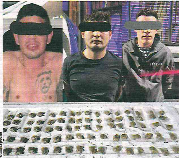
LOS TRES hombres detenidos por policías en Cuauhtémoc.

No obstante, detalló la SSC, vecinos de un inmueble salieron a la calle e intentaron impedir que los uniformados los subieran a la patrulla. Entre el tumulto, los oficiales solicitaron refuerzos y detuvieron a los jóvenes.