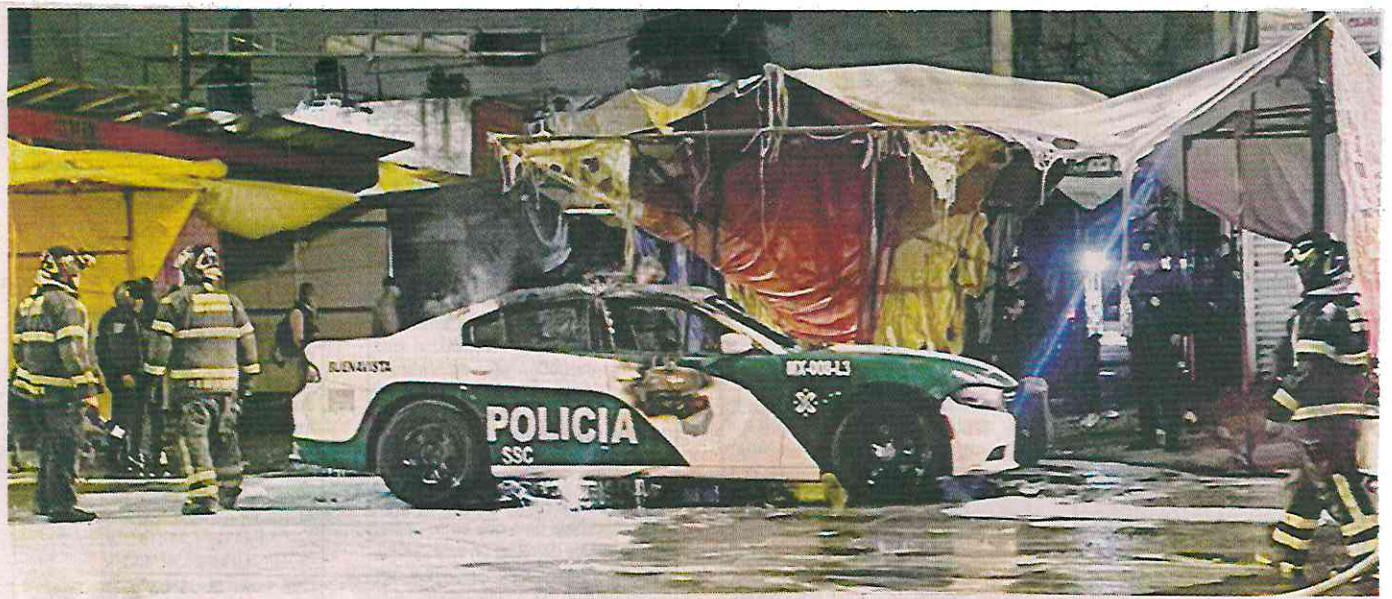
■ Elementos del Heroico Cuerpo de Bomberos acudieron para sofocar las llamas del vehículo oficial.