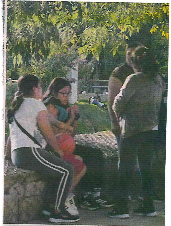
El cuerpo del adolescente fue colocado sobre el pasto, donde sus familiares lloraron su pérdida.

Policías acordonaron la zona donde pusieron el cuerpo del joven, en espera de peritos de la Fiscalía, mientras que se escuchaba el llanto de los familiares que se recostaban en el pasto junto al cuerpo del menor para abrazarlo.