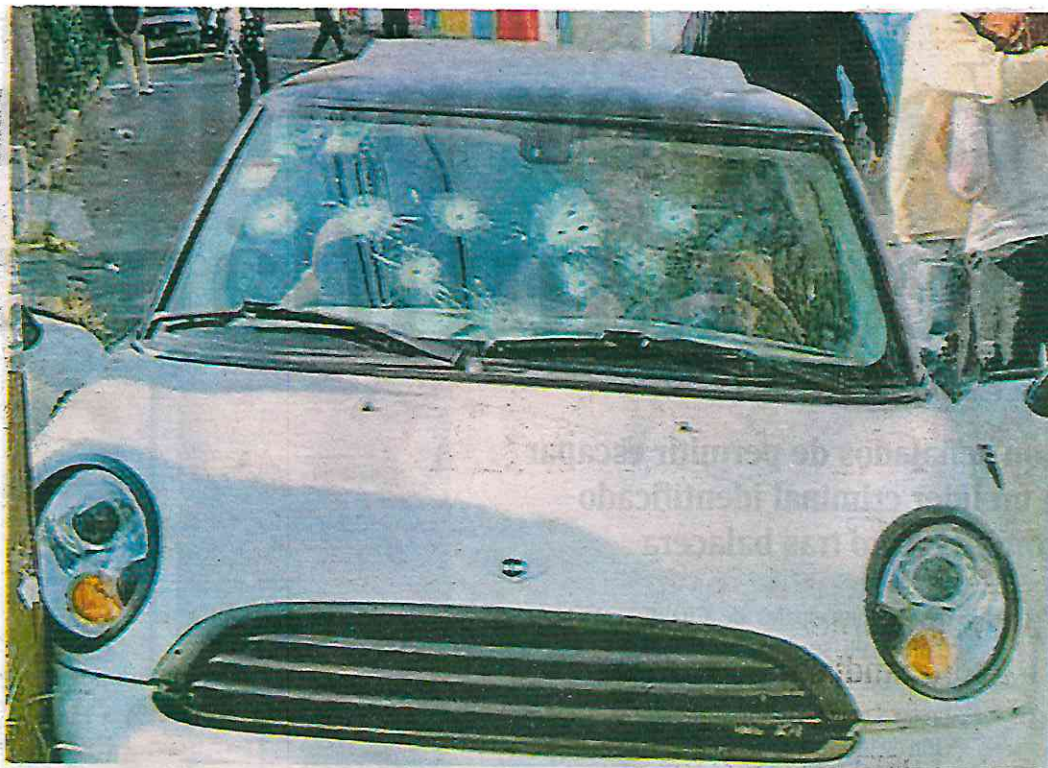
El hombre al recibir los balazos perdió el control del automóvil y chocó contra un poste

en el cuerpo, de los cuales tres habían sido en la cabeza.