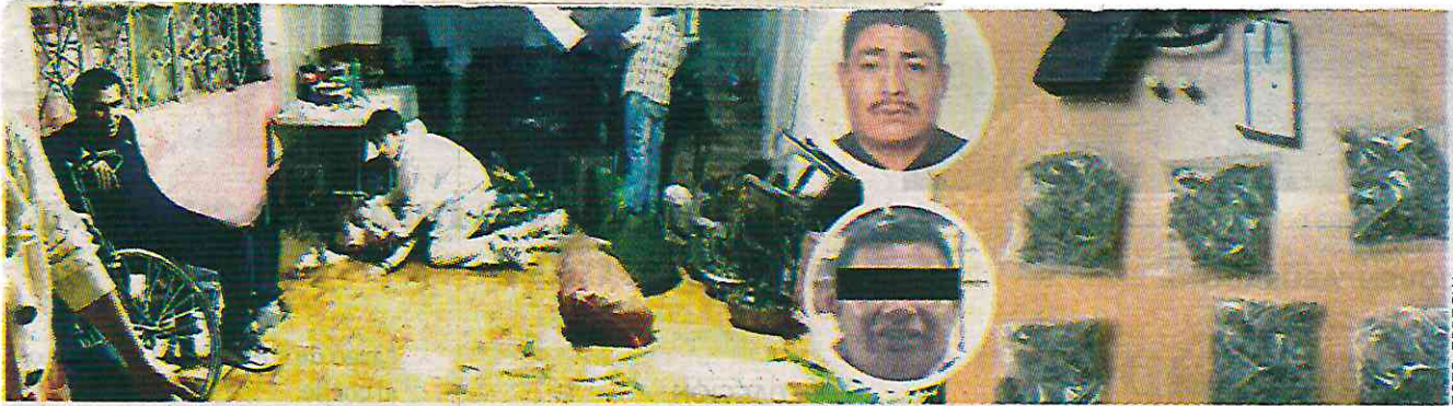
Los pistoleros dispararon contra los presentes que estaban en el ritual