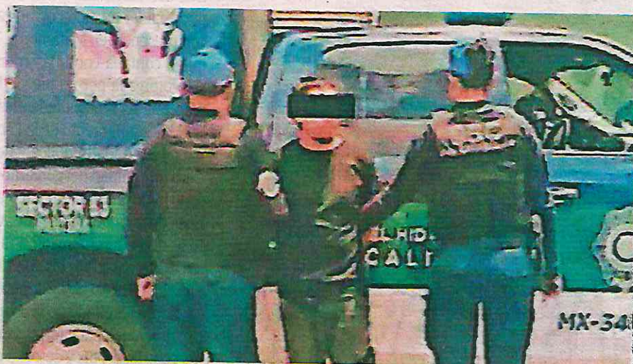
El detenido fue presentado ante la víctima, quien lo reconoció plenamente, motivo por el cual fue presentado y quedó a disposición del MP

De acuerdo a información preliminar, la víctima caminaba sobre la avenida Sactorum cuando fue abordado por un sujeto, quien, portando un arma blanca, lo