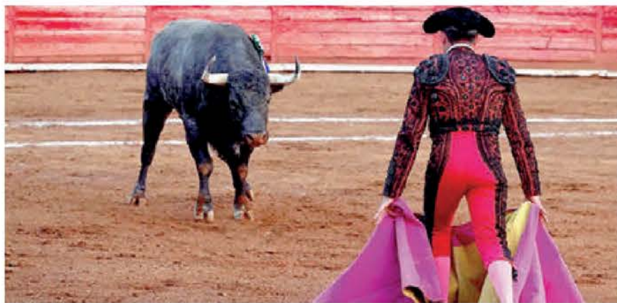
Queda prohibida la utilización de objetos punzantes que provoquen heridas, lesiones o la muerte del animal; solo se puede utilizar el capote y la muleta. Especial

Asimismo, al finalizar el espectáculo taurino sin violencia, el toro o novillo deberá ser devuelto a la ganadería o al propietario, además de que “deben protegerse los cuernos del toro o novillo para prevenir le-