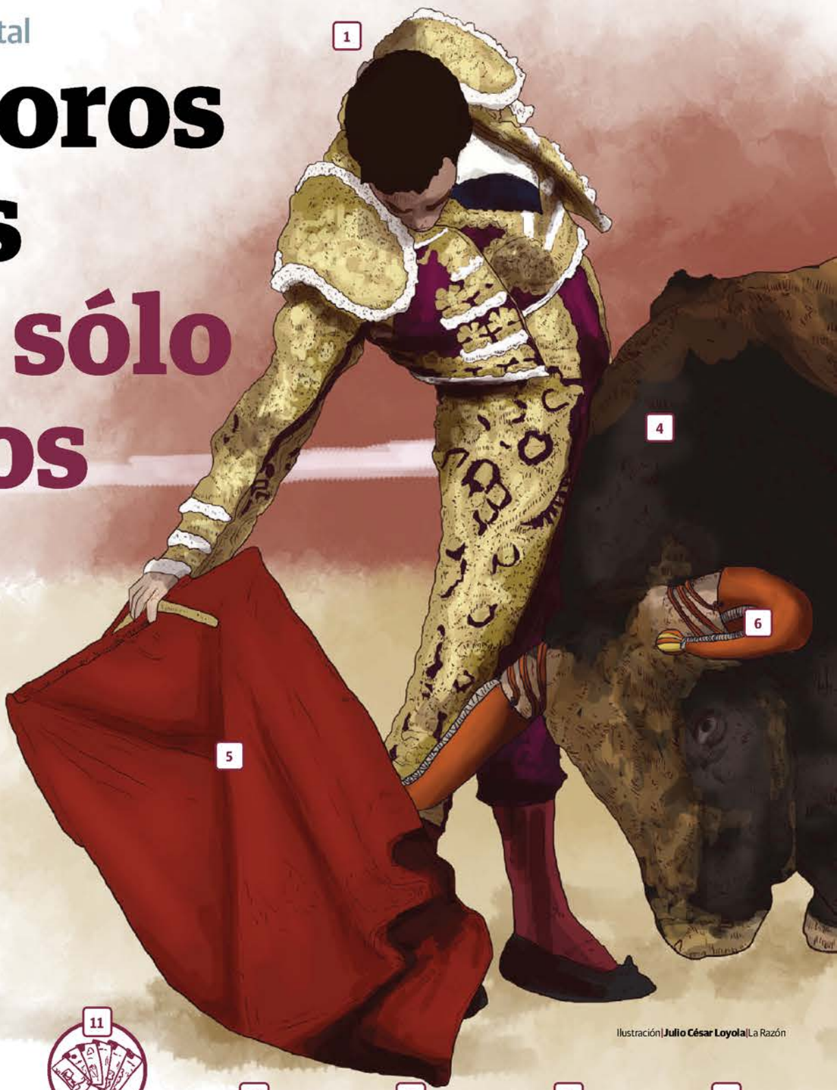
Ilustración | Julio César Loyola | La Razón

Haces Lago también presentó reservas al dictamen, entre ellas el definir con puntualidad el concepto de persona torera, así