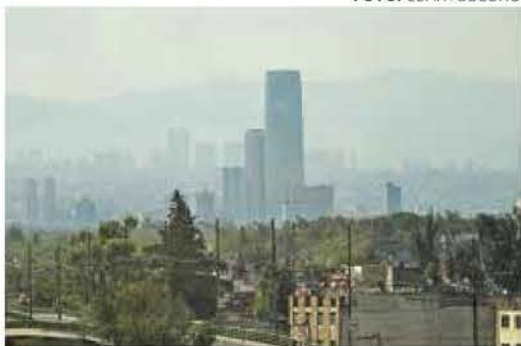
● RIESGO. El cielo capitalino lució gris.