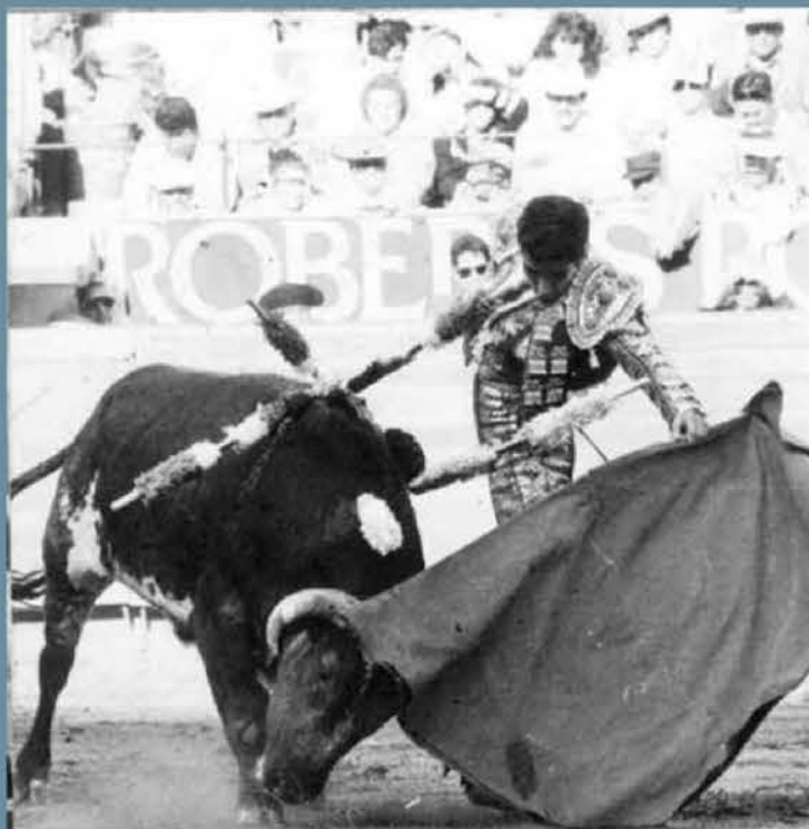
La Plaza México, a punto de cumplir 80 años, vivirá cambios profundos.