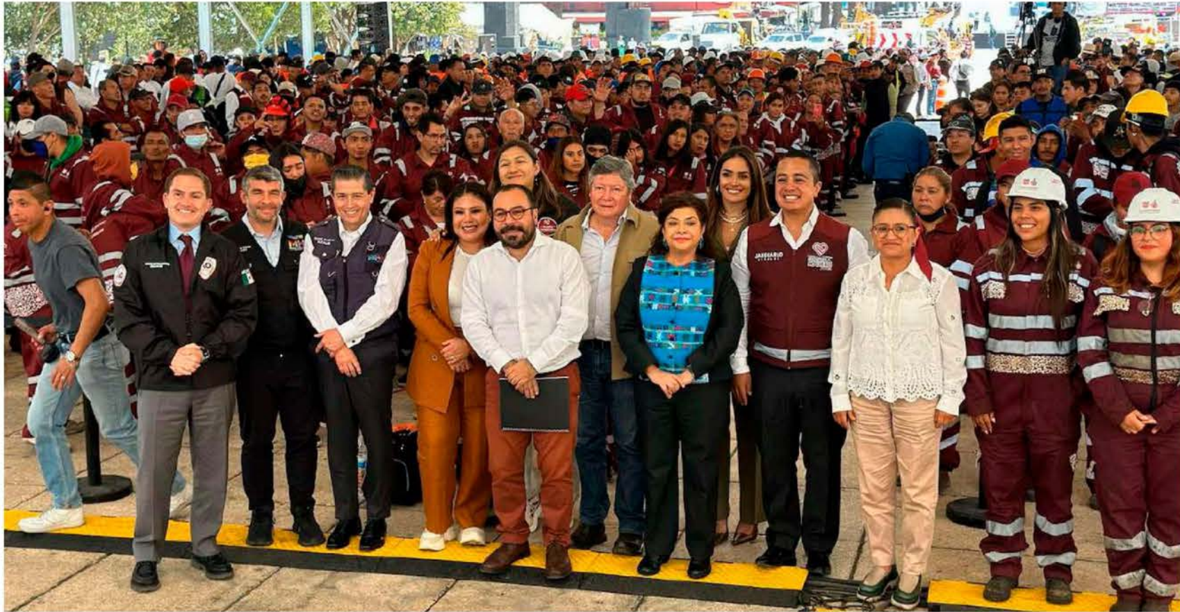
La jefa de Gobierno Clara Brugada inicia el Mega Bacheo para reparar baches en la capital.