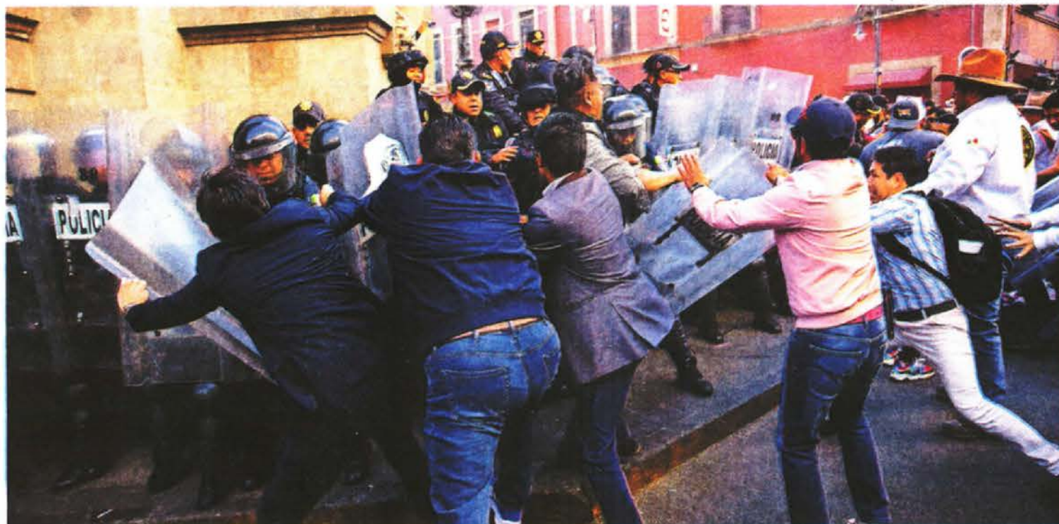
La tensión aumentó cuando varios jóvenes a favor y en contra de las corridas derribaron las vallas metálicas del Congreso.