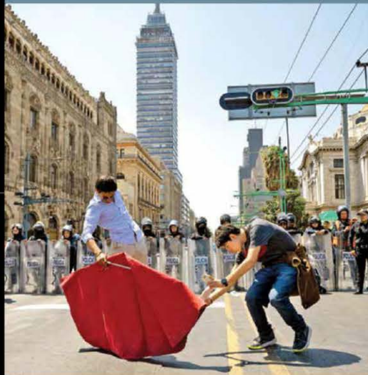
Defensores de las corridas de toros bloquearon Eje Central.