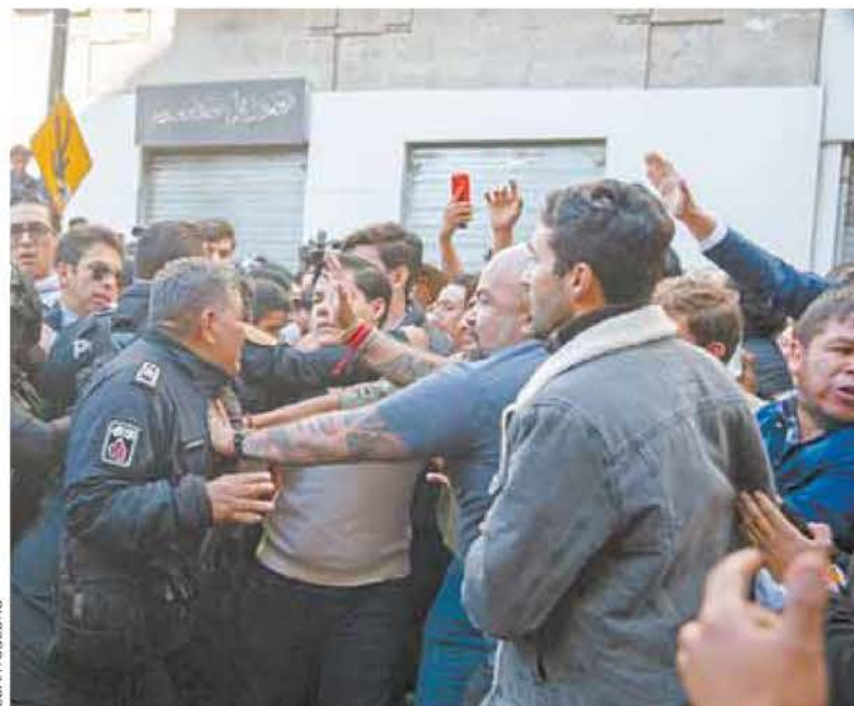
⊕ A las afueras del Congreso de la CDMX se dio una confrontación.

Desde ese sitio, los profesionales del arte de cucharas expresaron que la nueva ley acaba con su