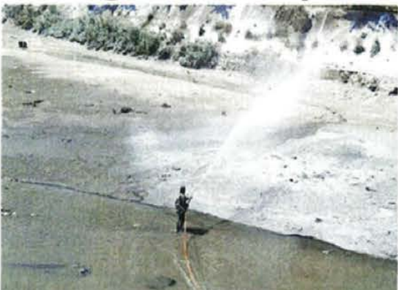
■ Esta semana, el Gobierno de Huixquilucan buscará aplicar 8 toneladas más de cal en la Presa El Capulín.

Durante este proceso, Aguas de Huixquilucan aplica la cal viva, lo que permite higienizar los lodos secos, y, al