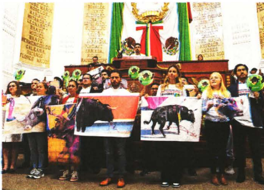
Al interior del Congreso se manifestaban en contra de las corridas.

La tensión aumentó cuando varios jóvenes derribaron las vallas metálicas y corrieron hacia las escalinatas del Congreso, pero fueron interceptados por la