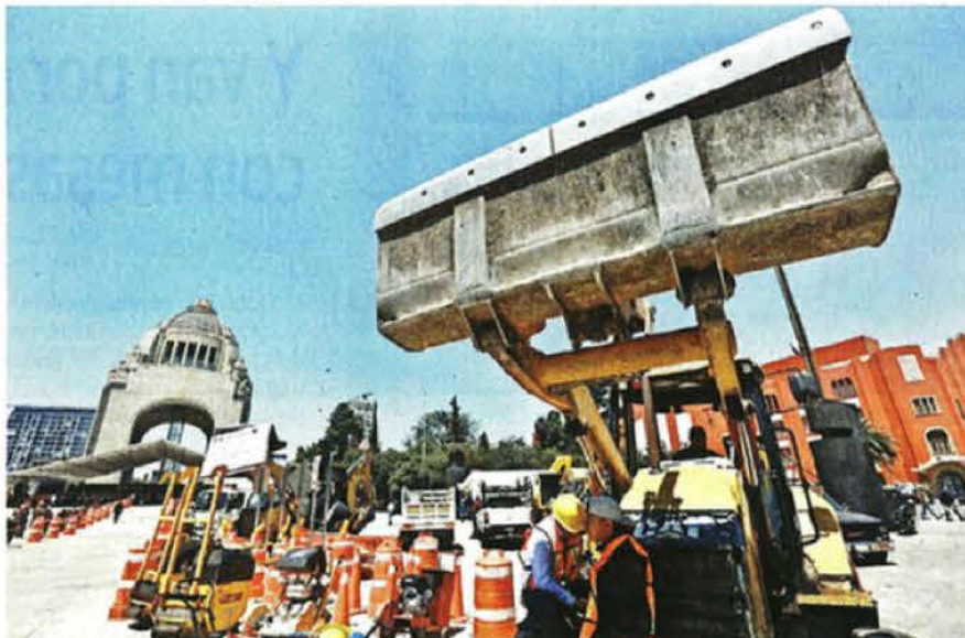
MAQUINARIA PESADA. La CDMX informó que se sumaron 5 mil trabajadores para realizar las labores de reparación del asfalto, con el objetivo de concluir las antes de las lluvias.

El funcionario detalló que en las últimas semanas se han atendido alrededor de 17 mil oquedades en vías primarias de las 200 mil que se habían identificado.