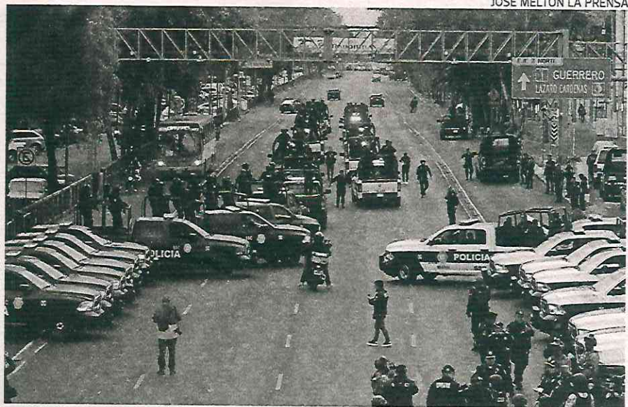
Ayer se desplegó este operativo desde la zona de La Ronda

El operativo será permanentemente por indicación del secretario de Seguri-