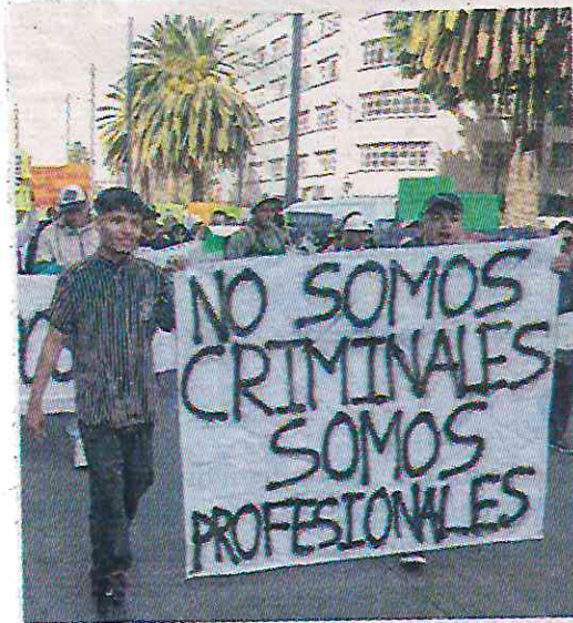
Piden que los dejen trabajar