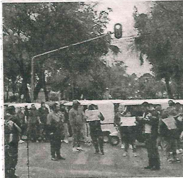
La protesta se extendió hasta Eje Central