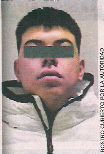
ROSTRO CUBIERTO POR LA AUTORIDAD