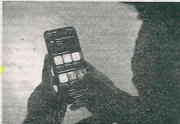
Es un tipo de fraude de préstamos con intereses excesivos

Los montadeudas consisten en un tipo de fraude que consiste en ofrecer préstamos con intereses excesivos y pos-