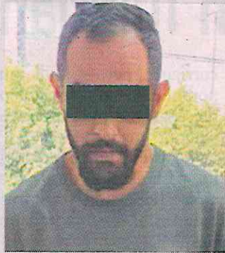
ROSTRO CUBIERTO POR LA AUTORIDAD

La pareja regresaba de celebrar el 14 de febrero al departamento del implicado, identificado como Ru-