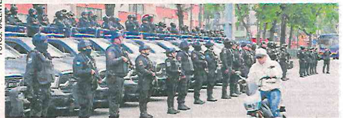
Tras los ataques armados en la alcaldía Cuauhtémoc, la Secretaría de Seguridad Ciudadana realizó un operativo.