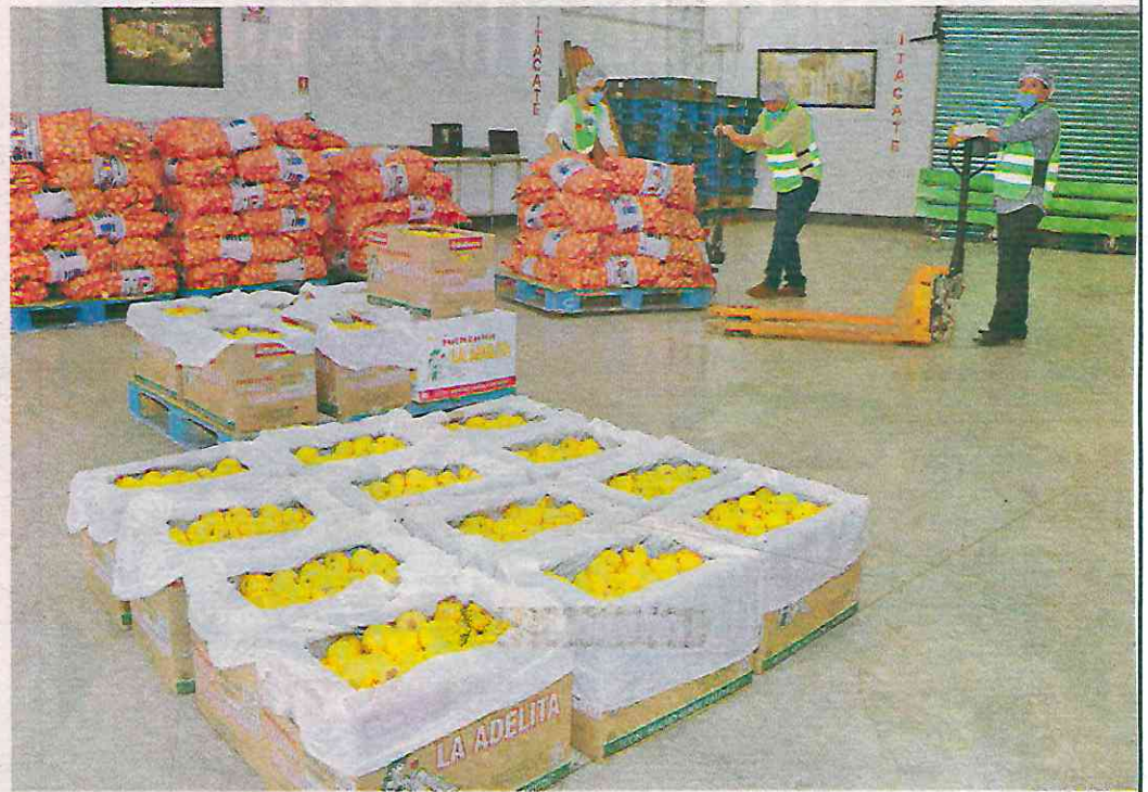
El 26 de febrero de 2020 inició la operación del Centro de Acopio y Recuperación de Alimentos denominado Itacate

“No solo se va a mantener, se va a fortalecer en coordinación con la Secretaría