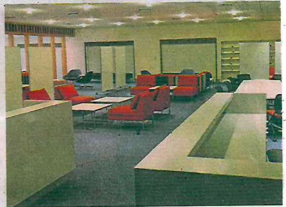
El edificio está diseñado para optimizar el flujo de visitantes en un espacio con 81 ventanillas consulares.

ridad para nosotros. Hemos hecho un gran esfuerzo, pero la realidad es que se necesita hasta muchísimo más trabajo, eso estoy seguro de que va a pasar.