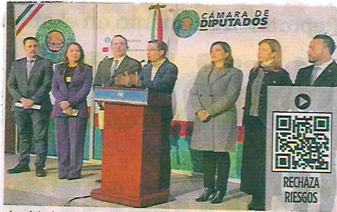
■ Legisladores del PAN promueven un parlamento abierto para analizar la reforma al Infonavit.