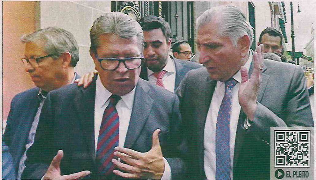
Los líderes parlamentarios morenistas Ricardo Monreal y Adán Augusto López (imagen de archivo) se reunieron el lunes pasado con la Presidenta Claudia Sheinbaum.

En dicha reunión, de acuerdo con fuentes parlamentarias, la Mandataria les hizo un llamado a la unidad y les advirtió que no estuvo bien ventilar públicamente