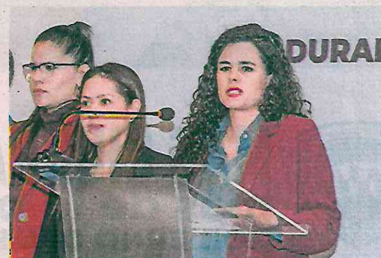
Luisa María Alcalde dijo que la división no puede venir de manera interna.

10 MILLONES DE AFILIADOS quiere lograr Morena el próximo año.