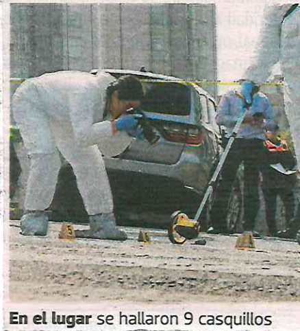
En el lugar se hallaron 9 casquillos