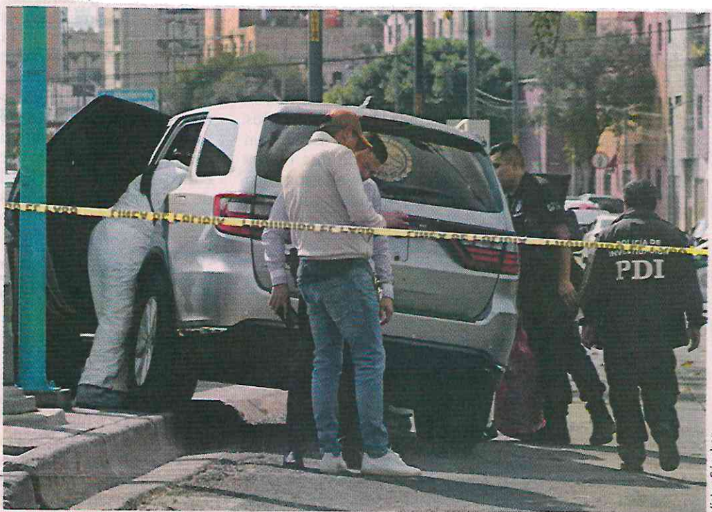
ROMA SUR. Tras el ataque a balazos, la camioneta que conducía la litigante chocó.