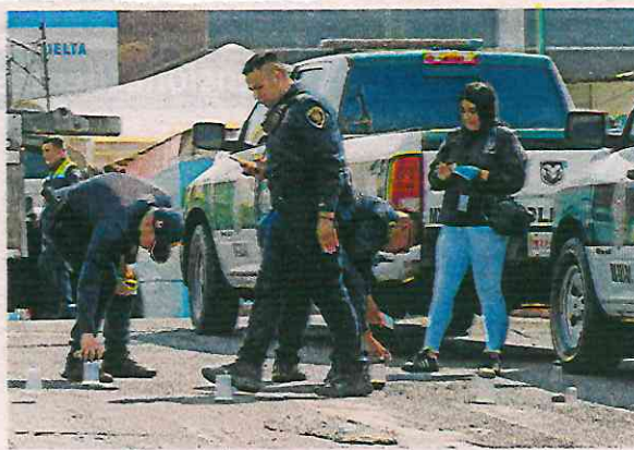
En el lugar hallaron nueve casquillos percutidos y dos de ellos le dieron directo a la cabeza, lo que provocó que perdiera la vida

Minutos más tarde llegaron servicios periciales quienes marcaron nueve indicios balísticos y comenzaron con las diligencias necesarias para retirar el cuerpo