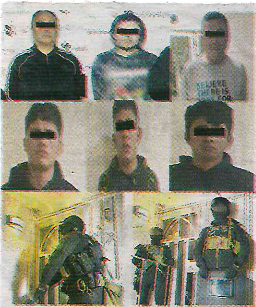
La policía los sorprendió en sus guaridas