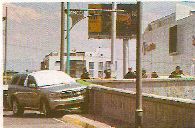
El feminicidio ocurrió en una de las avenidas más importantes de la CDMX

Aparentemente, la mujer salió de un banco, cuando los sicarios la siguieron y la mataron, presuntamente para robarle el dinero en efectivo que retiró. • (Jorge Aguilar)