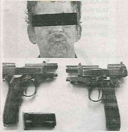
Quiso hacerse el chistoso

Otro oficial se percató de la situación y de inmediato lo neutralizó, minutos después se le trasladó al Ministerio Público, quien definirá su situación legal, mientras que el más joven fue llevado al Juez Cívico por Ingerir bebidas alcohólicas en la vía pública.