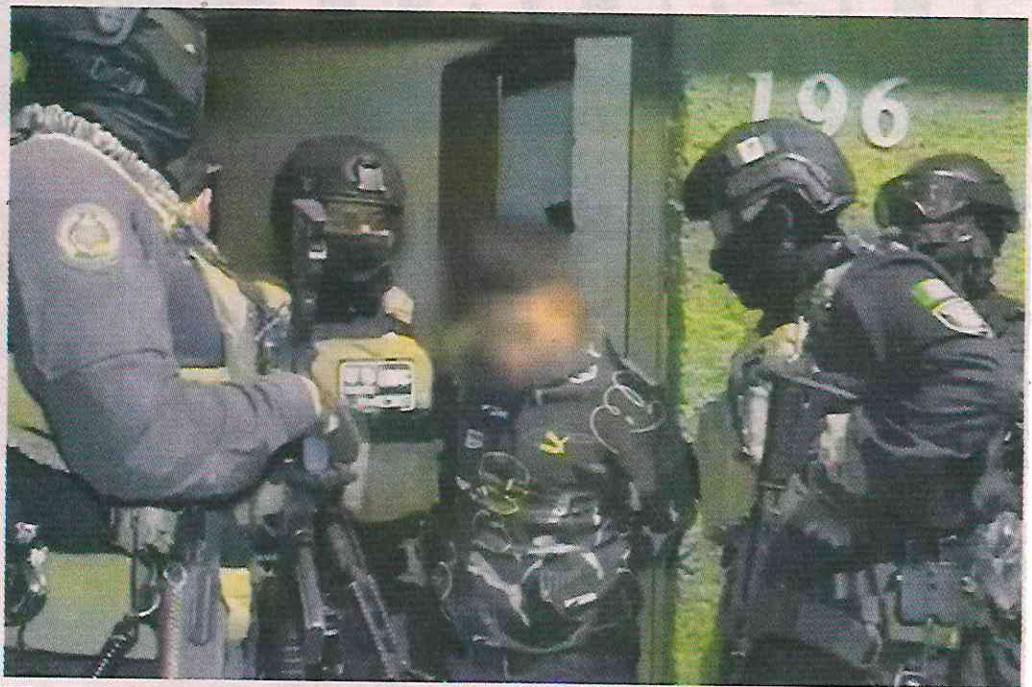
Fuerzas locales y federales realizaron de forma coordinada los operativos en las dos alcaldías.

prueba obtenidos, se consiguió un orden de cateo que fue efectuada por personal de la Fiscalía General de Justicia de la Ciudad de México, la Secretaría de la Defensa Nacional y Guardia Nacional, que acudió al domicilio ubicado en la Colonia Es cuadrón 201, donde fueron detenidos los cuatro sujetos.