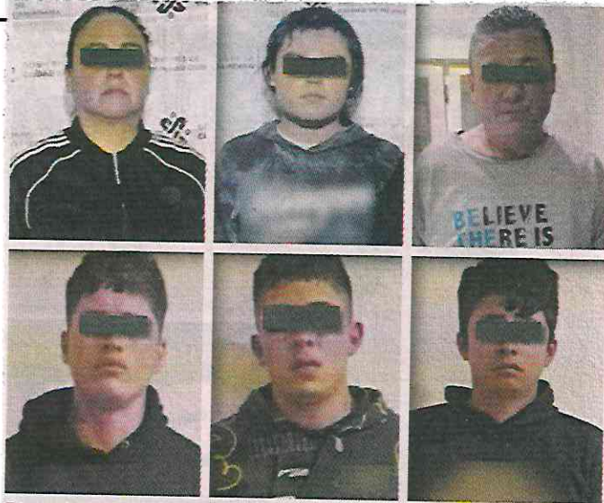
ROSTROS CUBIERTOS POR LA AUTORIDAD

Los detenidos fueron puestos a disposición del agente del Ministerio Público para determinar su situación jurídica.