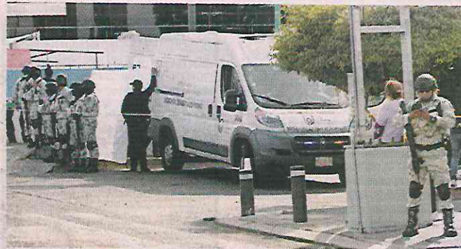
La zona del homicidio, donde hallaron nueve casquillos, fue acordonada y resguardada por fuerzas locales y federales.

Aunque desplegaron un dispositivo para perseguirlos, no pudieron detenerlos y les perdieron el rastro pues ingresaron a la estación.