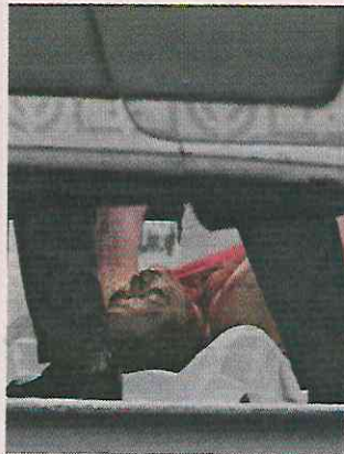
La abogada recibió tres tiros, que le perforaron la cabeza y el tórax.

“Me vine corriendo, pero me confundió un señor por-