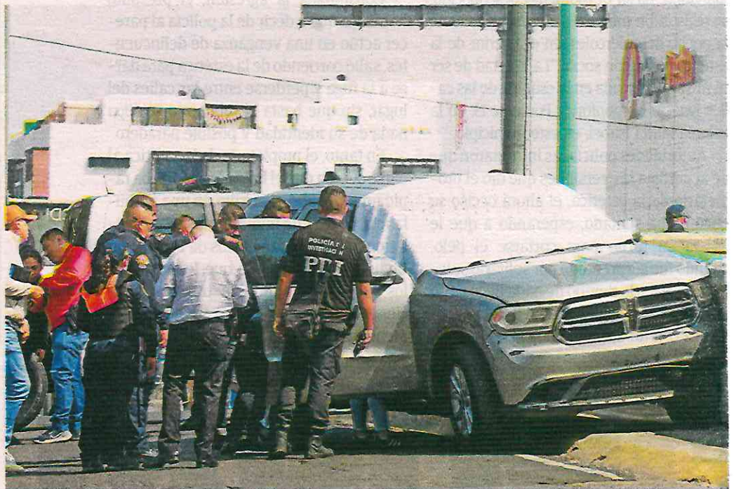
El cuerpo fue bajado por la parte trasera de la camioneta mientras que las autoridades continuaban haciendo su cerco

Hasta el lugar llegaron paramédicos del Escuadrón de Rescate y Urgencias Médicas ERUM quienes determinaron que la mujer de aproximadamente de 35 a 40 años de edad va no contaba con signos vi-