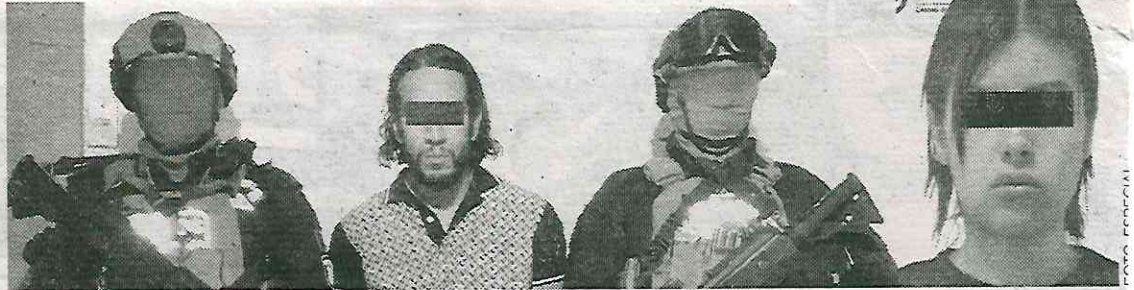
Les van a dar donde más les duele, en el dinero

Cabe mencionar que la Unidad de Inteligencia Financiera (UIF) congeló las cuentas del delincuente, al igual que las de otros cabecillas de La Unión Tepito