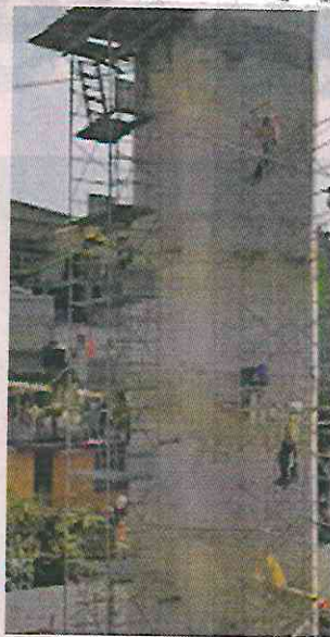
Las obras en columnas y dovelas se pueden apreciar en colonias como El Capulín.

A cambio, el Gobierno de la Ciudad y la constructora del tren efectúan obras