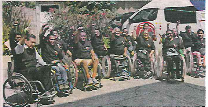
■ Un total de 18 sillas de ruedas fueron entregadas.

“Es difícil moverse por la Ciudad, pero casi no es im-