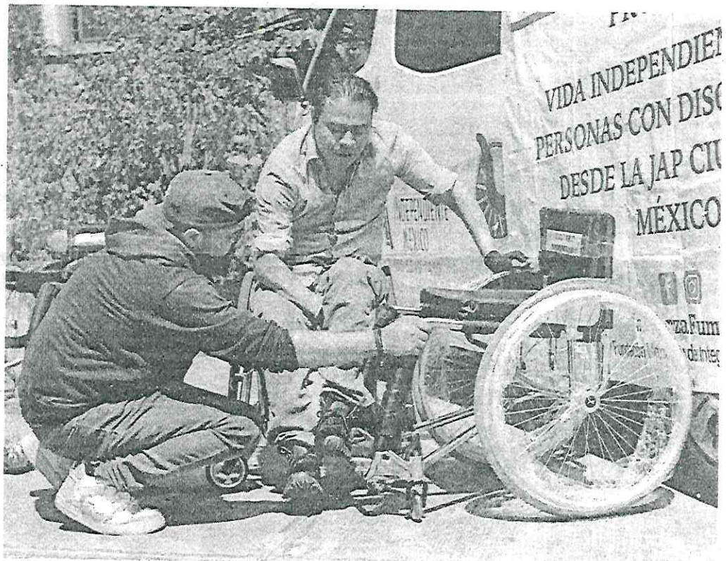
UN RETO. La asociación ofrece cursos en los que les enseña a moverse en su entorno.

“Si tengo que calificar a la Ciudad de México, como lo vemos nosotros, le pondremos un 6 o un 7. Hay que trabajar todos, en un compromiso y una responsabilidad de todos”, aseveró durante un evento en el que se entregaron 18 sillas de ruedas