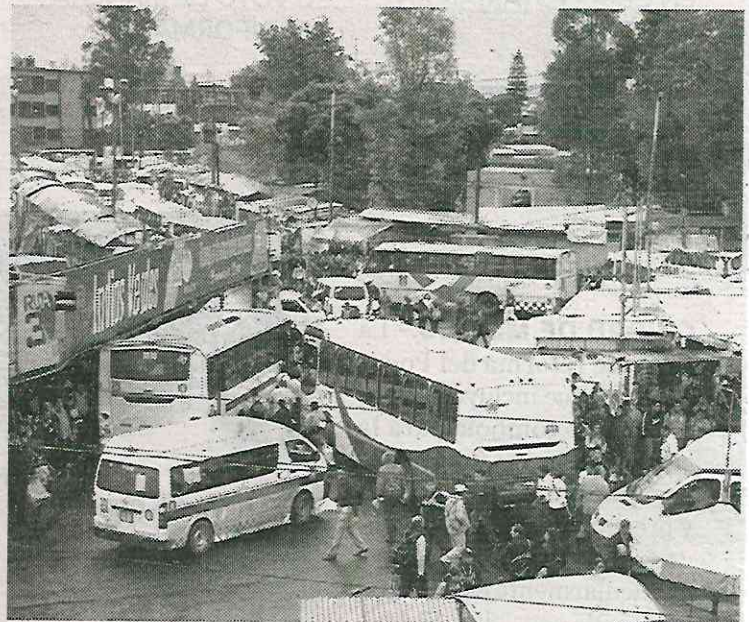
Hay 1.5 kilómetros de vías exclusivas, y el ideal es de 20

El estudio abarcó un primer grupo de lugares con menos de 900 mil habitantes, y uno segundo que rebazó dicha cantidad