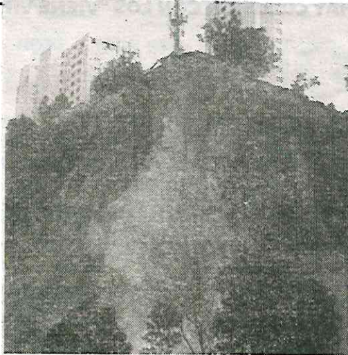
Alertan por más derrumbes