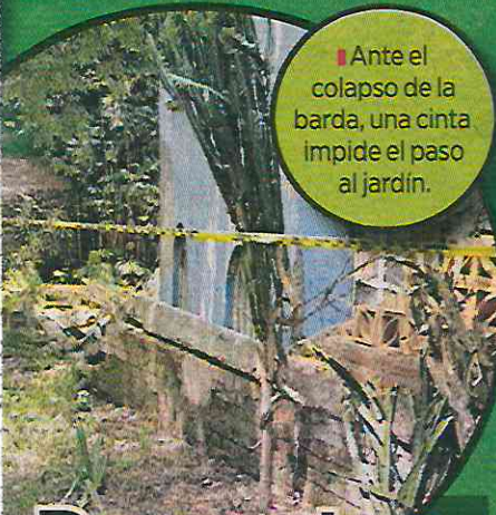
Ante el colapso de la barda, una cinta impide el paso al jardín.

Unos días después del desbordamiento del drenaje, personal de la ase-