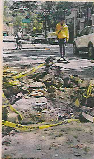
La oquedad fue olvidada por días tras haber sido abierta.

El agujero, que se ubica en Calle Querétaro, entre Mérida y Frontera, bloquea el paso de los vehículos de