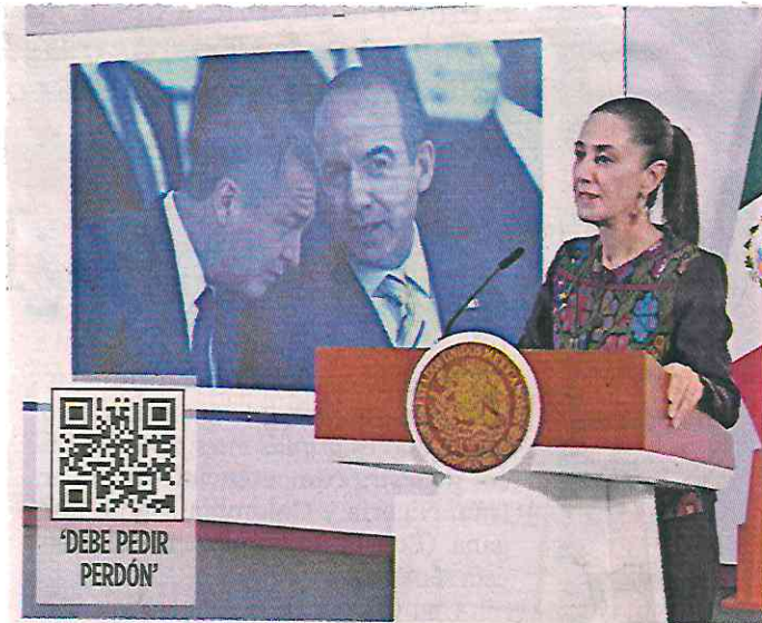
La Presidenta Sheinbaum dijo que Calderón debería pedir perdón por haber colocado a un narcotraficante en la SSP.