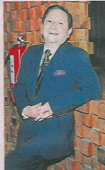
Ovalle estuvo al frente del Inafed tras salir de Segalmex.

El Mandatario federal ordenó que Ovalle Fernández saliera de Segalmex y se fuera al Instituto Nacional para el Federalismo y el Desarrollo Municipal (Inafed), en donde, ya bajo el gobierno de Claudia Sheinbaum y sin el respaldo de su amigo López Obrador, hace unos días tuvo que ceder su puesto a Armando Quintero, exalcalde de Iztacalco. ●