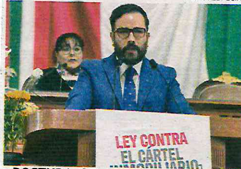
• POSTURA. Se busca desarrollo ordenado.