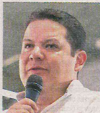
Exigen que de seguimiento

El Congreso de la CDMX pide continuar con acciones contra tala ilegal en la alcaldía Milpa Alta