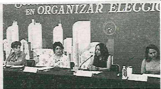
Reportaron 33 denuncias en periodo no electoral

Durante este tiempo, se dictaron 28 medidas de protección