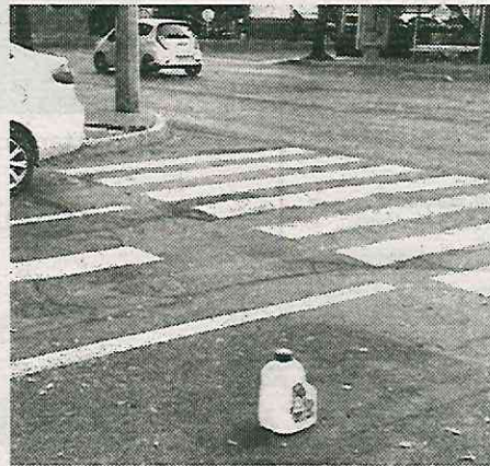
Sin freno, presencia de estas personas

Del mismo modo, los vecinos precisaron que estas personas están relacionadas con las autoridades, ya que los franeleros han sido normalizados por la ciudadanía, por lo que afirman, continuarán con el cobro de cuotas ante la falta de acción por parte de la autoridad local y del gobierno central.