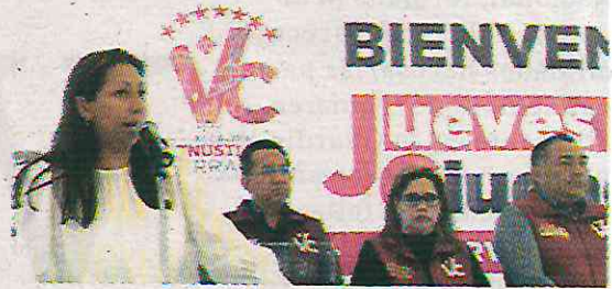
· Atenderá demandas ciudadanas