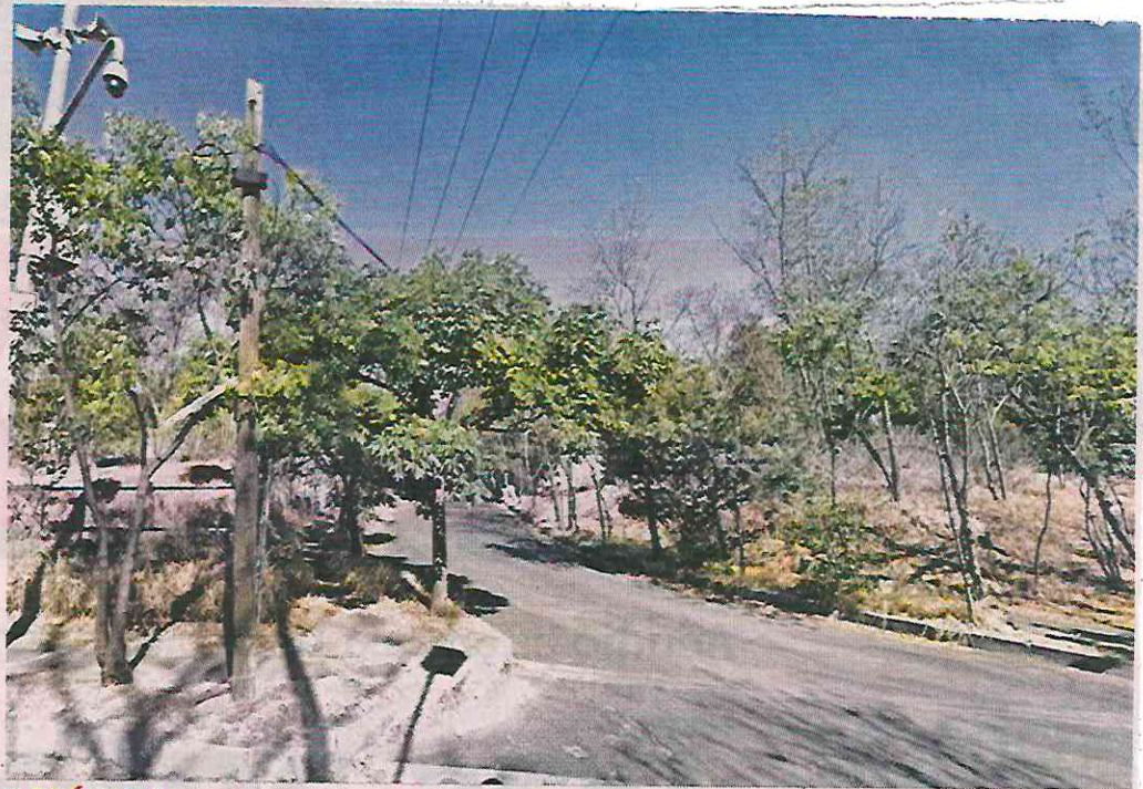
POLÉMICA. Desde hace 32 años, el predio de Montes Apalaches 525, en el Bosque de Chapultepec, está en disputa.