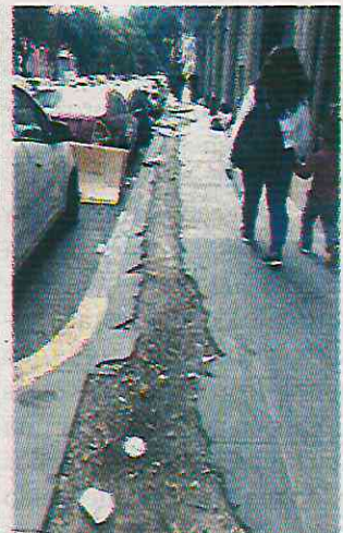
Las calles presentan socavones y las banquetas están en malas condiciones