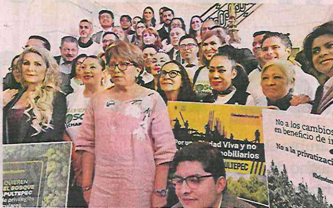
■ Diputados de ocho bancadas se pronunciaron en contra de la resolución con letreros y playeras.