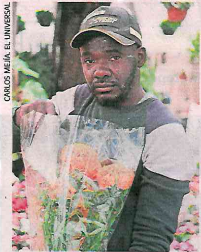
CARLOS MEJIA, EL UNIVERSAL