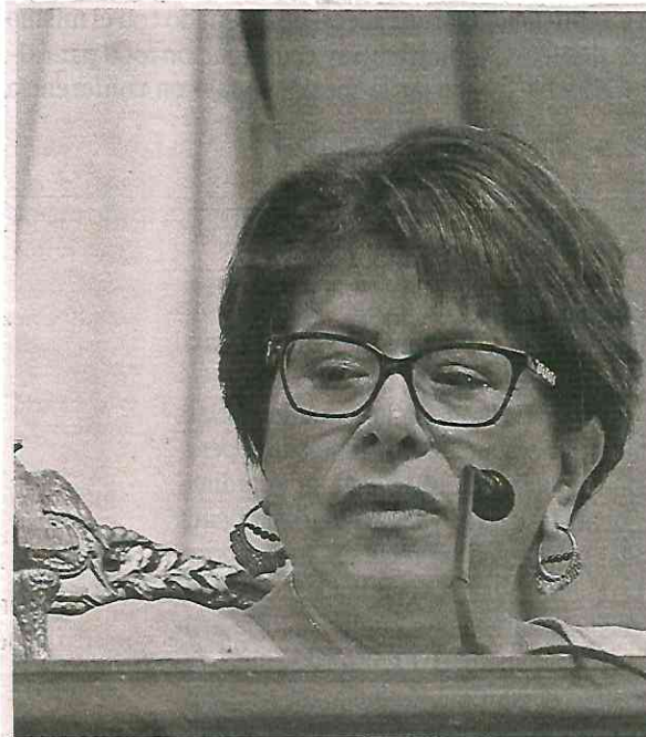
Martha Ávila Ventura, presidenta de la Mesa Directiva del Congreso de la CdMX

Resulta que, en votación nominal, las diputadas y diputados de la capital del país, aprobaron la minuta con 51 votos a favor, cero en contra y cero abstenciones.