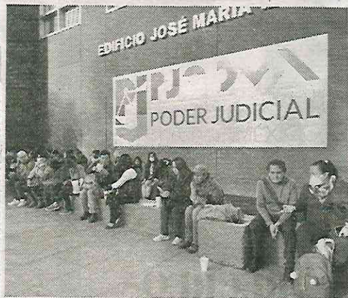
De enero a julio, 280 carpetas abiertas