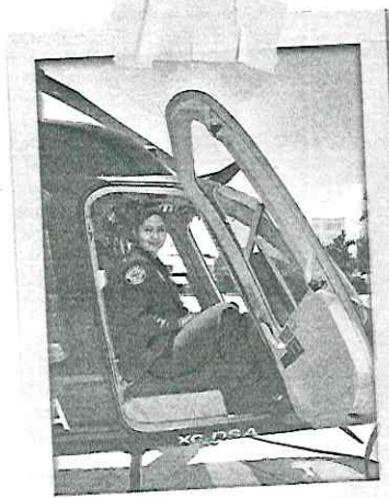
● Al llegar al hangar, la capitana siempre tiene que estar lista ante cualquier emergencia.

"El viaje hacia el enamoramiento que tuve con los helicópteros fue cuando tenía diecinueve o veinte años. Me tocó ver un helicóptero precisamente de un agrupamiento policiaco que pasaba encima de mi departamento de ese entonces", recordó la joven originaria de Acapulco, Guerrero.