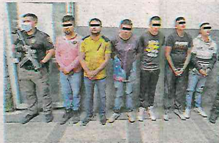
Pretendían realizar un "cobro de piso" a una empresa constructora

Los presuntos delincuentes se encontraban a bordo de una camioneta estacionada en el cruce entre Camino a Santa Fe y calle Tapatíos. Tras una inspección física apegada al protocolo de actuación policial, se les encontró en posesión de dos armas fuego, cartuchos útiles y varias