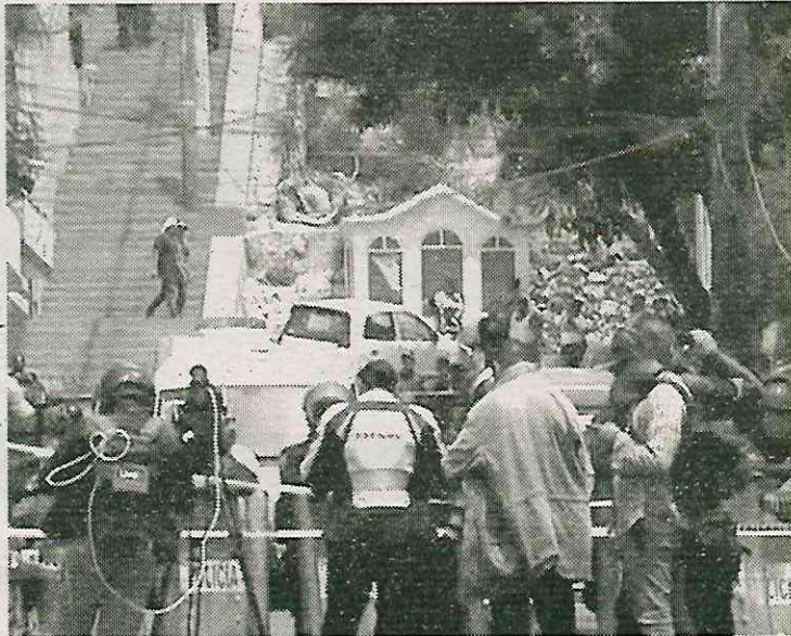
Más de 90 mil delitos no inhibidos

mil delitos desde el primer año de Gobierno con Morena y hasta diciembre de 2022