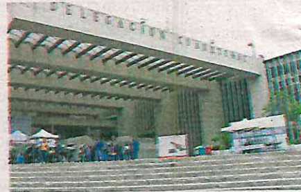
Explanada de la alcaldía Cuauhtémoc

Aníbal Cañez expresó que es necesario que exista la unión vecinal para cuidar los