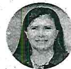
Manuela Obrador Diputada federal de Morena De las favoritas en Chiapas