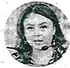
Sasil de León Villard Senadora de Encuentro Social Busca candidatura en Chiapas