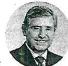
Luis Urióstegui Alcalde de Cuernavaca La carta fuerte del PAN