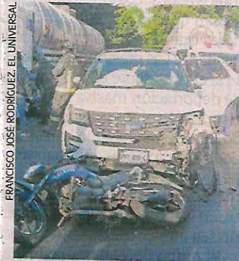
FRANCISCO JOSÉ RODRÍGUEZ, EL UNIVERSAL

resultaron heridos, luego de ser atropellados por una camioneta.