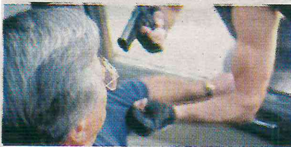
Van hasta 4 atracos en este peligroso diciembre

El caso más reciente que salió a la luz pública, habría ocurrido el 11 de diciembre en la alcaldía Benito Juárez.