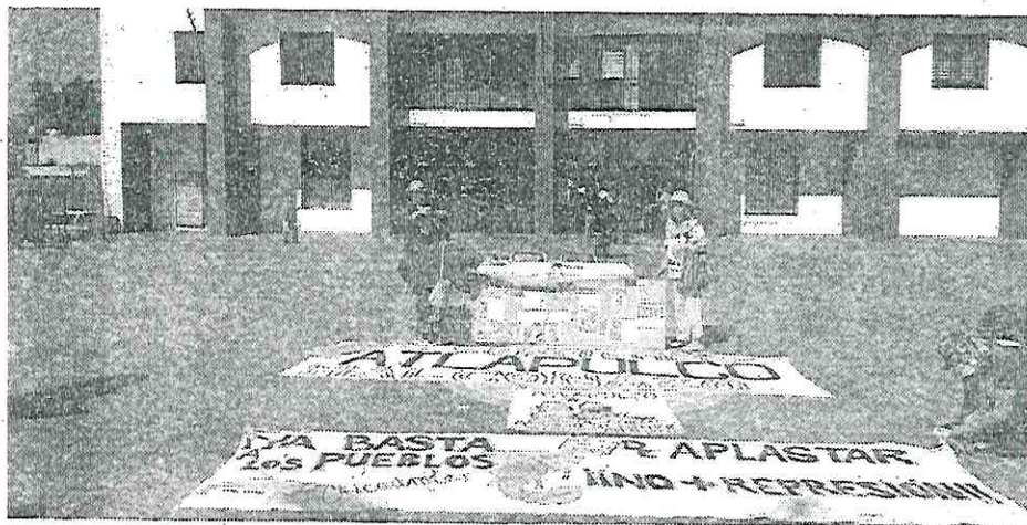
Estuvieron en la sede de la alcaldía