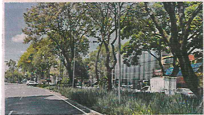
■ Al rehabilitar el Sendero Seguro, el año pasado se remozaron camellones y áreas verdes de la avenida.