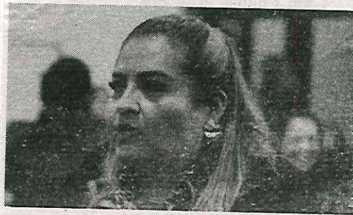
Subrayó la importancia de obra pública