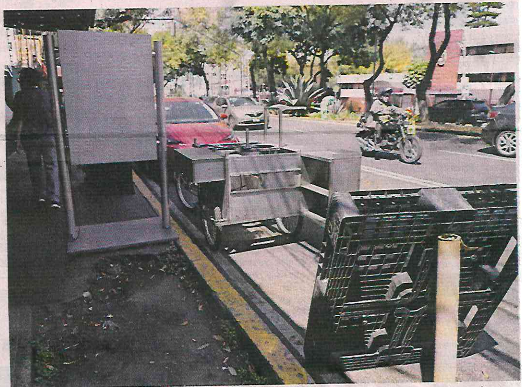
La Calzada Taxqueña tiene cuatro carriles, pero uno de ellos es usado como estacionamiento, tanto de vehículos como de puestos semifijos que pertenecen al comercio informal de la zona.

“El operativo fue desde ayer (el martes) a las 14:00 horas. Precisamente cuando nosotros íbamos regresando del Congreso nos percatamos que estaba la Alcaldía haciendo un operativo, pero sola-