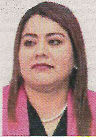
No hay registro de destino

La morenista erogó 4.8 mdp en la compra de productos alimenticios y bebidas para personas, además de 7 mdp gastados en la adquisición de alimentos para los Centros de Desarrollo Infantil (CENDI) e inclusive, la administración destinó cerca de 4 mdp en juguetes y 499 mil pesos más en sillas de ruedas y andaderas ortopédicas