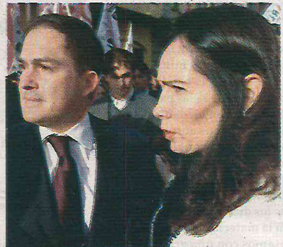
· Su cónyuge lo posiciona con publicaciones

Casarín se posicionara como el favorito de PVEM, Morena y PT para gobernar la alcaldía Álvaro Obregón, fue un diputado de la fuerza política verde con escasos resultados legislativos.