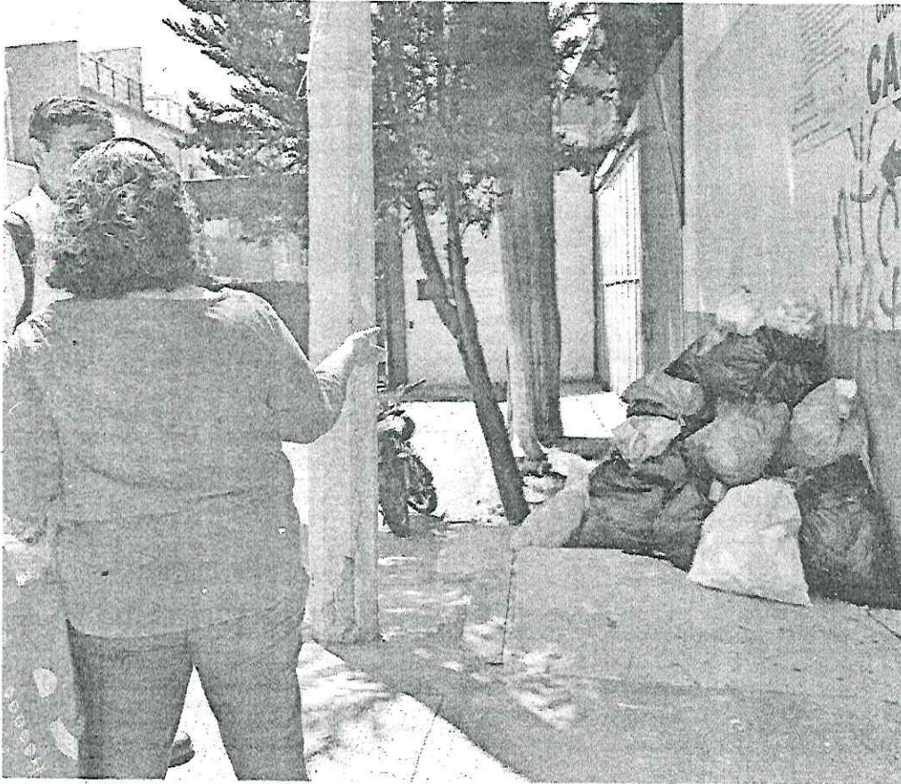
Algunos espacios de la Colonia Educación lucen en el olvido, pues, incluso, algunas banquetas se han convertido en tiraderos de basura al aire libre.

res son estudiantes del CE-CyT y, en algunos casos, los alumnos piden las bebidas para llevar y así consumirlas en parques de la zona, explicó la residente.