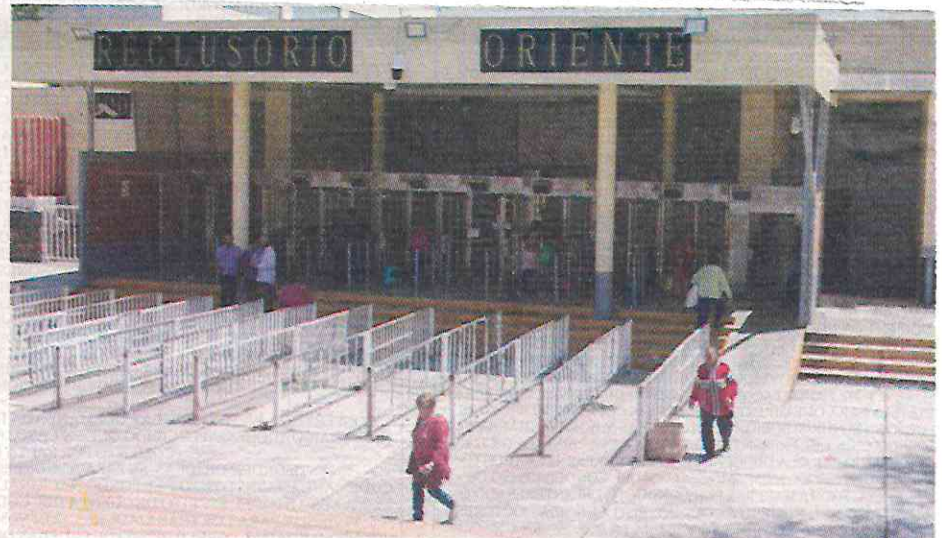
Comentaron que es necesario retomar los trabajos para una buena reinserción social.