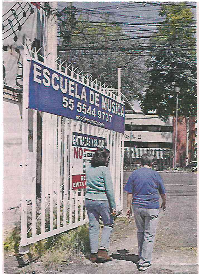
■ Frente al CECyT 13 se ubica una escuela de música y a unos metros un establecimiento que vende bebidas alcohólicas.