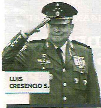
LUIS CRESCENCIO S.

El presidente López Obrador y la presidenta electa, Claudia Sheinbaum , encabezaron el último Desfile Cívico Militar de esta administración. En esta ocasión el mandatario no tomó la palabra, sin embargo, los secretarios de la Defensa Nacional, Luis Crescencio Sandoval , y de Marina, José Rafael Ojeda , aseguraron que las Fuerzas Armadas están listos para servir al pueblo mexicano en la próxima administración y a la comandanta suprema.