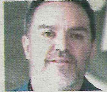
Diputado federal panista

Tras la firma del decreto de la Reforma al Poder Judicial, con Sheinbaum como testigo, Döring acusó al presidente de México de ser un “violador se-