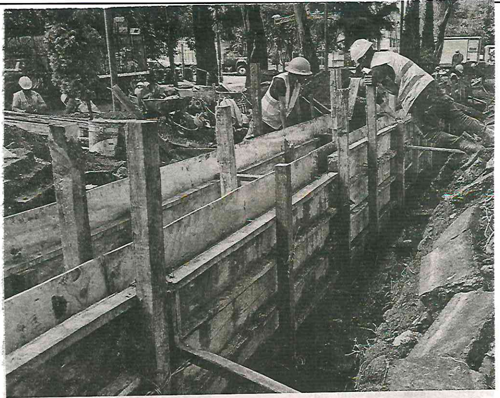
Una de las obras recientes es la renovación del camellón en Campamento 2 de Octubre

proyectos, sin que la inversión se viera reflejada en las obras esperadas. A esto se le añaden actitudes amenazantes o prepotentes que pueden estar reteniendo a los vecinos de tomar acción contra estas prácticas”, indica el informe.