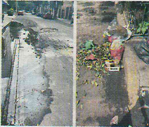
Vecinos dicen que el problema lleva dos meses