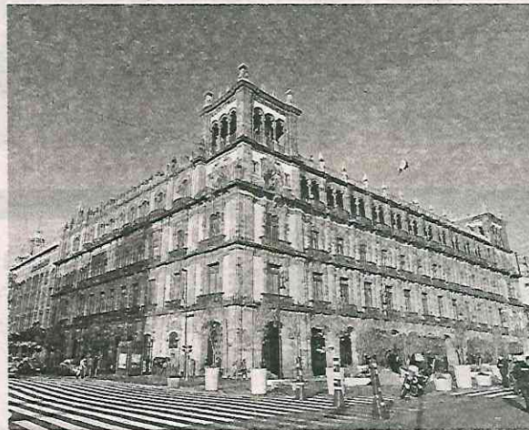
La administración afirmó que es importante determinar la viabilidad financiera de los proyectos de inversión costeados con deuda pública

Al cierre de 2023 el desendeudamiento registrado respecto de 2022 fue de 1.9% real y de 6.3% respecto del nivel de di-