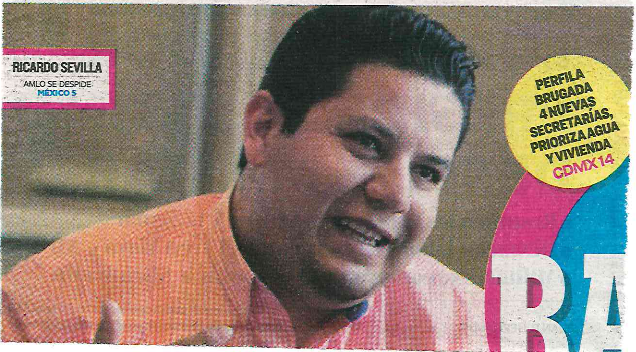
RICARDO SEVILLA AMLO SE DESPIDE MÉXICO 5

● En su anterior mandato benefició a cientos de funcionarios públicos y no explicó cómo se entregaron 63.9 mdp de programa social a productores locales 8