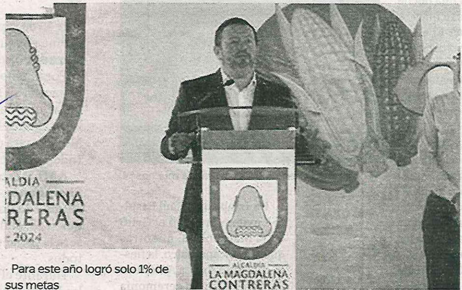
Para este año logró solo 1% de sus metas

Para este año trató de revertir el fracaso en el anterior, sin embargo, según los números reportados por La Magdalena Contreras, únicamente de enero a marzo llegaron a un beneficiario de 109 programados.