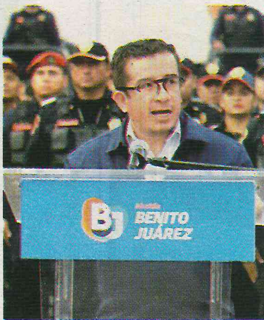
1 de cada 5 vecinos han sido víctimas de robos

Seguridad Pública informó que solo en julio se registraron más de mil 500 delitos, de los cuales, el 22% se trató de robos, siendo los negocios los más afectados, con 100 carpetas de investigación iniciadas por este ilícito, es decir, una tercera parte del total de asaltos.