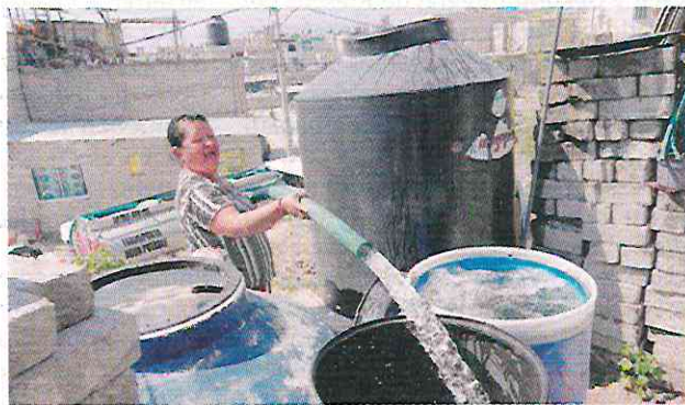
UNA mujer llena tinacos con la manguera de una pipa.

10 Mil 163 sistemas de cosecha de agua de lluvia se han instalado este año