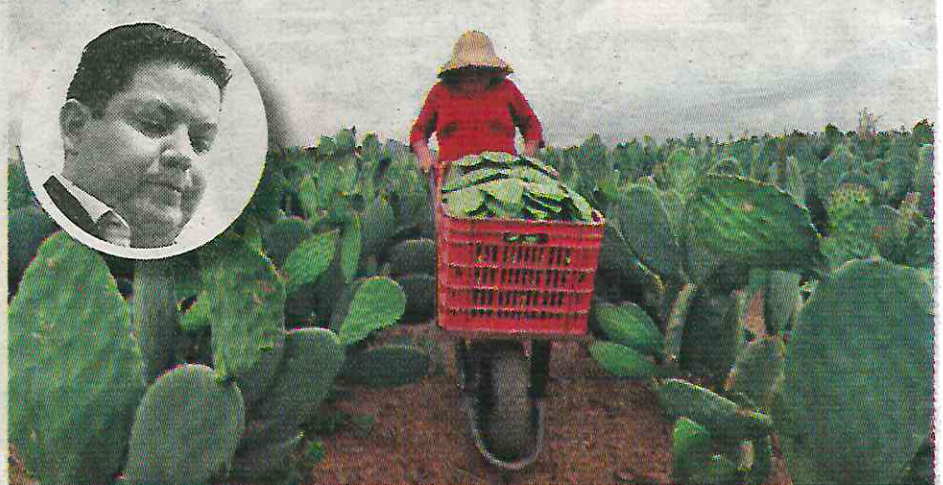
· Vuelve otra vez con un discurso a favor de quienes se sostienen de esta actividad

Una de las principales observaciones en la revisión ASCM/86/21 fue que la poca planeación y control del programa benefició a cientos de funcio-