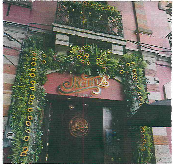
■ Girasoles también son usados para adornar los marcos de las puertas.

“Aunque es un mismo tema, todos los balcones son únicos, entonces represen-