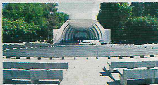
Este espacio fue reabierto en 2019