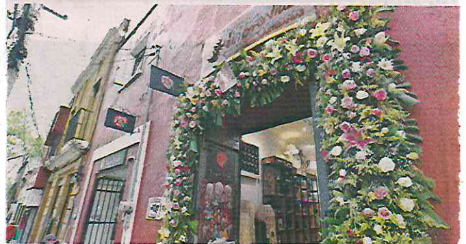
■ Concursan por igual negocios y casas durante la Feria de las Flores.