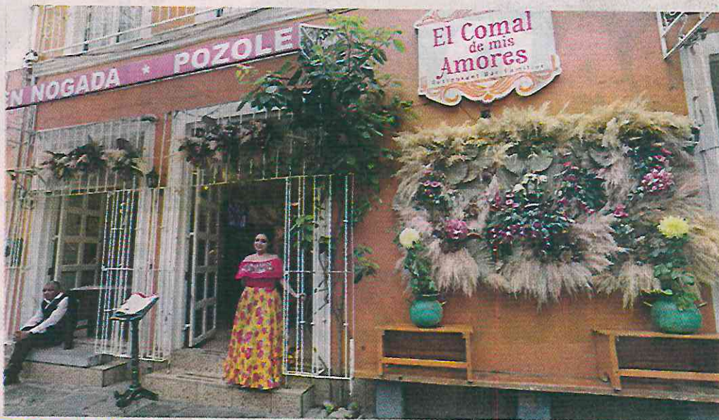
DECORADOS. No importa si son flores naturales o artificiales, concursan en Balcón Florido.