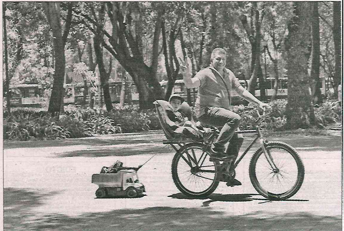
▲ Como parte de la celebración por el Día del Padre, algunos festejados aprovecharon para pasear con sus hijos en el Centro Histórico, la

Cadenas de cines ofrecieron diversos combos para festejar a los papás, que incluyeron dos boletos, unas palomitas, uno o dos refrescos grandes, con precios que iban