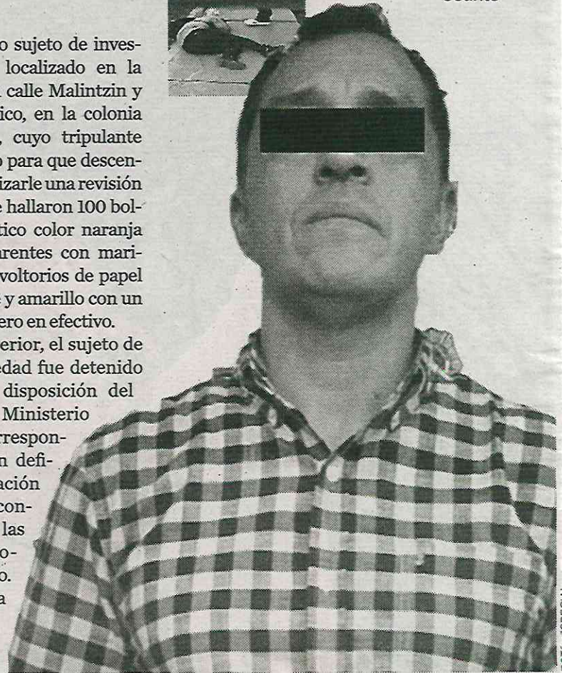
Haber si en la cárcel es muy machito