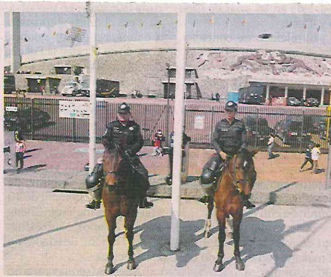
Este grupo policial está conformado por 150 policías operativos y más de 400 caballos.

La nobleza y características de los caballos de la Policía Montada no sólo se remite a las labores de seguridad, 80 de ellos