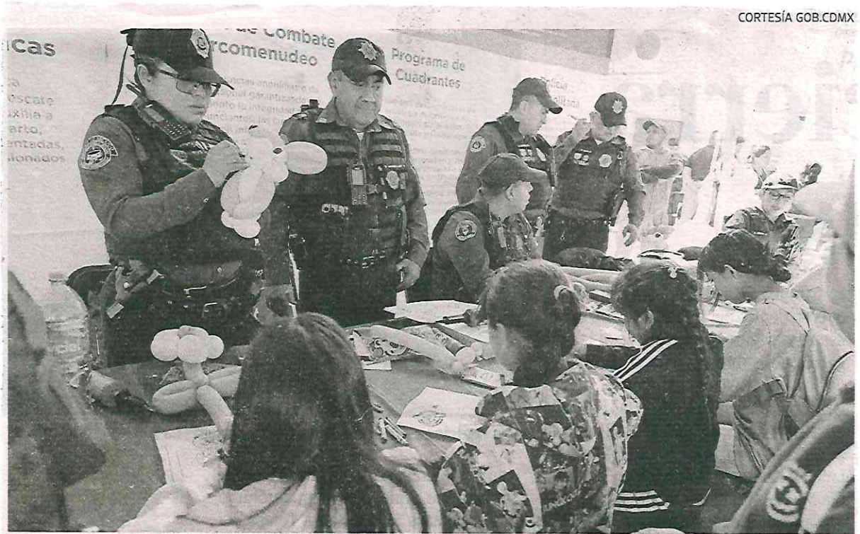
Este programa se mantendrá todo el mes, junto con la vigilancia local y federal