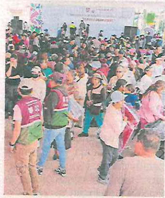
En la jornada se ofrecieron servicios de salud y becas.

Hace una semana, un grupo de sujetos disparó contra siete personas que estaba reunidas en Mixquic, de las cuales cinco murieron en el lugar. ●