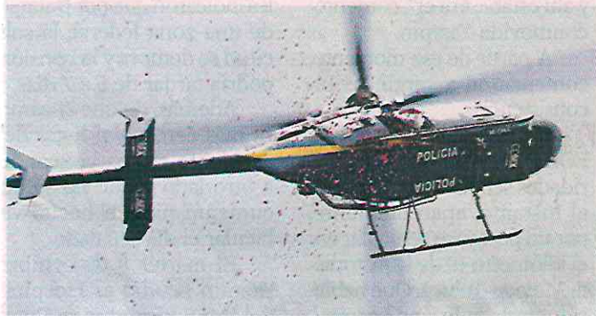
Desde un helicóptero de Cóndores llovieron pétalos.