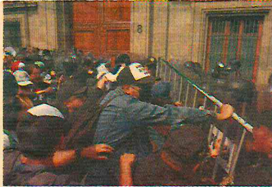
Los trabajadores judiciales se manifestaron a las afueras de Palacio Nacional donde se celebró el "US-Mexico CEO Dialogue".