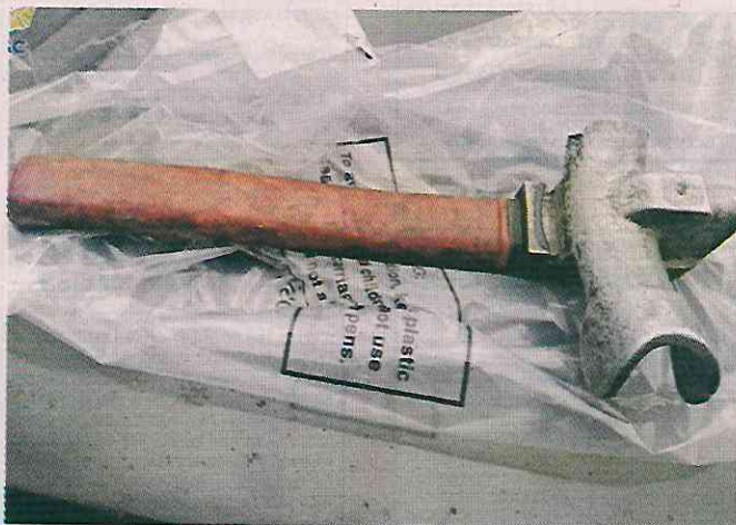
El bastón con el que rompieron los cristales y la camioneta que conducía los detenidos fueron asegurados.