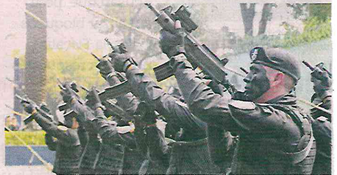
Compañeros del agente caído ofrecieron salvas en su honor.