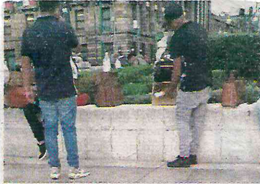
Alertan por estafadores