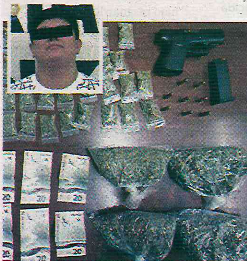
-Llevaba mota y una pistola

Finalmente, la chica, de 28 años, fue detenida y junto con lo asegurado se le presentó ante el agente del Ministerio Público, quien se encargará de definir su situación jurídica por los delitos de narcomenudeo, portación de armas sin permiso y delitos contra la salud.