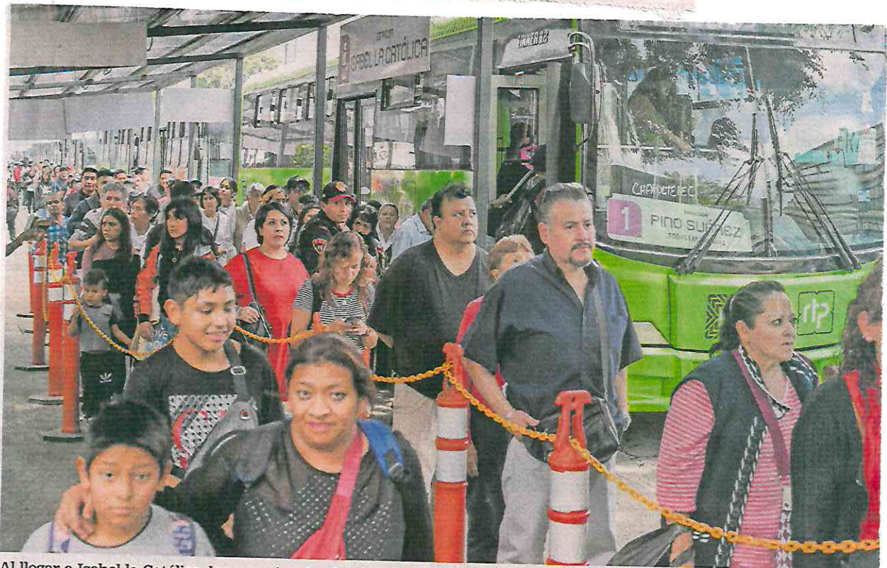
Al llegar a Isabel la Católica, los usuarios descienden del Metro para tomar un camión de la RTP y continuar su traslado.

Por dos años usuarios han padecido las obras de modernización en esta ruta del Metro