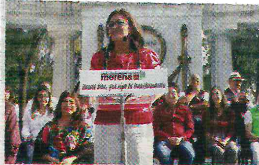
Pronto será la alcaldesa de Iztapalapa