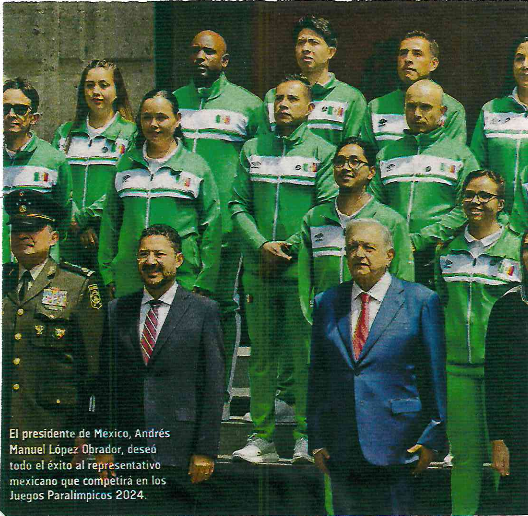
El presidente de México, Andrés Manuel López Obrador, deseó todo el éxito al representante mexicano que competirá en los Juegos Paralímpicos 2024.