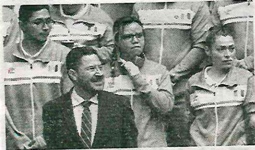
Símbolo de la igualdad social