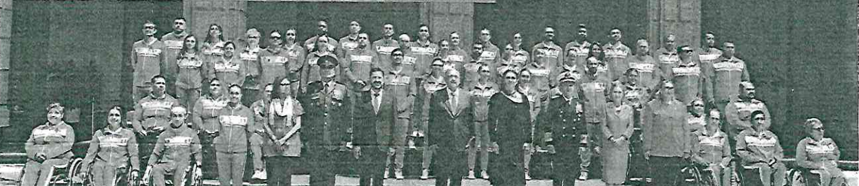
GOBIERNO DE MÉXICO Abanderamiento de la Delegación Mexicana JUEGOS PARALÍMPICOS PARÍS 2024 Ciudad de México, 15 de agosto de 2024

EL PRESIDENTE LÓPEZ OBRADOR ENTREGÓ EL LÁBARO PATRIO