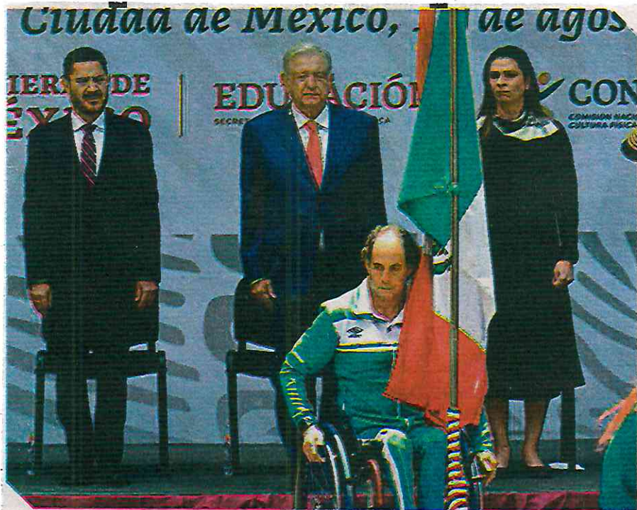
El Presidente Andrés Manuel López Obrador abanderó a la delegación mexicana que participarán en Parálmpicos de París 2024.