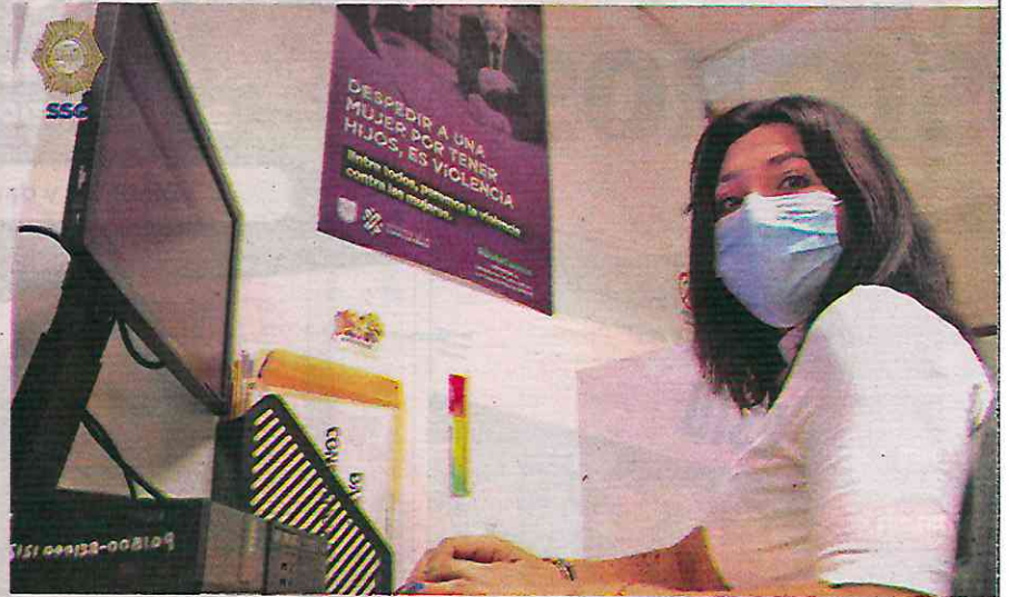
Por la seguridad de niñas y mujeres, y eliminar la violencia estructural

Y es que en el marco del Parlamento de Mujeres 2024 del Congreso de la Ciudad de México, la coincidencia entre las parti-