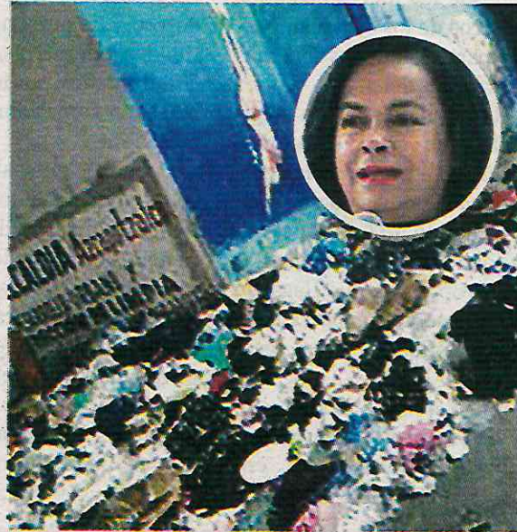
Así lucen las vialidades de la demarcación

De acuerdo con datos del Gobierno de la Ciudad de México, en Azcapotzalco se han levantado más de 200 denuncias vecinales en lo que va de 2024, debido a que no se lleva a cabo el retiro de la basura acumulada en las vialidades y parques. De dicha cifra, hasta el 9 de julio, el 16.7% de las quejas seguían sin resolverse. De permanecer esta problemática, podría provocar un incremento en la proliferación de fauna nociva y, por lo tanto, daños