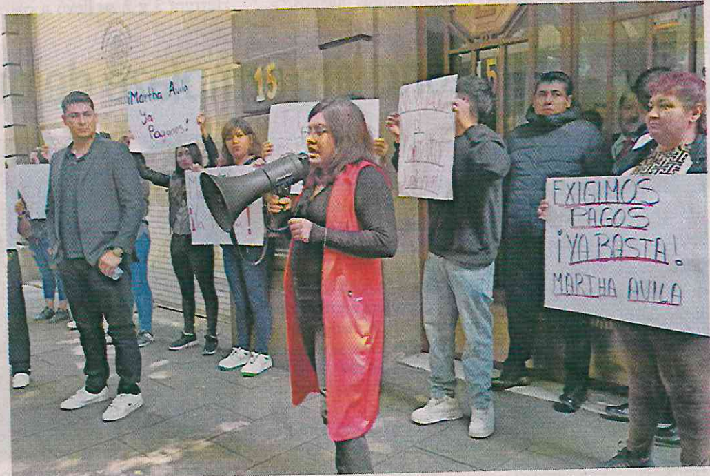
La legisladora Vicenteño aseguró frente a oficinas del Congreso local que ella fue independiente durante toda la Legislatura.

El diputado afirmó que esta falta de pagos no es más que una revancha política por haberse sumado semanas atrás a la campaña del entonces