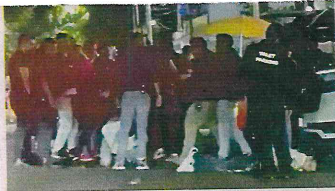
6 DE JULIO. Dos jóvenes fueron golpeados por una decena de trabajadores del bar Match.