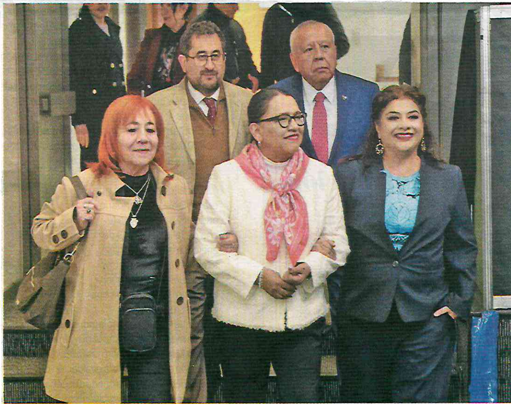
● ENCUENTRO. Rosa Icela Rodríguez, titular de la Segob, encabezó el foro migratorio.