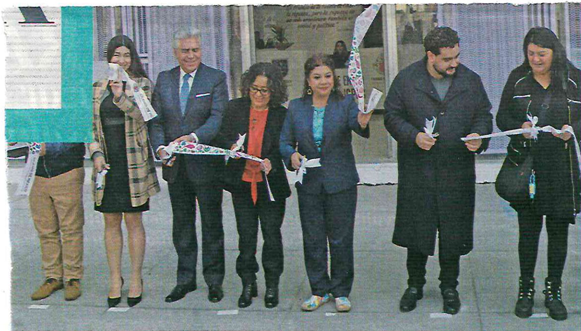
► OPCIÓN. La sede central está en las instalaciones de la Secretaría del Trabajo y habrá una en cada alcaldía.