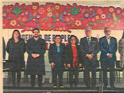
El Gobierno de la Ciudad de México ubicará oficina de empleo en las llamadas Casas de Gobierno, que estarán ubicadas en las alcaldías.

Brugada Molina se refirió a este nuevo espacio como un servicio que ofrece