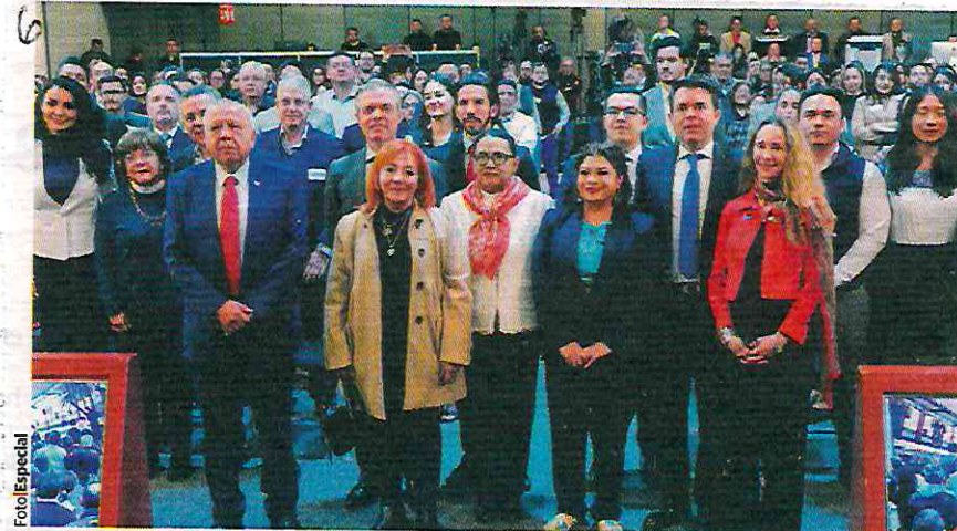
DE IZQ A DER.: Francisco Garduño, Rosario Piedra Ibarra, Rosa Icela Rodríguez, Clara Brugada y César Cravioto, ayer, en el Foro Migración Ordenada, Segura y Regular.