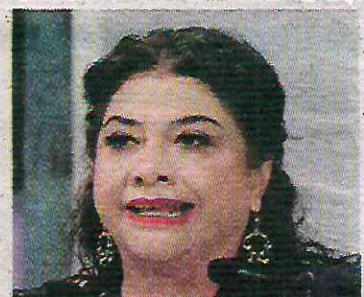
Uno de sus objetivos

La jefa de Gobierno expresó su apoyo a la presidenta Claudia Sheinbaum, y resaltó la importancia de sumar esfuerzos para proteger a los migrantes