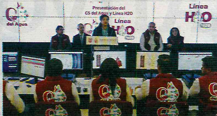
El pasado 12 de diciembre, Clara Brugada lanzó el "C5 del Agua", creado para monitorear las fugas en la red de suministro de la CDMX.

De acuerdo con la casa de encuestas de opinión y análisis, Factométrica, que realizó 16 mil estudios de opinión entre el 5 y el 11 de enero a personas mayores de edad en las 16 alcaldías,