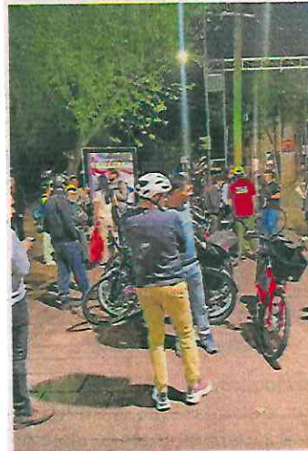
Ciclistas dicen que la licencia vulnera los derechos a la seguridad y la movilidad.

"Podemos demostrar que lo que estamos haciendo mejora la situación de prevención de la conducta de los que manejan, ayuda a que tengamos un examen previo y mejora la situación de como está". ●