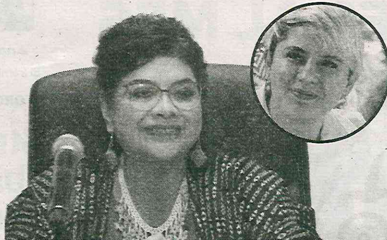
La Jefa de Gobierno señaló que todos están sujetos a la ley