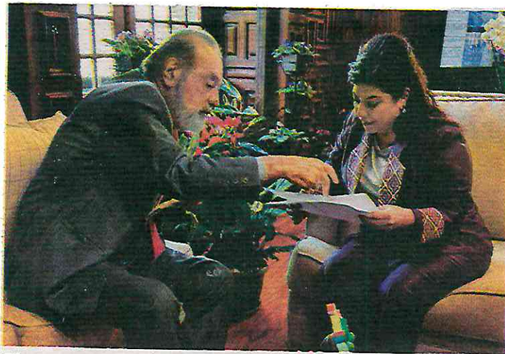
El empresario y la jefa de Gobierno.