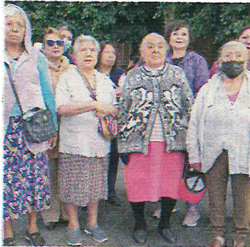
El monto es de 24 mil 965 pesos