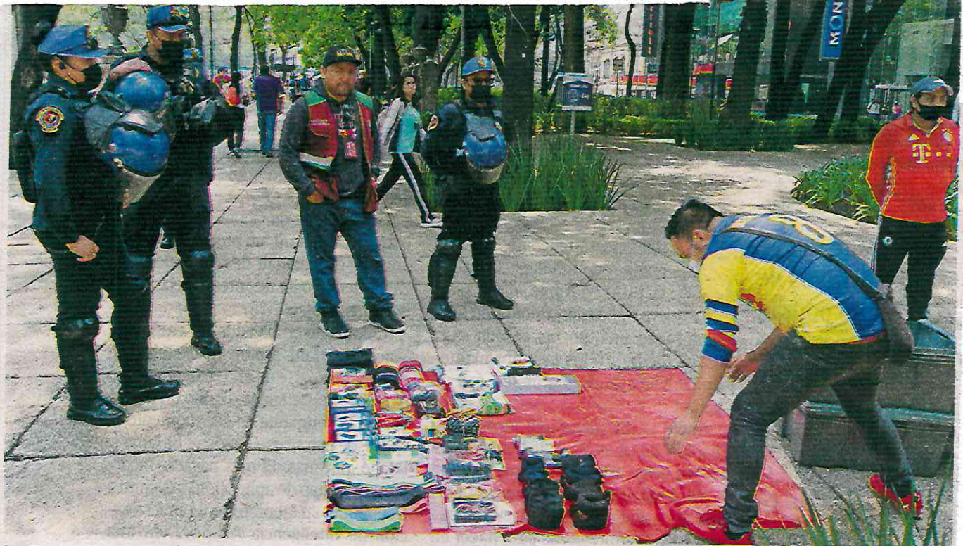
La Canaco pretende que la Cdmx sea la primera entidad donde se bancarice a los comerciantes informales