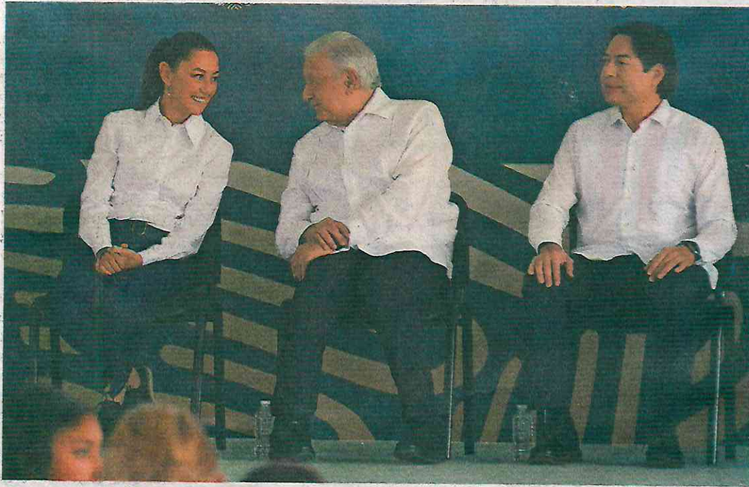
FERNANDA ROJAS. EL UNIVERSAL

El Presidente y la futura mandataria presentaron la evaluación de programas y proyectos de educación.