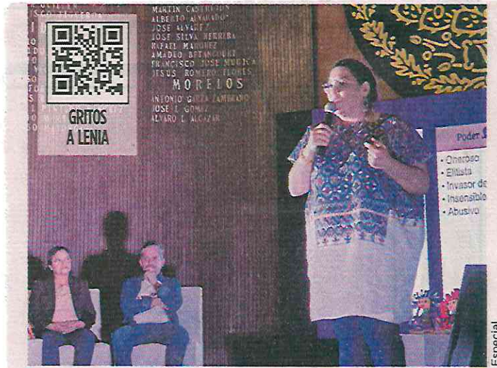
■ Lenia Batres consideró absurda la elección gradual de Jueces y Magistrados del PJ en el Teatro de la República, en Qro.

En el caso de Esquivel, propuso que la elección por voto popular fuera de todos los integrantes de la Suprema Corte de Justicia de la Nación (SCJN) y del nuevo Tribunal de Disciplina Judicial, y en el caso de Jueces y Magistrados una sustitución escalonada.