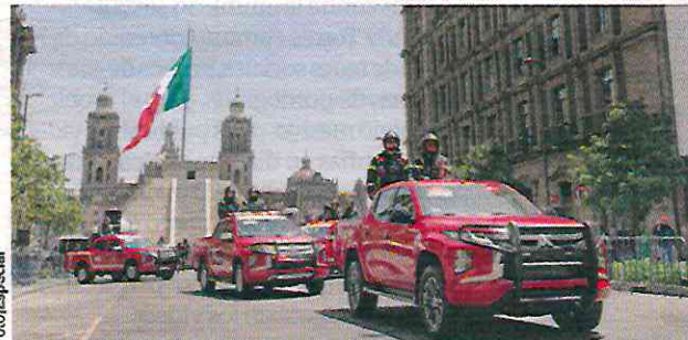
BOMBEROS capitalinos, durante la recepción de los 13 automóviles entregados por el Gobierno local, ayer, en el Zócalo.

Millones de pesos es la inversión prevista de todas las unidades.