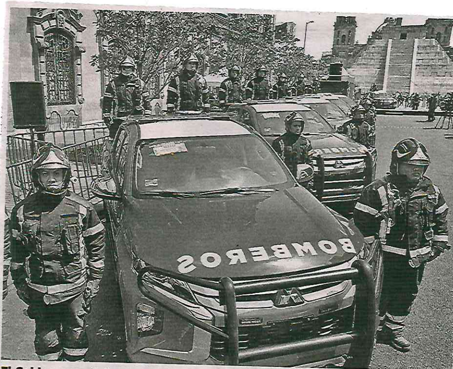
El Gobierno capitalino entregó las 13 nuevas unidades a los bomberos en la calle 20 de Noviembre

de bomberos en Milpa Alta y próximamente vamos a inaugurar las obras que se realizaron en la estación de bomberos de Tacubaya, es decir, vamos a seguir apoyando al Heroico Cuerpo de Bomberos, porque no hay un equipo que sea más valiente, audaz y más entregado que el del Heroico Cuerpo de Bomberos”.