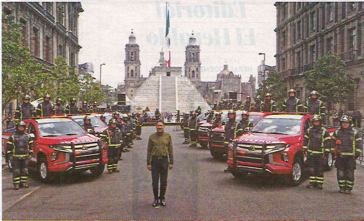
● HONOR. El jefe de Gobierno de la capital dijo que los bomberos son un equipo valiente, audaz y entregado.