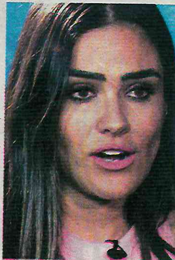
Se opone al recuento de votos en Cuauhtémoc

De las 35 personas seleccionadas como encargadas de dar el servicio, solo tres de ellas recibieron el apoyo