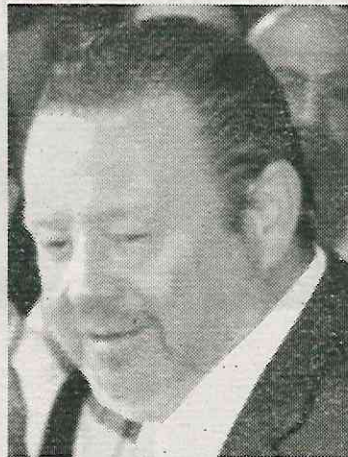
No hay registros de apoyos a comunidad LGBTTTTIQA+

“Los Puntos Arcoíris son una herramienta de alcance que forma parte de la Acción Social denominada ‘Promoción de los Derechos LGBTTTT’. En estos Puntos Arcoíris no hay un protocolo de acción para brindar apoyo directo, ya que estos se centran en la difusión de la cultura de la no discriminación, la promoción de los derechos y la inclusión de las personas LGBTTTTIQA+” respondió la alcaldía desde su Enlace de la diversidad sexual adscrito a la Dirección General de Desarrollo Social, encargada de llevar a cabo los