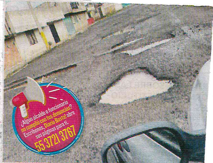
Los socavones en varios puntos de la alcaldía

Fueron expuestos 10 casos que ya han sido reportados en la colonia Bosques de la Reforma