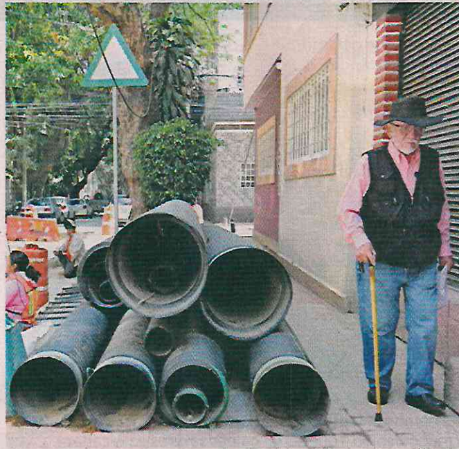
Las calles fueron cerradas para el tránsito vehicular y dificultan el paso peatonal, acusaron vecinos.

“Una obra así toma más de seis meses, aquí llevamos mes y medio, (...) (para terminar en) enero”.