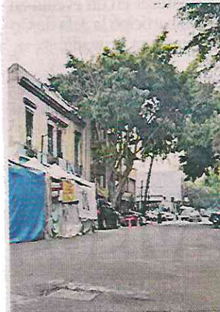
■ El campamento ubicado en Calle Abraham González lleva cinco meses.

“En la Colonia se han atendido otros campamentos, pero no todos, lo que hemos pedido es que el mismo trato y acuerdos a los que se llegó con los otros grupos (...) y que no nos dejen fuera de las mesas de diálogo”.