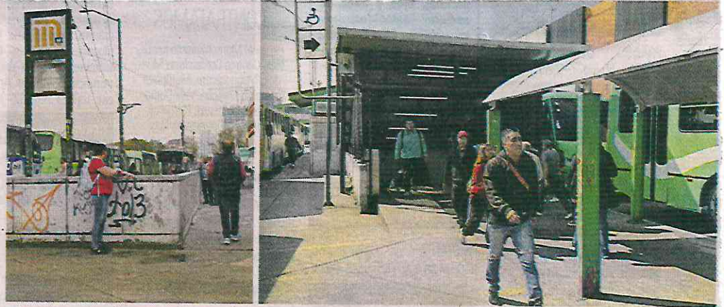
■ Al menos 3 mil comerciantes laboran en la zona, pero ayer ninguno de ellos colocó su puesto, pues se llegó a un acuerdo con la demarcación para realizar la limpieza.

“Esta acción estará coordinada por el equipo de Ju-