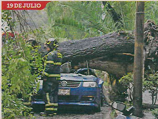
■ Hace siete meses, el tronco de un árbol cayó sobre un auto.