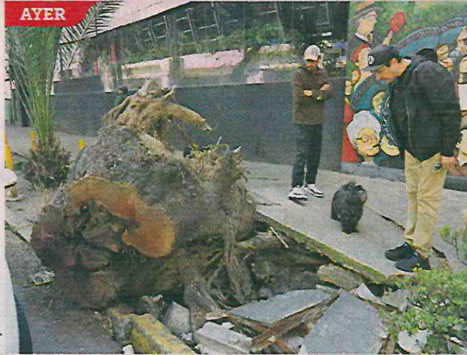
■ La base del árbol permanece en la Calle Filadelfia, en la Colonia Nápoles, Alcaldía Benito Juárez.