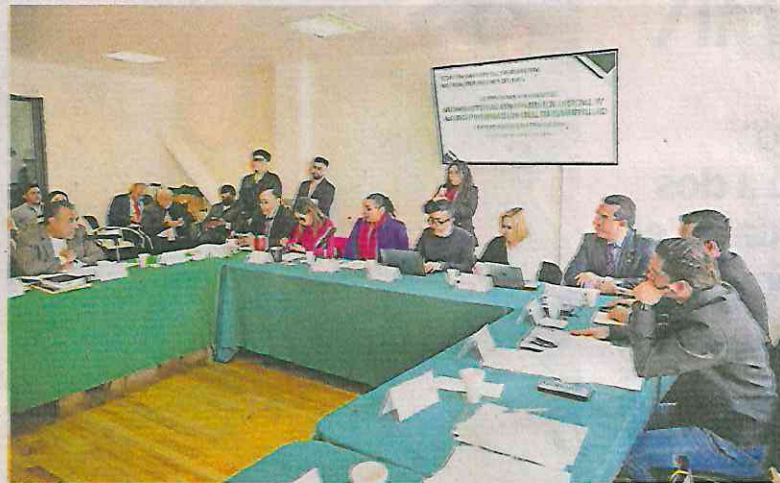
Los primeros aspirantes comparecieron ante las comisiones unidas de Administración Pública Local y de Planeación del Congreso local.