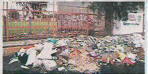
· Más de 60 casas sufrieron afectaciones

“Seis de cada 10 anegaciones en la Ciudad de México son ocasionadas por la basura arrojada en las calles, basura que obstruye la entrada al