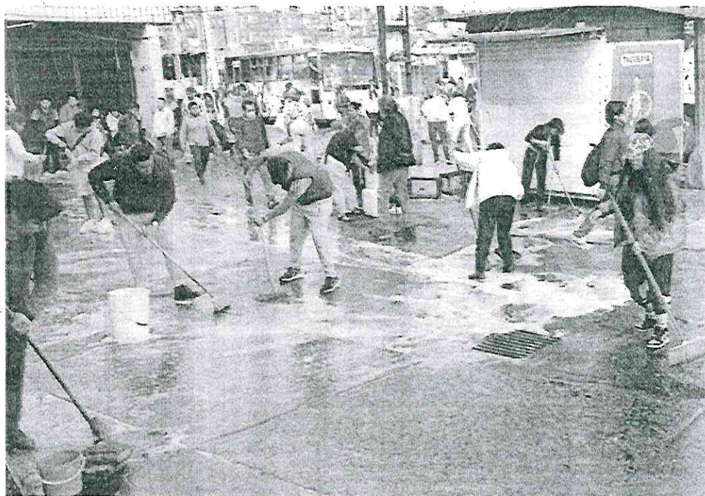
ESCORA EN MANO. Una cuadrilla de trabajadores de la Alcaldía Miguel Hidalgo limpió grasa y retiró la basura de calles y banquetas de la Cetram.

Mauricio Tabe, Alcalde de la demarcación, acudió ayer al lugar acompañado por equipos de limpieza para dar mantenimiento al espacio del que, actualmente, también da cabida al trans-