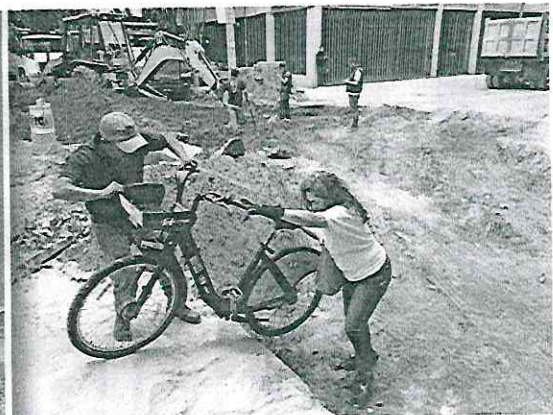
DIFÍCIL ACCESO. Desde finales de noviembre, la Calle Gobernador Gregorio Gelati comenzó a ser renovada, con la demolición de la carpeta asfáltica en seis cuadras.