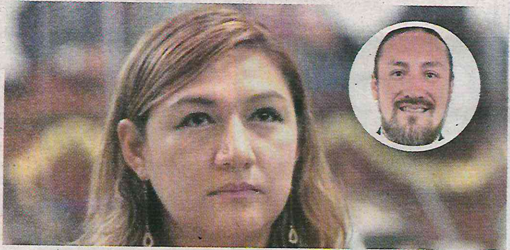
Se benefició con varios contratos dentro de la demarcación

Es de señalar que en el sitio QuiénEsQuién, revela un enlace para la visualización de los contratos con el