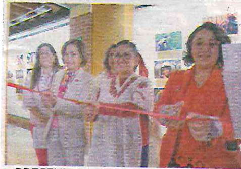
● PRESENTE. Inauguró una exposición.