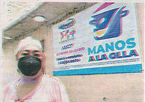
Cifras presentadas, sin coincidir

se planeó el apoyo de hasta 12 mil niños, la administración informó sobre el desconocimiento del padrón de beneficiarios, detalló que aún no se ha definido quienes recibirán la ayuda gubernamental.