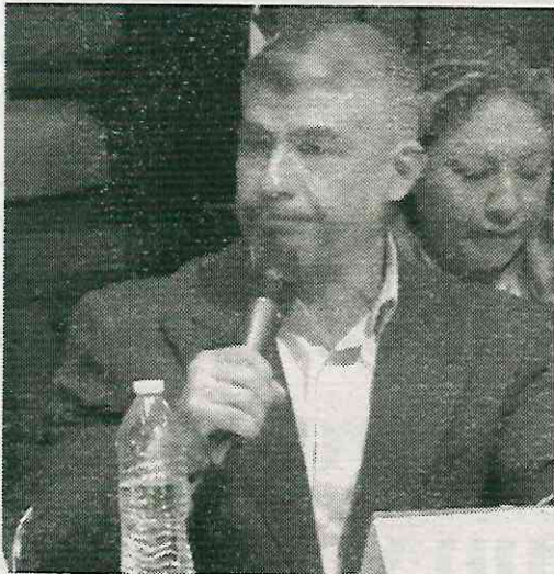
Se entromete en asuntos ajenos a su cargo