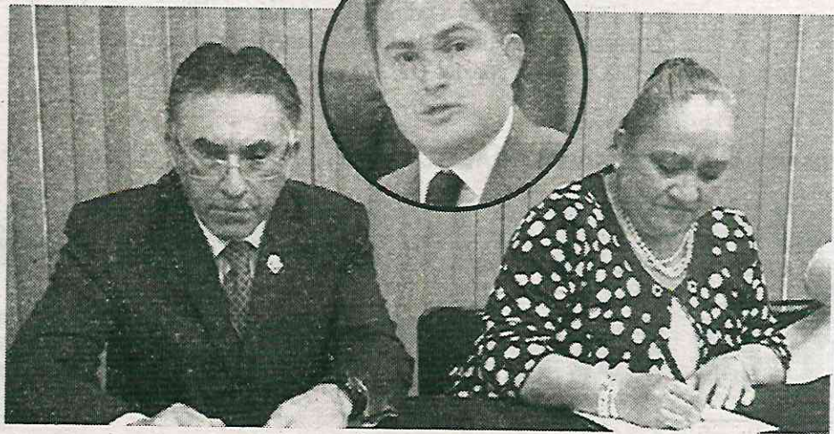
El alcalde la designó en su equipo, fue funcionaria en otra entidad

El área mencionada es la encargada de promover acciones sociales y programas para la población vulnerable. La nueva funcionaria es parte del padrón de