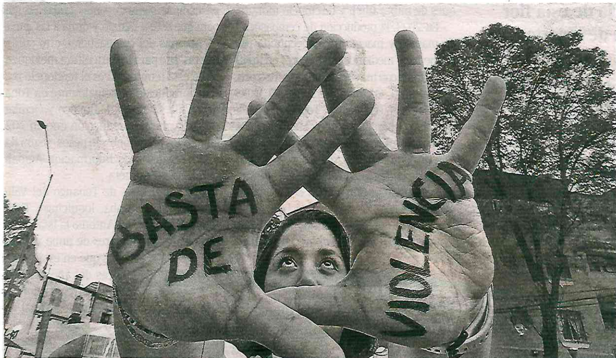
Lucha común ante la violencia, una realidad alarmante que afecta a millones de mujeres

Además, pidió a los congresistas de la III Legislatura a que presenten preponderantemente durante el mes de noviembre, instrumentos legislativos relacionados a la eliminación de la violencia contra la mujer y el inicio de los 16 días de activismo contra la violencia de género.