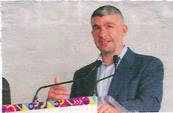
EL ALCALDE en Miguel Hidalgo, Mauricio Tabe, durante una conferencia en la demarcación.