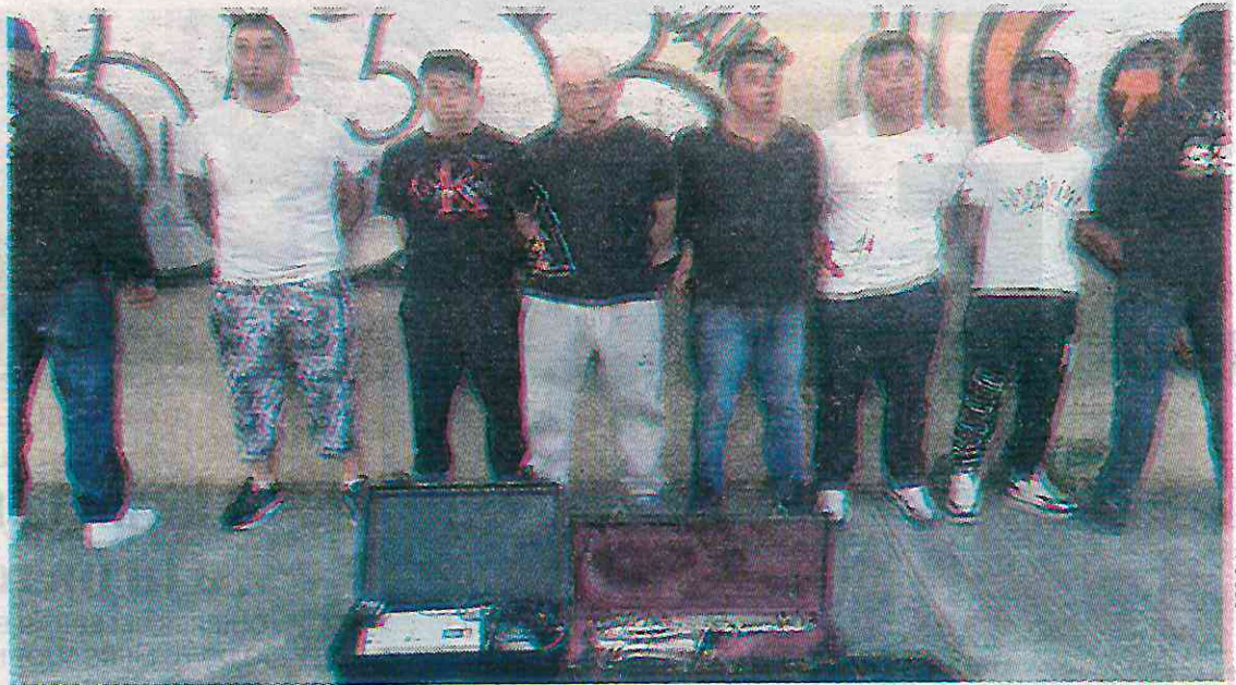
Ya no seguirán delinquiendo

El robo del que se les imputa sucedió cuando los seis ingresaron a una vivienda en Álvaro Obregón, amenazando al residente con un cuchillo y despojándolos de objetos de valor, incluyendo una camioneta.