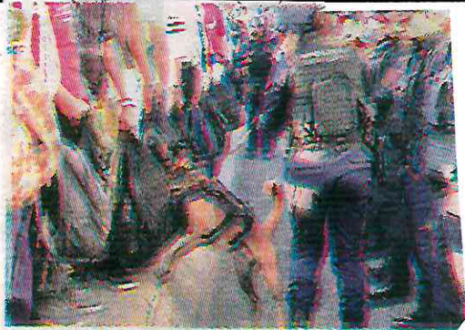
Los canes inhibieron a los delincuentes