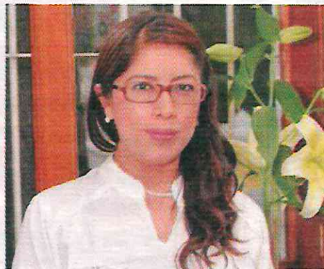
LA EXFUNCIONARIA, en imagen de archivo.

ANTE UNA AGRESIÓN , la exsubprocuradora sugiere a las víctimas acudir al servicio médico de inmediato; por la falta de la legislación de sujeción química, el ilícito se trabajaba bajo un supuesto de violación, indica