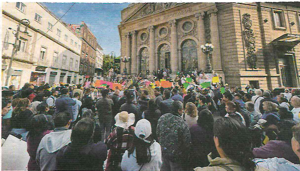
Manifestación frente al Congreso capitalino.

Los defensores de la llamada Fiesta Brava insisten en que se realice una consulta a pueblos y barrios originarios