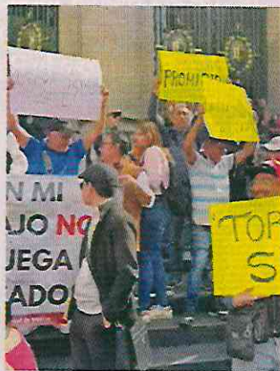
Con consignas y lonas, protestaron contra la iniciativa.

La Comisión de Puntos Constitucionales e Iniciativas Ciudadanas del Congreso local sostuvo ayer una reunión con el gremio gallero y taurino para escuchar sus consideraciones ante la dictaminación de la iniciativa