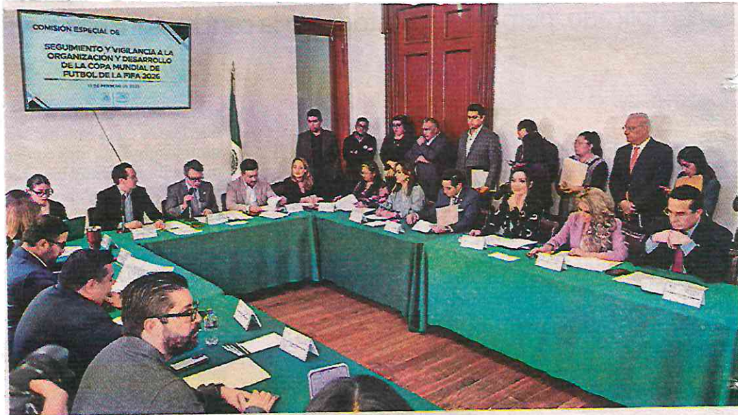
Trabajos de la Comisión Especial de Seguimiento y Vigilancia para el Mundial 2026. ESPECIAL