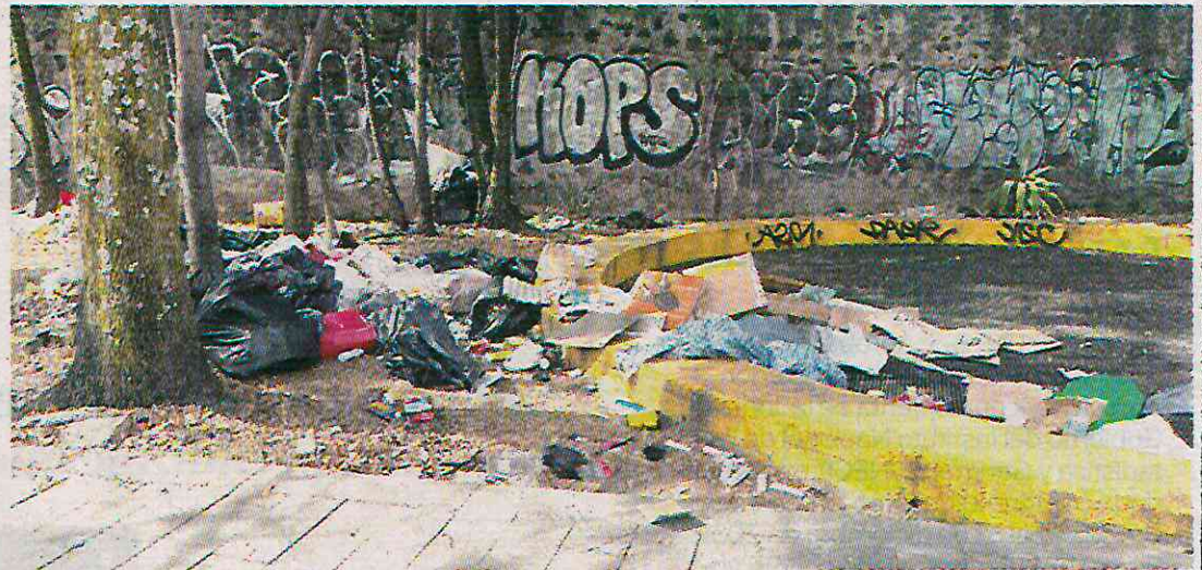
Desde 2021 entró en vigor una reforma para eliminar la subcontratación

En el reporte que hizo la nueva administración, indicó que el contrato se hizo durante