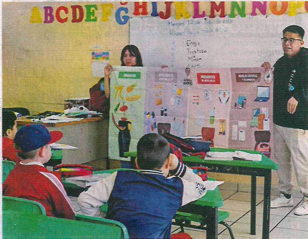
Personal de la Alcaldía acude a escuelas a promover el cuidado del medio ambiente.