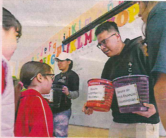
■ Durante las jornadas se promueve el programa Pilas por Balones, el cual recolecta baterías en las escuelas.

Como parte de estas iniciativas, también se promueve el programa Pilas por Balones, que incentiva la recolección de baterías usadas AA, AAA, C, D, CR, de botón, cuadradas y de celular para su adecuado tratamiento.