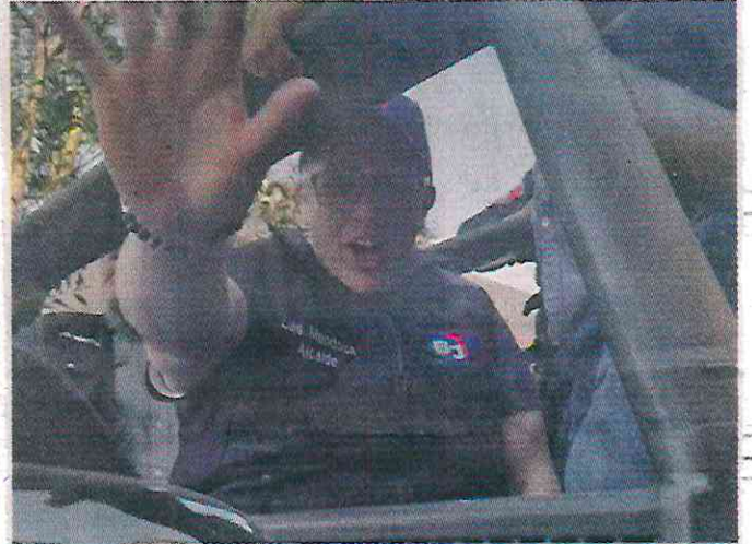
■ En el video se puede ver al Alcalde Luis Mendoza dar un manotazo al celular de la persona que lo graba.

Ayer, en un comunicado, la Alcaldía insistió que, sin fundamento, el Mandatario ha sido acusado de robo y agregó que la grabación está manipulada y sacada de contexto.