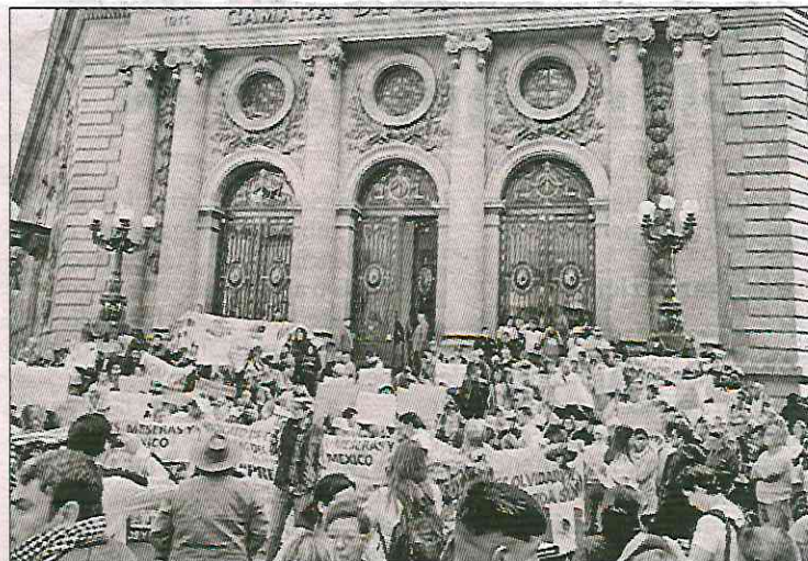
▲ Opositores a la iniciativa que busca prohibir las corridas de toros alertaron al Congreso capitalino sobre la pérdida de sus empleos de aprobar dicho proyecto.

Arriaga Bidales dijo que la Ciudad de México es un bastión para las corridas de toros al tener la plaza más grande de Latinoamérica, y "pretender borrarla de un plumazo es acabar con miles de empleos; además, pone en riesgo al toro de lidia, cuya atención es costosa.