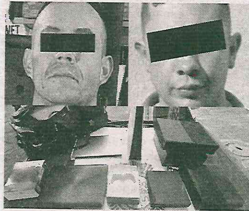
Les cayeron en la maroma

Al notar la presencia de los efectivos, varios sujetos descendieron del vehículo y huyeron corriendo, pero rápidamente los oficiales le dieron alcance a dos de ellos