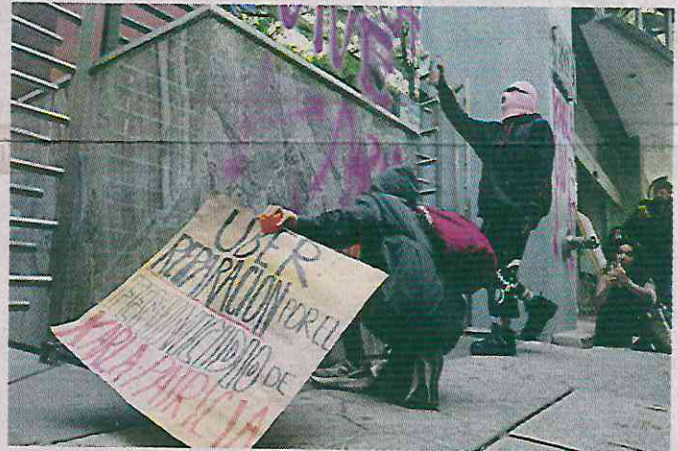
■ Inconformes exigían frenar la violencia hacia las mujeres con múltiples consignas e incluso realizaban pintas a su paso.

“Ahora ella ya no está. Mi hermana y yo nos quedamos