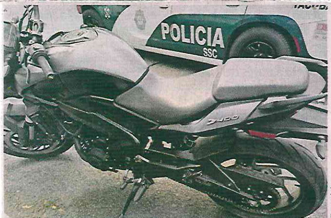
■ La motocicleta que usaba el supuesto integrante de La Unión Tepito tenía reporte de robo del 28 de agosto pasado.

de México, en 2016, por los delitos de tentativa de homicidio y tentativa de robo calificado.