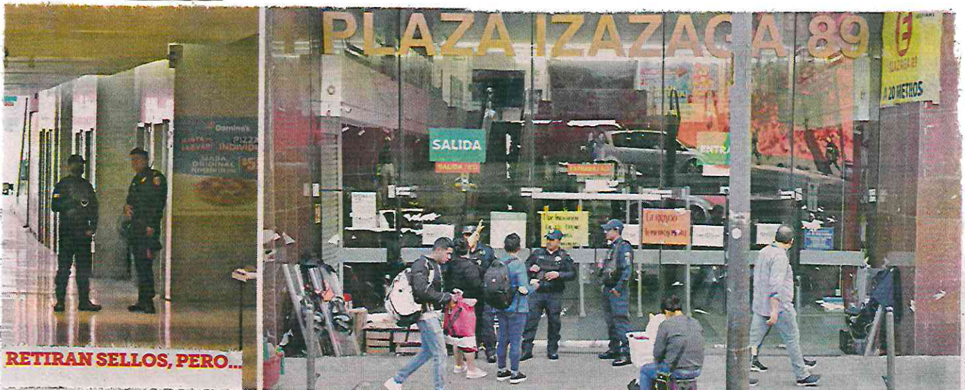
RETIRAN SELLOS, PERO...

Pese al retiro de la sanción, en la Plaza de Izazaga 89 no se reactivó el comercio de productos importados desde Asia.