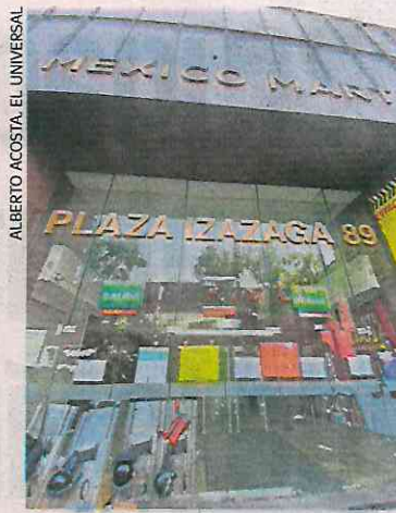
En carteles se informa que la plaza seguirá cerrada hasta nuevo aviso.

A diferencia de días anteriores, este jueves no hubo movimiento de locatarios que sacaran su mercancía, pues estuvo cerrado el ac-