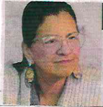
Nashieli Ramírez , titular de la CDH

El organismo expuso que algunas autoridades mostraron su rechazo a las recomendaciones que se emitieron por violaciones a derechos humanos, entre ellas, dos al Instituto de Vivienda (INVI) y otras más a la FGJ y la SSC.