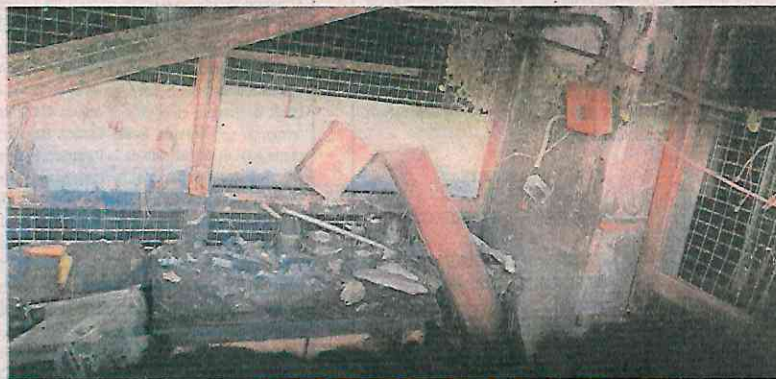
La Fiscalía General de Justicia continúa con la integración de la carpeta de investigación para determinar las causas del incendio.