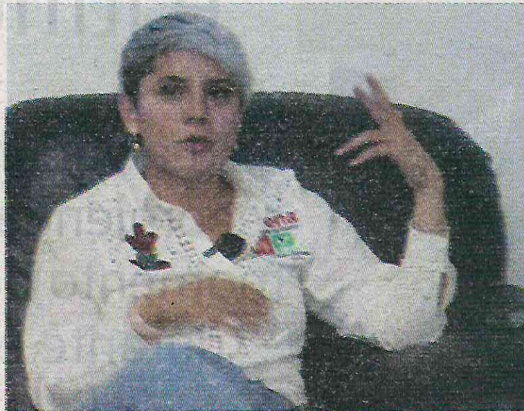
La alcaldesa ha sido omisa al tema dentro de Xochimilco