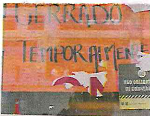
Los dueños optaron por cerrar la plaza hasta nuevo aviso.

En junio, REFORMA publicó que, después de la pandemia, al menos 13 calles del Primer Cuadro sumaron 17 edificios y cientos de negocios que fueron convertidos en bodegas y lugares para venta de este tipo de artículos.