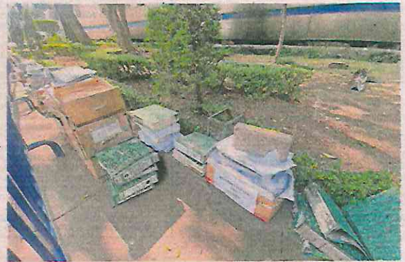
Tras vallas metálicas quedaron resguardados documentos identificados con diversas direcciones y folios.