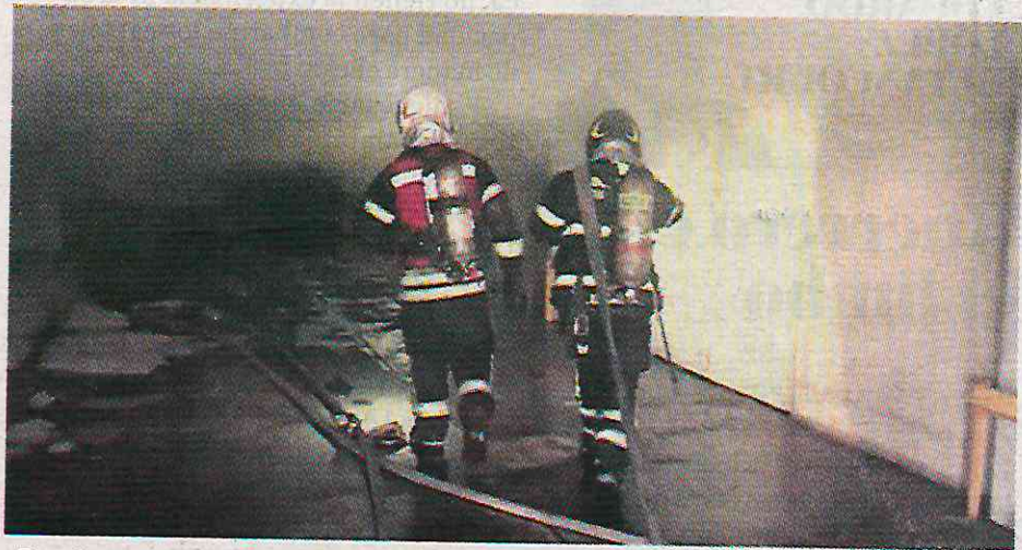
Donde ocurrió el suceso era un taller de electricidad y carpintería

“En este lugar habían solventes, pero no habían extinguidores, hidrantes en caso de incendio, todo estaba obstaculizado, la verdad es que las condiciones de estos es-