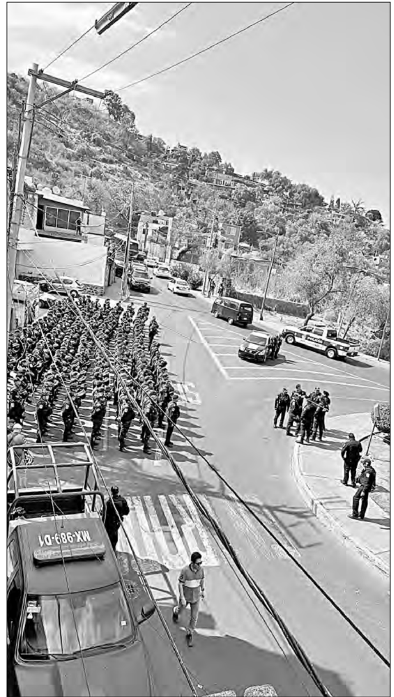
◀ Un numeroso grupo de habitantes del barrio Santa Marta encaró a los uniformados con piedras, palos y machetes, por lo que éstos se retiraron para evitar un conflicto.

Otros vecinos expusieron que no debe olvidarse que de los 12 pueblos que constituyen la demarcación nueve pertenecen a la comunidad indígena, las cuales son copropietarias de las tierras comunales y que la Constitución las protege.