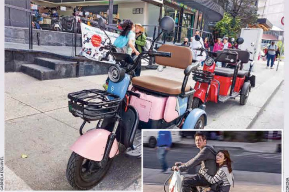
MOTIVOS. El uso de bicicletas, scooters y triciclos aumentó considerablemente, por ello, las autoridades capitalinas buscan su ordenamiento.

"Creo que debemos dividir cuáles vehículos son los que debemos de emplacar