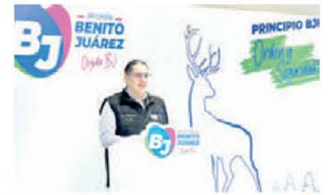
Afirmó que es por el bien de los vecinos de esa demarcación.