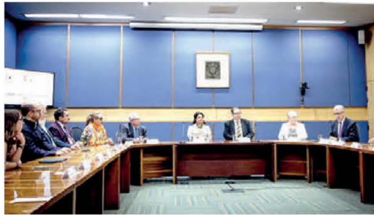
La celebración del convenio se llevó a cabo en la torre de Rectoría.

SOSTUVIERON QUE LA coordinación es en beneficio de la urbe y la comunidad universitaria