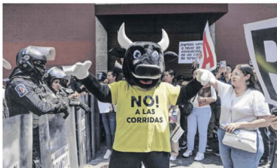
Antes de que se aplazara la discusión sobre la prohibición de corridas de toros, grupos antitaurinos se manifestaron afuera del Congreso capitalino este 11 de marzo.

"Si se pueden combinar las dos cosas, creo que sería la mejor", añadió la Mandataria.