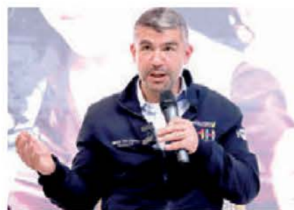
Los funcionarios denunciaron al alcalde ante la FGJ.

Mientras que Romo Guerra, ex alcalde esa demarcación, señaló que la Auditoría Superior de la Federación (ASF) fiscalizó el uso de las participaciones federales asignadas a la Alcaldía Miguel Hidalgo en 2023, y encontró un posible daño al erario por más de 70 millones de pesos en ese año y 22 millones en 2022, sumando un total de más de 90 millones de pesos desaparecidos durante la gestión de Mauricio Tabe.