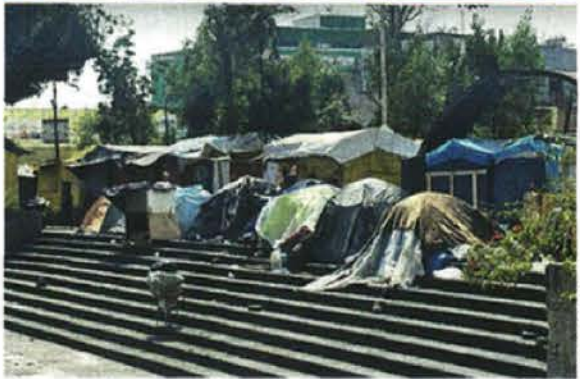
PAGAN TODO. Si bien las condiciones bajo las que viven no son las mejores, deben pagar para asegurar su estancia.