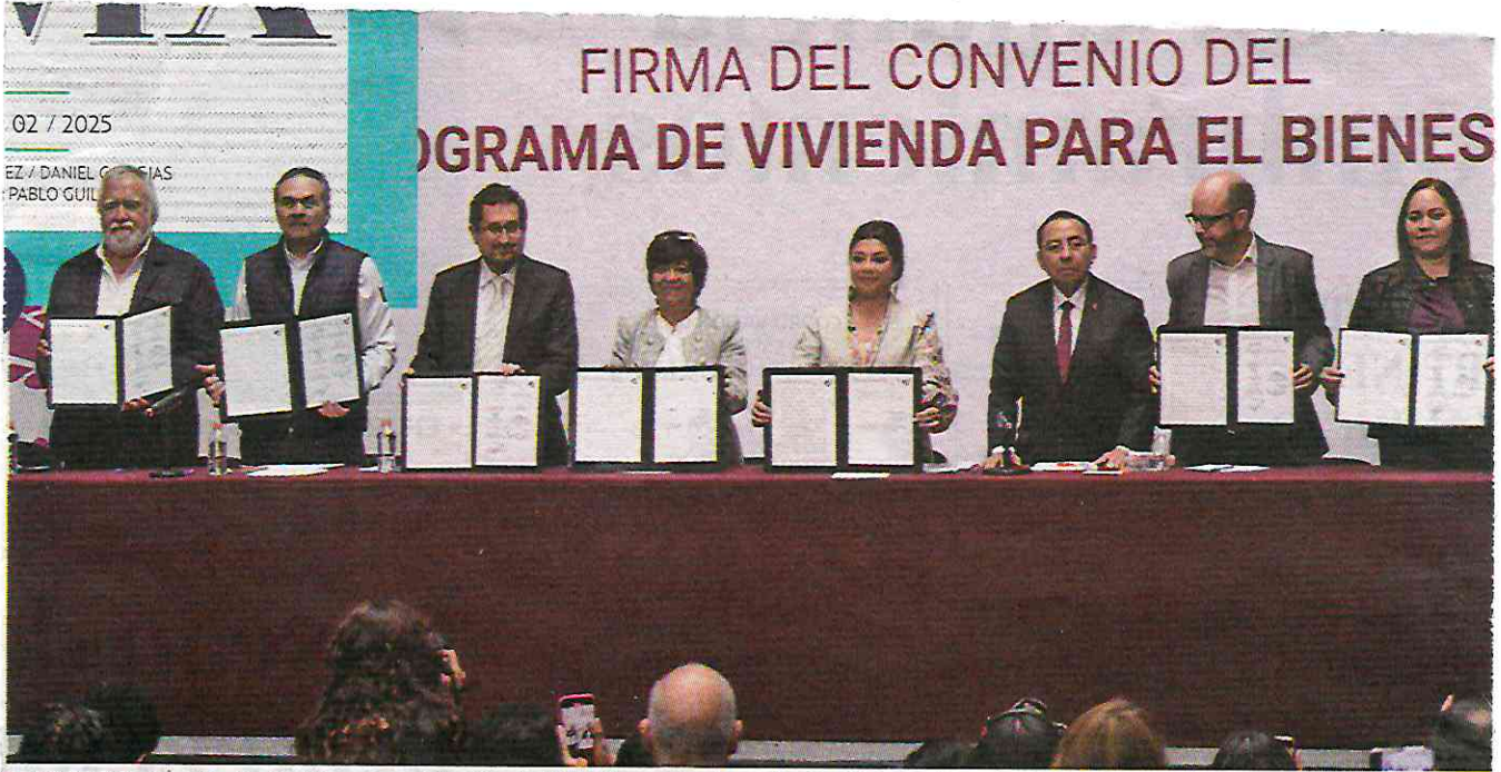
• ACCESO. La jefa de Gobierno agradeció a la Presidenta incluir a la CDMX en el programa de Vivienda para el Bienestar.