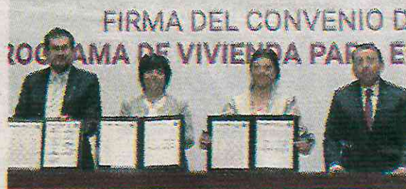
Para cumplir la meta de construcción de casas

Se prevé que en la Ciudad de México se construyan 26 mil nuevas viviendas del Infonavit y mil a través de Conavi. También se estima que la producción de casas genere 121 mil empleos directos y 182 mil empleos