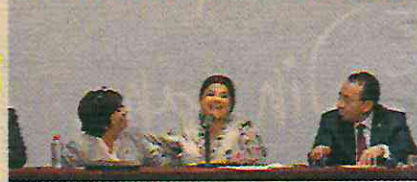
Gracias a la colaboración entre el gobierno capitalino y el Gobierno federal se logrará el derecho a una vivienda digna y asequible.