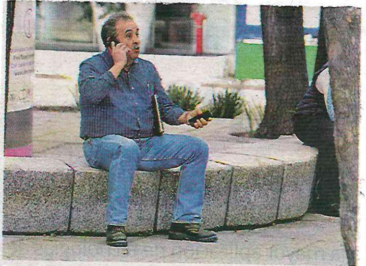
Los cobros se realizan mediante extorsiones.

Mientras que el 45 por ciento restante corresponde a reportes en Ciudad de México, con mayor incidencia en las alcaldías Iztapalapa, Gustavo A. Madero, Álvaro Obregón, Tlalpan y Cuauhtémoc.