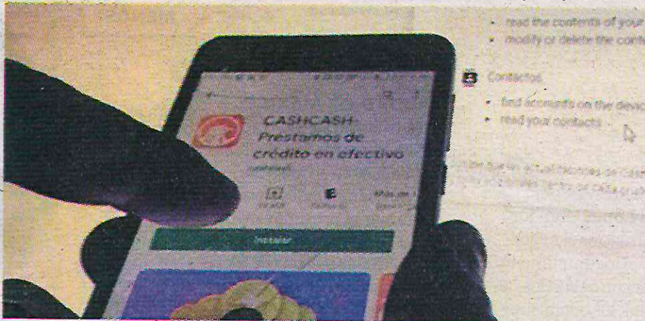
Durante la cuesta de enero se detectaron 303 nuevas aplicaciones

El 33% de las empresas de apps ilegales que extorsionan a los capitalinos, operan en la impunidad en estas dos alcaldías