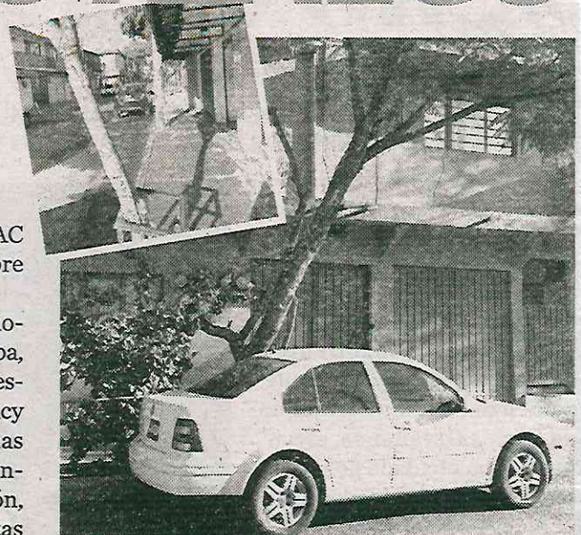
· Suman mil 337 denuncias desde octubre pasado

Algunos vecinos o trabajadores de negocios en la zona, sostienen los pesados árboles con cuerdas amarradas a partes de sus inmuebles, para así evitar accidentes. Durante el pasado mes de diciembre, trascendieron cinco incidentes en los que se vieron involucrados estos árboles en la alcaldía Azcapotzalco, y en tres de ellos se vieron afectados vehículos que transitaban por el lugar.