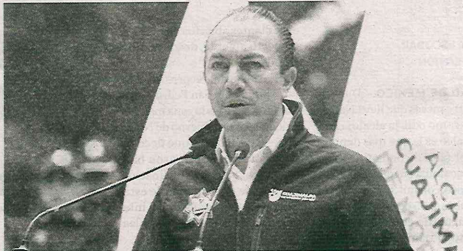
La alcaldía sufre los estragos de un mal gobierno

De igual manera, acusaron que en el panista ha sido omiso a las solicitudes de reparación de las vialidades, las cuales, denunciaron estar llenas de baches, así como la falta en los registros de coladeras sin que estas sean atendidas y las nulas accio-