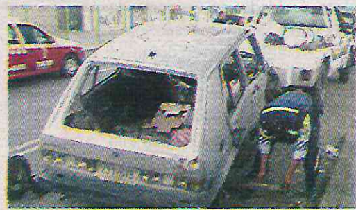
· Aún hay decenas en la vía pública

Algunos de los vehículos son camiones pesados, que incluso bloquean la mitad del ancho de calles estrechas. El 10 de enero, el gobierno de Álvaro Obregón afirmó que retiró vehículos abandonadas en la zona, como parte de su su puesta labor para la "recuperación del espacio público".