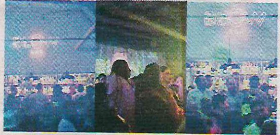
Los establecimientos no siguen las normas