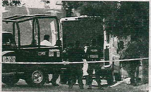
Sus estrategias no han dado resultados positivos

Miguel Hidalgo ocupa el tercer lugar en robo con violencia con una tasa del 19.71 por ciento