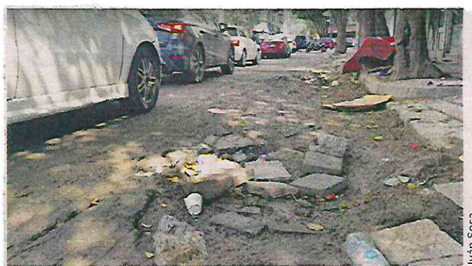
■ Así luce Tokio, entre Toledo y Sevilla, en la Colonia Juárez. Tres semanas después, las obras no han sido reanudadas.